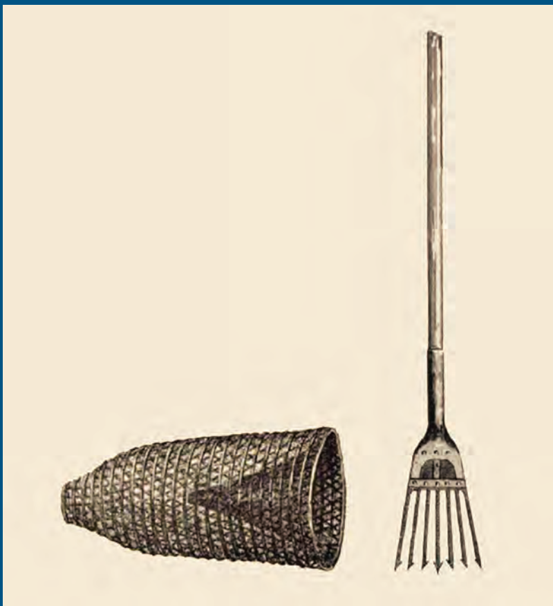
Ribarski alati: lijevo – vrša (Lorini, 1903., 104); desno – osti (Lorini, 1903., 109)