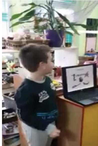
Slika 3. Predstavljanje prezentacije o gmazovima u programu PowerPoint štenjem informacijsko-komunikacijske tehnologije

Prema Whitebread i sur. (2007), metakognitivna su iskustva ona koja djetetu omogućavaju svijest o vlastitim mentalnim procesima, vlastite strategije učenja i metakognitivnu kontrolu mentalnih procesa. Digitalne tehnologije