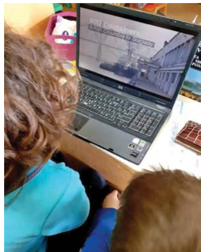
Slika 4. Uloga informacijsko-komunikacijske tehnologije u socijalnoj interakciji djece