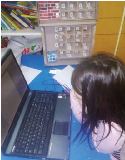
Slika 1. Razvoj rane pismenosti korištenjem informacijsko-komunikacijske tehnologije

prostorno-materijalnom okruženju koje pruža djetetu mogućnost da svoje zamisli, ideje izrazi ili simboličkim reprezentacijama ili pisanim bilješkama. Flewit i sur. (2014) smatraju da potencijal korištenja digitalnih tehnologija leži isključivo u kontekstu u kojem se ono odvija i uvjetuju ga materijalni resursi, tj. opremljenost okruženja digitalnim tehnologijama. Nadalje, jasna definicija korištenja digitalnih kompetencija u kurikulumu uvelike pomaže pri planiranju odgojno-obrazovnog procesa. Budući da su roditelji darovali odgojnoj skupini prijenosno računalo, odgojiteljica je na samom početku pedagoške godine iskoristila prijenosno računalo kao poticaj u prostorno-materijalnom okruženju centra za početno čitanje i pisanje kako bi putem prijenosnog računala potaknula razvoj digitalnih kompetencija i razvoj rane pismenosti. Razvoj rane pismenosti važan je za razvoj komunikacijskih vještina djece. Berbić Kolar i Vukašinović (2020) ističu da je potrebno dječju izloženost slovima usmjeravati ka kontekstu igrovnih situacija. Tijekom igre dijete vizualno uočava oblike slova i povezuje izgovorenu i pisanu riječ. Korištenje digitalnih alata potiče djecu na uočavanje veze između slova i pisane riječi. Razvoj fonološke svjesnosti odvija se upravo putem informacijsko-komunikacijske tehnologije (Slika 1).