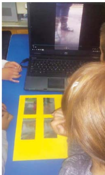
Slika 5. Informacijsko-komunikacijska tehnologija kao temelj samoevaluacije djece

i razvoj digitalnih kompetencija upotrebom digitalne tehnologije pružaju djeci mogućnost samorefleksije i evaluaciju vlastitih postignuća i procesa učenja (Slika 5).