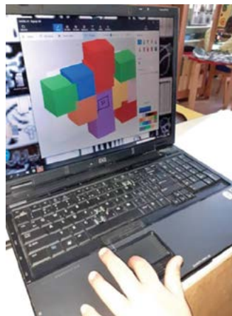
Slika 6 i Slika 7. Pretvorba 2D u 3D putem informacijsko-komunikacijske tehnologije