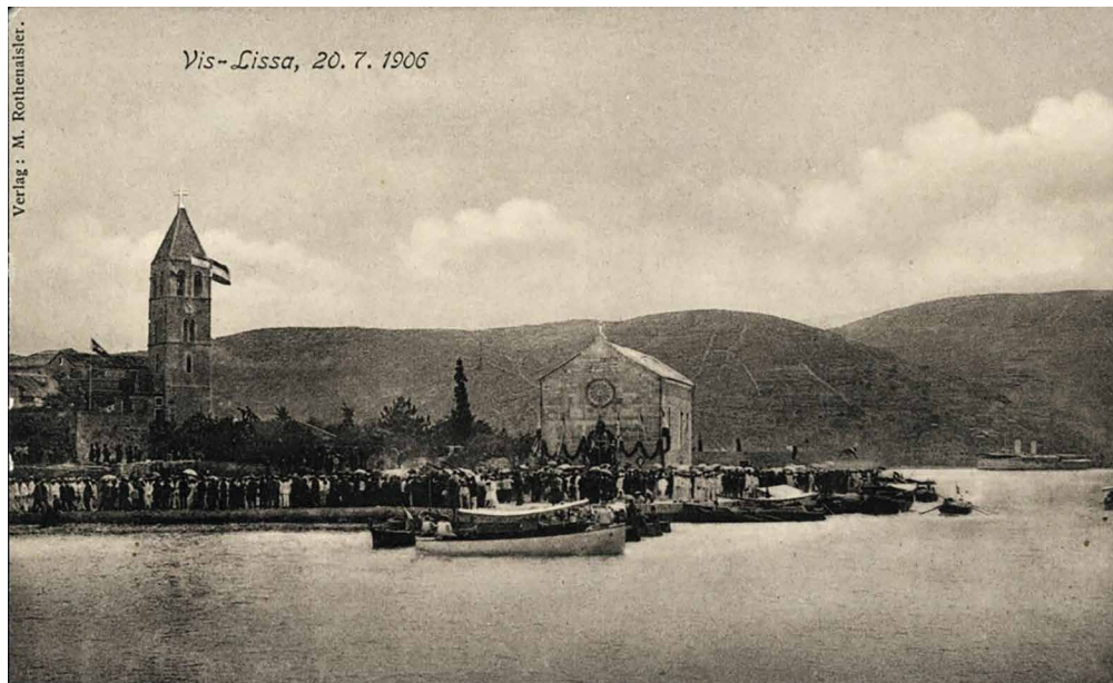
Vis, 1906., stara razglednica