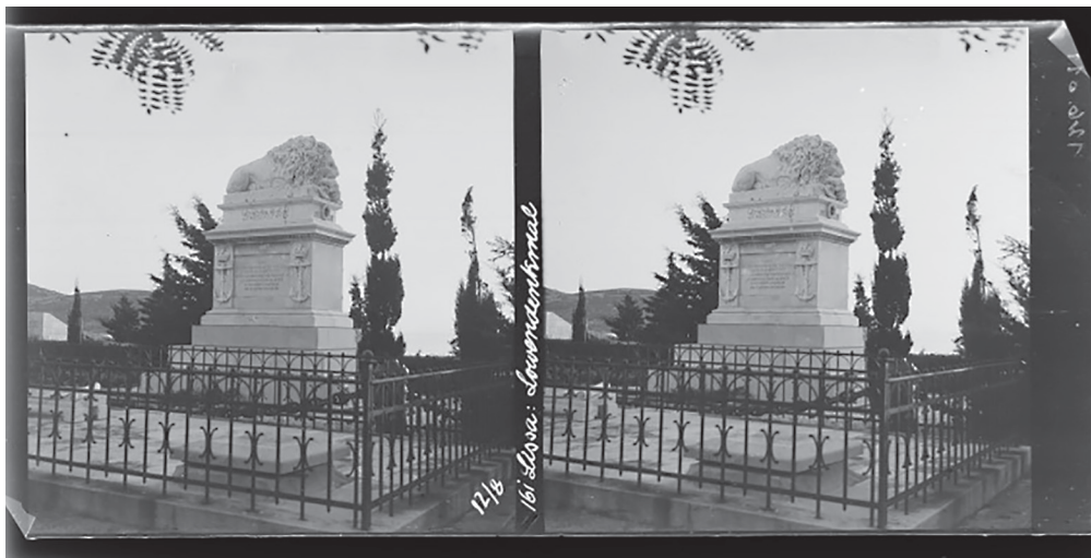
Spomenik, groblje, Vis

Prilikom istraživanja analizirano je samo četvrto (iz 1899.) i deseto izdanje (iz 1912.) Hartlebenova turističkog vodiča Illustrierter Führer durch Dalmatien längsts der Küste von Albanien bis Korfu und nach den Ionischen Insel . 8 U oba se izdanja opisuju bogata povijest otoka i Viška bitka. Groblje u Visu opisuje se kao mjesto pijeteta za poginule. Iz opisanog je vidljivo da je nadgrobnji spomenik „lav koji spava“ shvaćen kao turistička atrakcija otoka. 9 Dok je u četvrtom izdanju vodiča priložena samo fotografija grada Visa, u desetom izdanju priložena je fotografija nadgrobnog spomenika.