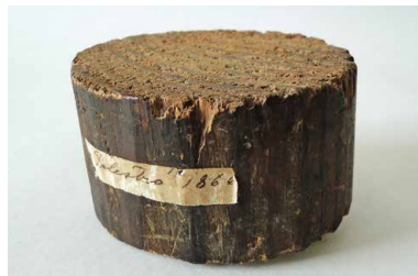
Dio zastavnog koplja s broda Palestro koje je sa zastavom tijekom boja oteo Hvaranin Nikola Karković

Dio zastavnog koplja (HPMS-775:SLT-419-ZZ). Dimenzije: visina: 6,6 cm, promjer: 4 cm. Dio zastavnog koplja s broda Palestro koje je sa zastavom tijekom boja oteo Hvaranin Nikola Karković. Zastava i koplje razdijeljeni su na više dijelova nakon bitke.