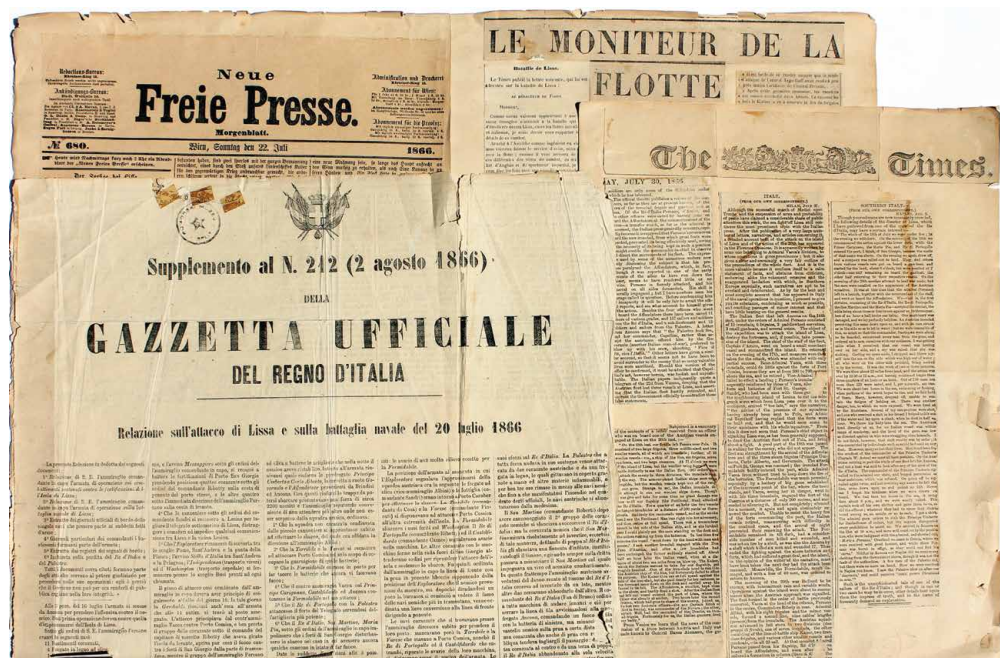
Novinski isječci s člancima o Viškom boju zalijepljeni na podlogu od platna

Novinski isječci zalijepljeni na podlogu od platna (HPMS-775:SLT-2675-ZPDG). Dimenzije su 66 x 44 cm. Napisi iz novina: Neue Freie Presse , Le Moniteur de la Flotte , Gazzeta Ufficiale del Regno Italia i The Times o Viškom boju zalijepljeni su na čvrstu platnenu podlogu. Vjerojatno je taj kolaž načinjen 1866. godine.