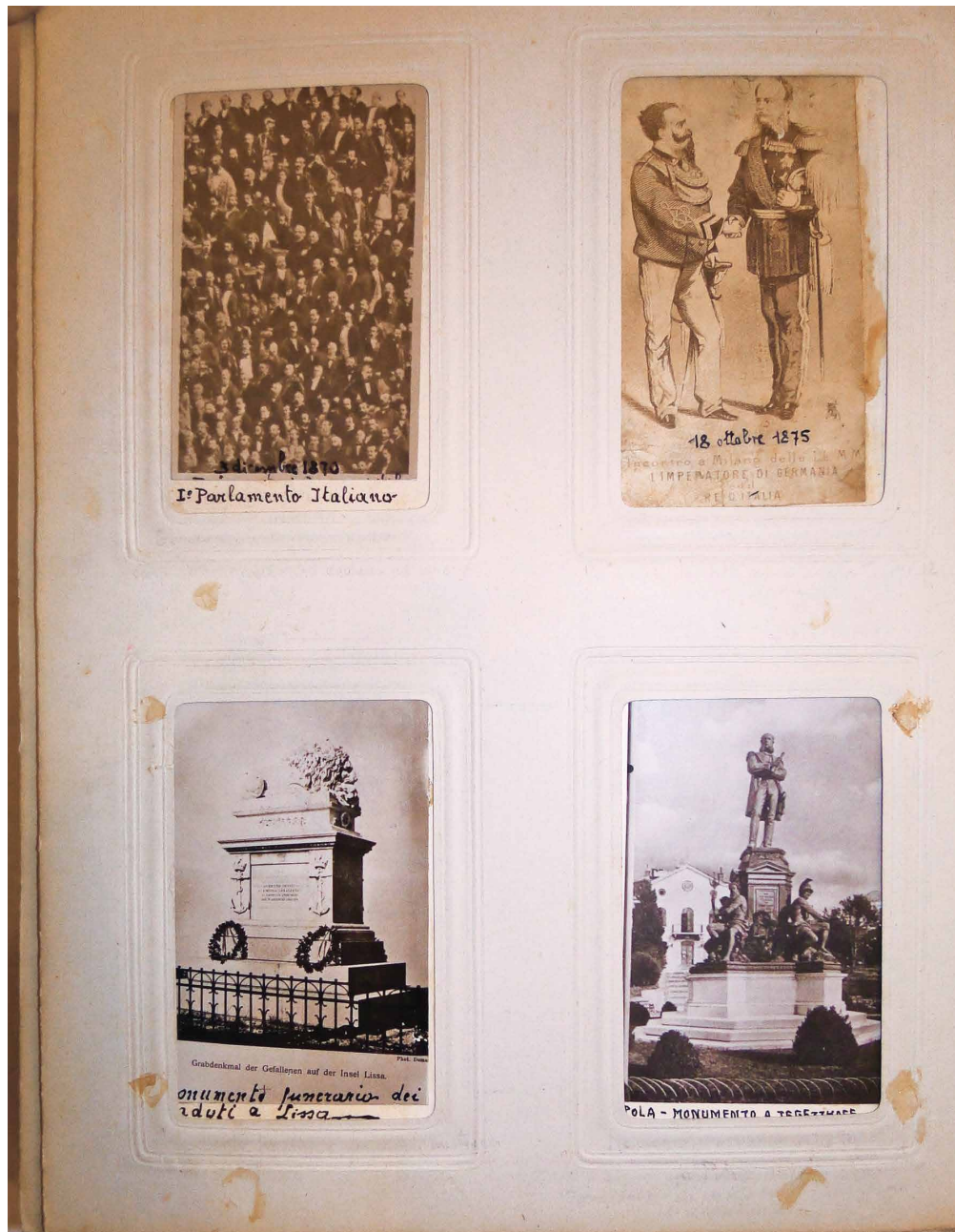
Stranica iz albuma s fotografijama koji sadrži fotografije istaknutih ljudi u političkom i društvenom životu uoči, za vrijeme i nakon Viškog boja