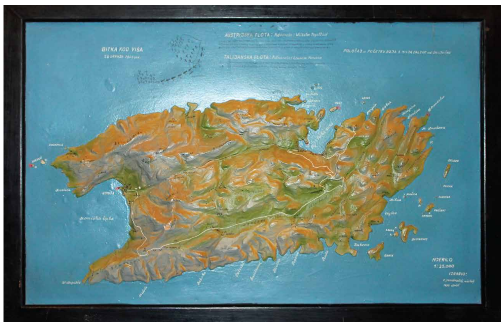
Reljef s ucrtanim rasporedom brodova pred Oključnom uoči Viškog boja 20. srpnja 1866.