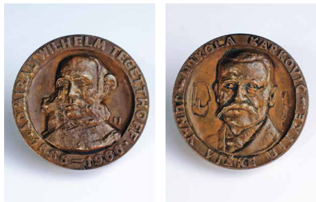
Spomen medalja Stogodišnjica Viške bitke, na aversu prikazan Wilhelm von Tegetthoff, a na reversu Nikola Karković

Puška na kremen (HPMS-775:SLT-859-ZO). Dimenzije: dužina: 153 cm. Izrađena je u kombinaciji drva i metala. Korištena je u Viškom boju, a nedostaje šipka za nabijanje.