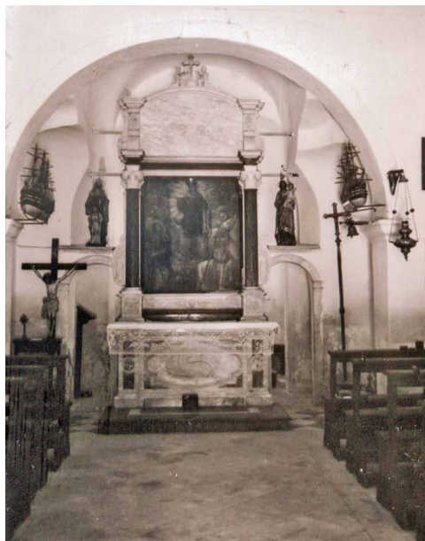
Makete Jerka Kovačića u crkvi Svetog Stjepana u Pučišćima 1970-ih

U mjestu je sačuvana predaja da su nekad postojale četiri makete u svetištima i poznato je da je jedna nestala, no nije poznato kako i kada. Budući da je malo vjerojatno da bi starac sa slike, tada u dobi od 88 godina, izradio poveću brodsku maketu, moguće je da je kraljevskoj obitelji dana jedna od maketa koju je prethodno Kovačić darovao svetištu. Naravno, to ne mora biti tako, sasvim je moguće da je Kovačić izradio i još neke makete za koje ne znamo. Makete su se do 1970-ih nalazile u crkvama što se daje zaključiti uvidom u fototeku splitskog Konzervatorskog odjela, da bi potom bile premještene u župnu kuću. Jedna od njih predstavlja fregatu Erzherzog Friedrich , a stanje snasti i opreme na palubi dosta je loše, pa joj je potrebna restauracija. Druga maketa koja je izvorno predstavljala brod Radetzky , „obnovljena“ je oko 2010. godine tako da je potpuno izgubila identitet i sada predstavlja parni jedrenjak nerealnog izgleda pod imenom Nina . Treća maketa koja predstavlja brod Kaiser restaurirana je 2012. godine i vraćena u župnu kuću.