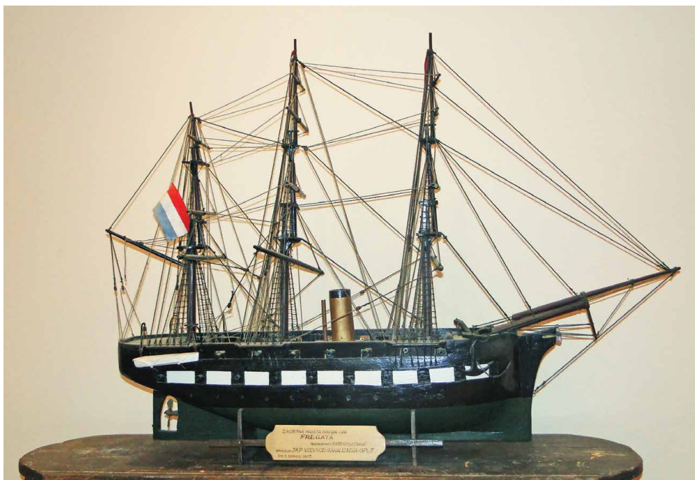
Maketa broda Erzherzog Friedrich u crkvi Gospe od Pojišana u Splitu