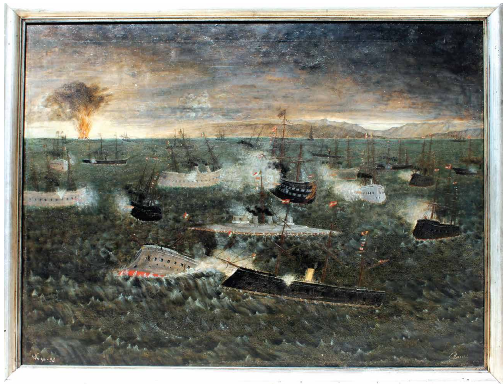
L. Rocchi: „Bitka pod Visom“, ulje na platnu datirano 1.VI.1893. donosi prikaz bitke u „metežu“

Vinko Foretić: „Talijanska flota razara Vis 1866. god.“ (HPMS-775:SLT-87-ZL). Dimenzije su 124 cm x 81 cm. Foretićevo ulje na platnu nastalo je 1953. godine. Prikazuje talijansku flotu u Viškoj luci tijekom napada na grad i vatru s obalnih bitnica. Vinko Foretić rođen je u Komiži 1888. godine, a umro je u Splitu 1958. godine. Studirao je u Münchenu i Parizu. 11