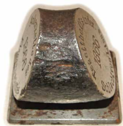
Dio sidrenog lanca s broda Erzherzog Ferdinand Max