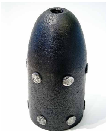
Granata kalibra 160 mm ispaljena s talijanskog broda na austrijski brod Erzherzog Friedrich

a u fundus Hrvatskog pomorskog muzeja Split ulaze tijekom 1997. i 2000. godine. Uvid u djelovanje spomenutih ustanova daje nam rad Mirje Lovrić, stoga ni ovdje nećemo ići u dublje analize nastanka, gašenja i prikupljanja građe. 1 Većina je predmeta izlagana javnosti na izložbama u Hrvatskoj i inozemstvu. Tijekom istraživanja za potrebe ovog rada mogli smo zaključiti da je predmeta vezanih za slavni Viški boj u spomenutim institucijama bilo više, no s vremenom im se izgubio trag. Ovdje donosimo jedan vid kataložskog pregleda građe koja se nalazi u Hrvatskom pomorskom muzeju Split. S obzirom na raznovrsnost građe, iznesene informacije o kataložskim jedinicama nisu ujednačene.