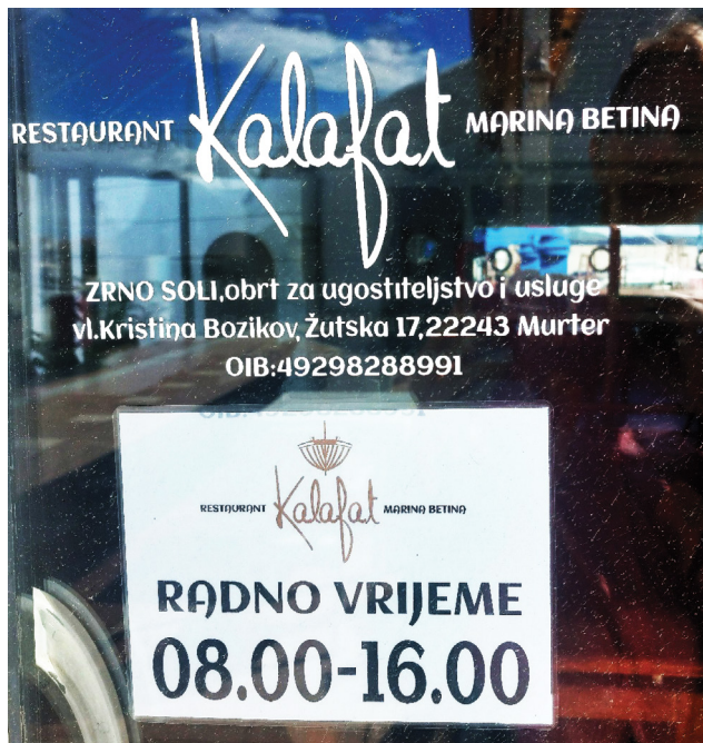
IMMAGINE 1. Orari di apertura del ristorante Kalafat .

A questa categoria appartengono i cartelli installati da diversi enti privati, come i nomi di bar, ristoranti e appartamenti, avvisi privati, menu ecc. Dei dieci ristoranti a Betina, ne analizzeremo quattro nomi di origine romanza. Una delle parole che riflettono appieno l'identità sociale e dialettale di Betina è kalafât , cioè 'il costruttore delle barche di legno' (BB 101) o 'colui che ha cura di calafatare e intonacare i navigli' (BOE 116). Calafato è 'operaio o maestro addetto all'operazione di rendere stagna un'imbarcazione, mediante stoppa catramata od altro' (VASC 66) e Kalafat ; quindi, un termine di origine veneta (BB 101), è uno dei ristoranti a Betina di lunga tradizione situato nella marina: