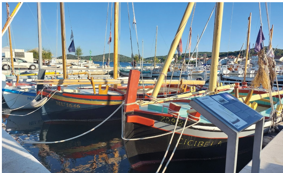
IMMAGINE 5. La sezione aperta del Museo della costruzione navale in legno di Betina con la più antica gaeta Cicibela costruita nel 1931

Per i cartelli proposti a meso-livello si intendono quelli installati da diverse associazioni culturali, come Udruga Betinska gajeta 1740 ( Associazione Gaeta di Betina 1740 ) o dalle autorità locali. In questo caso possiamo parlare della ricreazione del paesaggio linguistico di Betina sempre sulla scia della tradizione e dell'identità della costruzione delle barche di legno. A tale proposito, nel 2015 è stato inaugurato il Museo della costruzione navale in legno di Betina ( Muzej betinske drvene brodogradnje ) che consiste della parte interna del museo e di una parte all'aperto situata nel porto centrale di Betina, dove sono imbarcate le tradizionali barche di legno, maggiormente gaete. Lungo la riva, che racchiude il porto e che fa parte della piazza centrale del paese ma anche per alcune altre rive e calle di Betina si trovano i cartelli intitolati in dialetto Marin škver , Ćirov škver , Gajeta Cicibela e simili. Škver deriva dalla parola veneta squero 'Piccolo Cantiere. Estensione di luogo dove si fabbricano le barche anche piccole, come i battelli e le gondole' (BOE 698, BB 248). Dal contenuto di cartelli, redatto in croato e in inglese, che riporta le informazioni storiche e culturali della costruzione navale a Betina è ovvio che sono destinati ai visitatori del paese e di meno alla gente del posto.