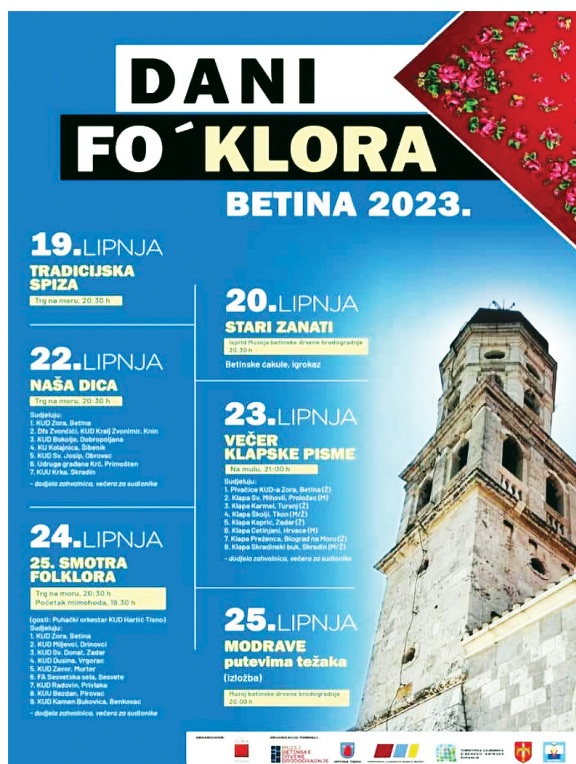
IMMAGINE 7. Il poster dell'associazione culturale KUD Zora che annuncia I giorni del folclore a Betina 3

Uno dei prestiti lessicali veneti per eccellenza è brgànja f' 'rete a strascico' che Boerio definisce come 'degagna, rete lunga e larga, che ha il ritroso, la quale gittata in mare strascinasi un pezzo e poi si cava fuori coi pesci' (BOE 96, si veda anche VMGD 28, GDDT 89, RELV 27, DEI 586). Oggi, a Betina, brgànja è una rete caduta in disuso, che prima si trascinava dalla barca, dai 3-4 fino ai 10-15 metri di profondità. Serviva per la raccolta di vongole, come le conche, mussoli, cardi, murici e anche le spugne (Škevin 2016c: 176). Il lemma è conosciuto tra i parlanti di Betina perché nel 1971 è stato coniato anche il sintagma Dan Brganje ( Il giorno della Bragagna ) che sarebbe il nome di una festa che si festeggia ogni anno la prima domenica d'agosto e che richiama la tradizione della raccolta di vongole. Il fatto che questo nome di rete è ancora conosciuto a Betina, anche tra i giovani (Škevin