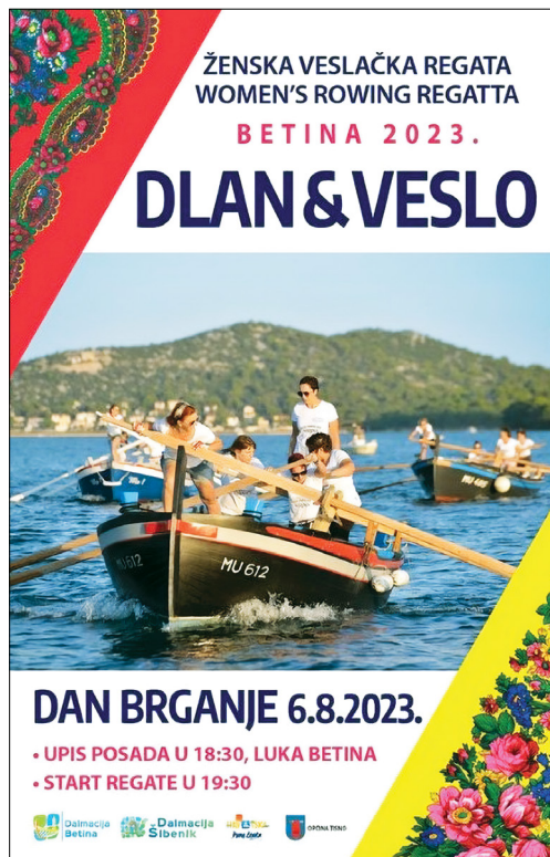
IMMAGINE 8. Il poster che annuncia la festa Dan Brganje (Il giorno della brganja) e la regata femminile a remi 4

2012), lo possiamo attribuire al fatto che la società di Betina lo ha rifunzionalizzato, cosicché da un oggetto d'uso gli ha attribuito il valore simbolico della tradizione e della memoria collettiva (Škevin 2016c: 177). È un esempio della commodificazione poiché brganja , asportata dal contesto originario, quello della 'rete a strascico' ne ha prodotto uno nuovo, uno più adatto alla società e all'economia attuali, orientate soprattutto al turismo e non più alla pesca (Marrone 2011: 30). Questo elemento romanzo continua ad essere presente nel paesaggio linguistico di Betina nei poster che annunciano Dan Brganje (Immagine 8) ma anche nella parlata di Betina: