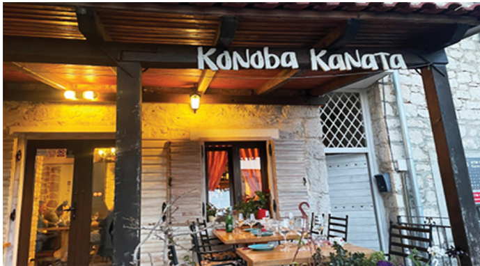
IMMAGINE 3. Il terrazzo e il cartello della Konoba Kanata 2

SKOK I 26) che deriva dall'etimo lat. CENA 'večera' a cui è stato aggiunto il suffisso -ata . Quindi, un altro nome che richiama la tradizione navale.