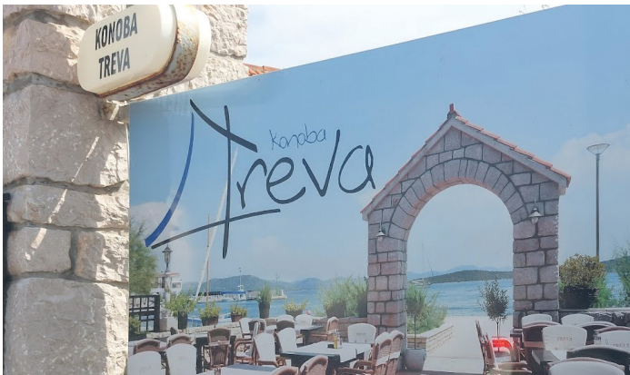
IMMAGINE 4. Il cartello che riporta il nome del ristorante Treva accompagnato dall'immagine della vela quadra

Il ristorante della più lunga tradizione a Betina è Treva . È un ristorante gestito dalla famiglia soprannominata Treva che è un termine di origine veneta che significa 'vela quadra'. Deriva dal veneto trevo 'Treguo, Vela maestra; Onde per Treguis s'intende le Vele dette la Maestra ed il Trinchetto' (BOE 767) e 'la vela più bassa di un albero a vele quadre, cioè trevo di trinchetto e di maestra' (VMGD 185).