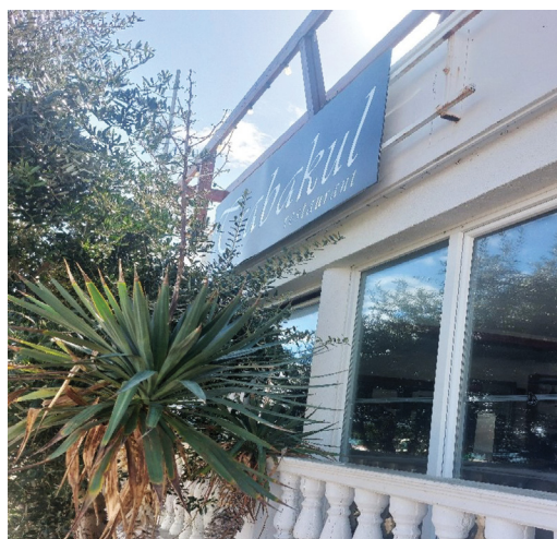
IMMAGINE 2. Il cartello del ristorante Trabakul