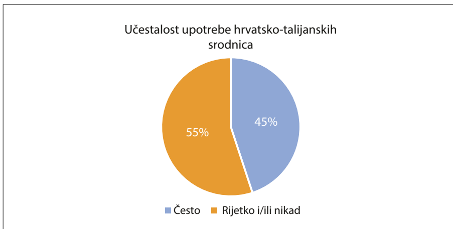
SLIKA 2. Učestalost upotrebe hrvatsko-talijanskih srodnica kod zadarskih srednjoškolaca

Istraživanjem učestalosti upotrebe hrvatsko-talijanskih srodnica (Slika 2) utvrđeno je da se zadarski srednjoškolci često služe s 45 % ponuđenih leksema, dok čak 55 % istraživanih srodnica primjenjuju rijetko i/ili nikad.