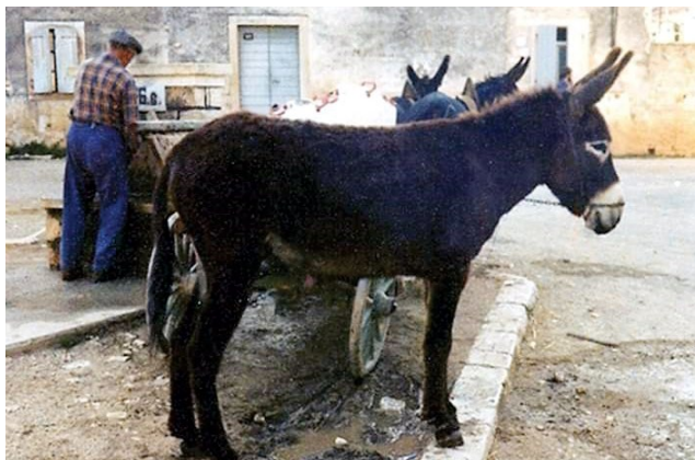
Fig. 1: Contadino che fa scorte d'acqua alla fontanella in Piazza La Musa

Ma all'interno di quell'ambiente così poveramente rurale serpeggiava, ancora, una cultura contadina plurisecolare. Una cultura che, come mostrano gli elementi originali immessi da Obrovaz, «viene elaborata dalla comunità per la comunità [...] prodotta direttamente dagli stessi “utenti”, che la creano autonomamente, non la derivano». 39 Vediamo, così, come l'ambientazione di partenza della novella è data dalla scuola, costruita, come si legge a pagina 67 del settimo Quaderno, nel 1890 o, come annota Carmelo Cottone, «anteriormente al 1875»: 40 centro, all'epoca, della vita culturale della cittadina, e correlativo oggettivo della corte. Interessante è pure la figura femminile rappresentante il potere nell'ambiente scolastico: la maestra, non il severo maestro Bancher, ricordato da Obrovaz nel decimo Quaderno. 41 È alla maestra, infatti, che il giovane re chiede il permesso di