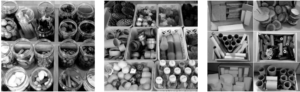
SLIKA 4. Nestrukturirani materijali višestrukih primjena

Također je važan kontekst u kojem nastaju dječje ekspresije, razumijevanje onoga što dijete radi, hoće li proces djetetova rada biti autentičan i odraz njegova intelektualnog angažmana ovisi o kvaliteti pripremljenih doživljaja, dostupnosti materijala (izražajnih medija) te odgojiteljevoj komunikaciji i odnosu s djetetom (Slunjski, 2022).