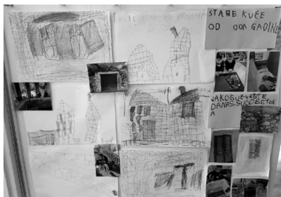
SLIKA 8. Dječje ekspresije

komunikaciju između roditelja i odgojitelja kao i podršku roditeljima u djetetovu razvoju. Dokumentacija akcije odraslih i djece čini proces vidljivim i doprinosi kvaliteti komunikacije. Zato se dokumentacija shvaća kao vrijedan alat pri izgradnji kvalitetnog kurikuluma (Rinaldi, 2006).