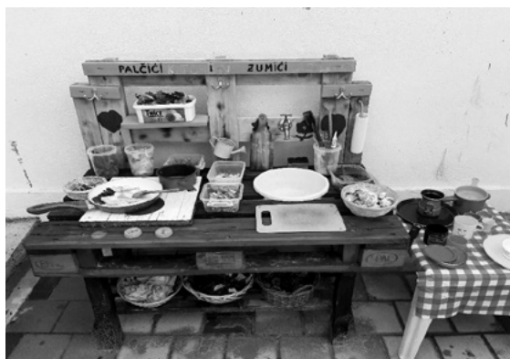
SLIKA 1. Formiranje centra u vanjskom prostoru za višenamjenske igre

Pri osmišljavanju centara treba voditi računa o tome da odgojitelji mogu vidjeti svu djecu dok se igraju što se postiže niskim namještajem ili pregradama. Centri trebaju biti smješteni tako da im se može lako pristupiti i cijeli prostor treba imati jasnu logiku kretanja. Materijali koji su ponuđeni djeci trebaju biti sigurni i razvojno primjereni. Prostor obogaćen pedagoški oblikovanim materijalima zove djecu na igru i istraživanje tako da je djeci čim uđu u prostor jasno čime se mogu baviti i što u njemu mogu činiti, te se osjećaju dobrodošli. U tako oblikovanom prostoru odvija se emancipacija djece te se poučavanje zamjenjuje iskustvenim učenjem (Tankersley i sur., 2012).