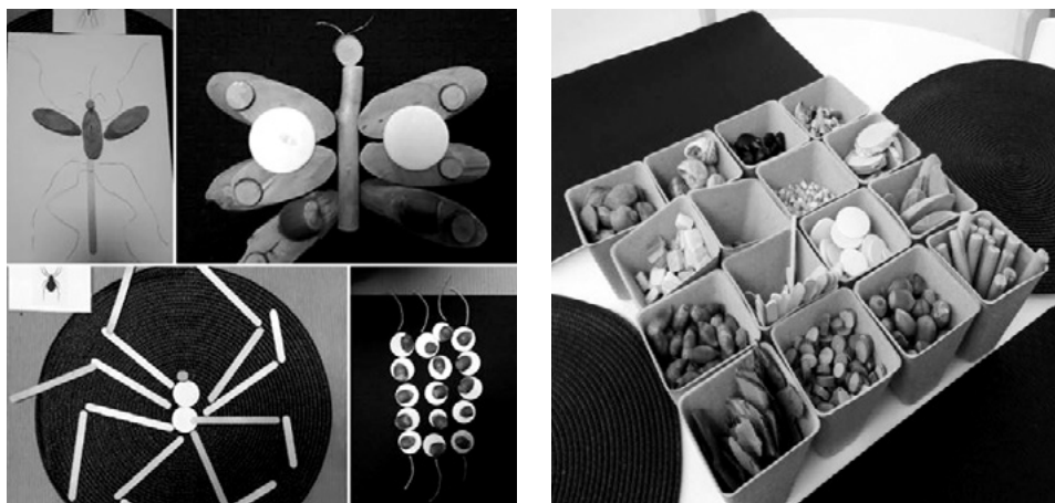
SLIKA 5. Izražavanje prirodnim, neoblikovanim materijalima prikazivanjem obilježja životinja

dijem (Belamarić, 1987). Ekspresiji može prethoditi neka istraživačka aktivnost, vizualni doživljaj, prethodno iskustvo, neki događaj ili slobodno izražavanje djeteta ponuđenim materijalima gdje dijete samo pronalazi simbole za svoje reprezentacije i ideje. Ako dijete nema iskustva korištenja određenih materijala ili likovnih tehnika, potrebno ga je s njima upoznati, no važno je naglasiti da se dijete u bilo kojem načinu njegova izražavanja ne poučava kako se nešto radi, crta ili slika, niti se utječe na njegovu ekspresiju nametanjem svojeg načina viđenja. Dajući djetetu materijal, pruža mu se sloboda izbora što će raditi, potiče na kreativno mišljenje, vizualno zapažanje, uočavanje, vizualno pamćenje te razvijaju vještine bogatog izražavanja koje za dijete imaju značenje.