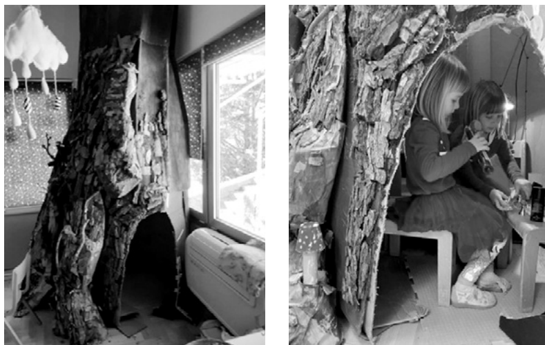
SLIKA 3. Participacija djece u kreiranju prostornog okruženja. Stablo kao višenamjenski centar čija se uloga mijenja ovisno o interesima djece

doprinijeti raznovrsnosti i bogaćenju centara. Kada su djeca uključena u planiranje, oblikovanju i održavanju centara aktivnosti, to kod njih stvara osjećaj pripadnosti, veću motivaciju u procesu učenja, postaju kompetentni i odgovorni za različita zaduženja u grupi, npr. briga o biljkama, knjižnici, pažljivo korištenje materijala, urednost, osjećaj kompetentnosti i važnosti u donošenju odluka kako upravljati vlastitim okruženjem. Dobrim razumijevanjem povratnih informacija koje djeca šalju odgojitelj odlučuje kada i kako će se mijenjati prostorno-materijalno okruženje. Bogaćenjem novim materijalima, promjenom u prostoru, raznim dopunama odgojitelj pokušava ustanoviti što ne odgovara i kako urediti okruženje da djeca budu zadovoljna, da se odvijaju samoinicirane aktivnosti duljeg trajanja i da rado dolaze u taj prostor (Tankersley i sur., 2012).