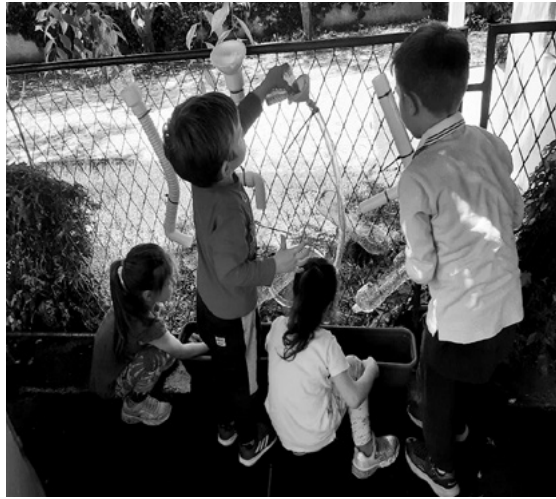
SLIKA 2. Istraživačke aktivnosti u vanjskom prostoru

Fizičko okruženje ne odnosi se samo na sobe dnevnog boravka, već na prostor cijelog vrtića – prostorija, hodnika, sanitarnog čvora, vanjskog prostora dvorišta i dr. Takav način uređenja prostora omogućuje više prostora za nastajanje novih centara, radionica ili ateljea koji su zajednički za sve grupe. U koncepciji organizacije ovakvog prostora moguća je bogata opremljenost sredstvima i materijalima jer nisu svi centri smješteni u jednu sobu, već u prostoru cijelog vrtića.