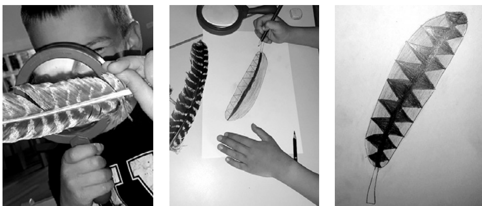
SLIKA 6. Olovka kao medij za izražavanje obilježja pera kojem prethodi istraživačka aktivnost te djetetov doživljaj istog