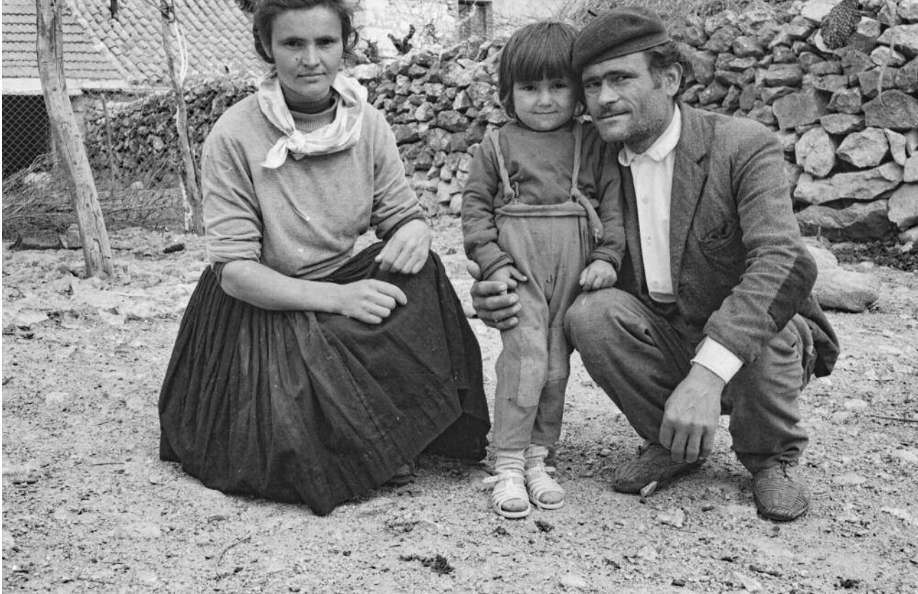
sl. 2 Djevojčica s roditeljima (gradski odjeveni), Bilišane.