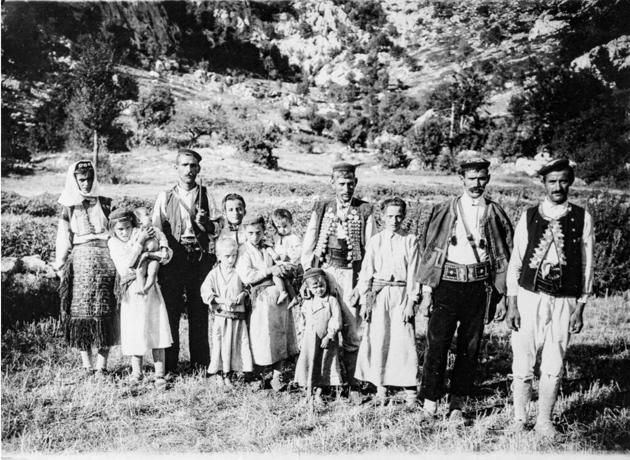
sl. 1 Seljaci i seljanke na Velebitu .