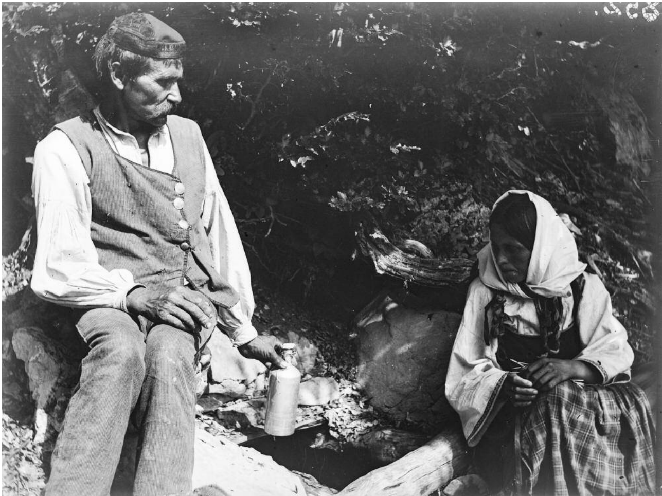
sl. 3 Seljak i seljanka . Velebit.

„U selu Đevrske ima kuća 122 koje sačinjavaju svaka za se, svoju zadrugu, amo rečeno; vamiliju ili kortu...Sve Vamilije dijele se na dime. Što ima i po više vatara u jednoj vamiliji, tad je onda više i dima, to se ne broji nego za jedan dim, kad nije vamilija razdijeljena. Kuće se dijele na plemena, a svako pleme, pa bile i dvije kuće, zovu varošom, a to još, ako su osamljene“ (2010: 35).