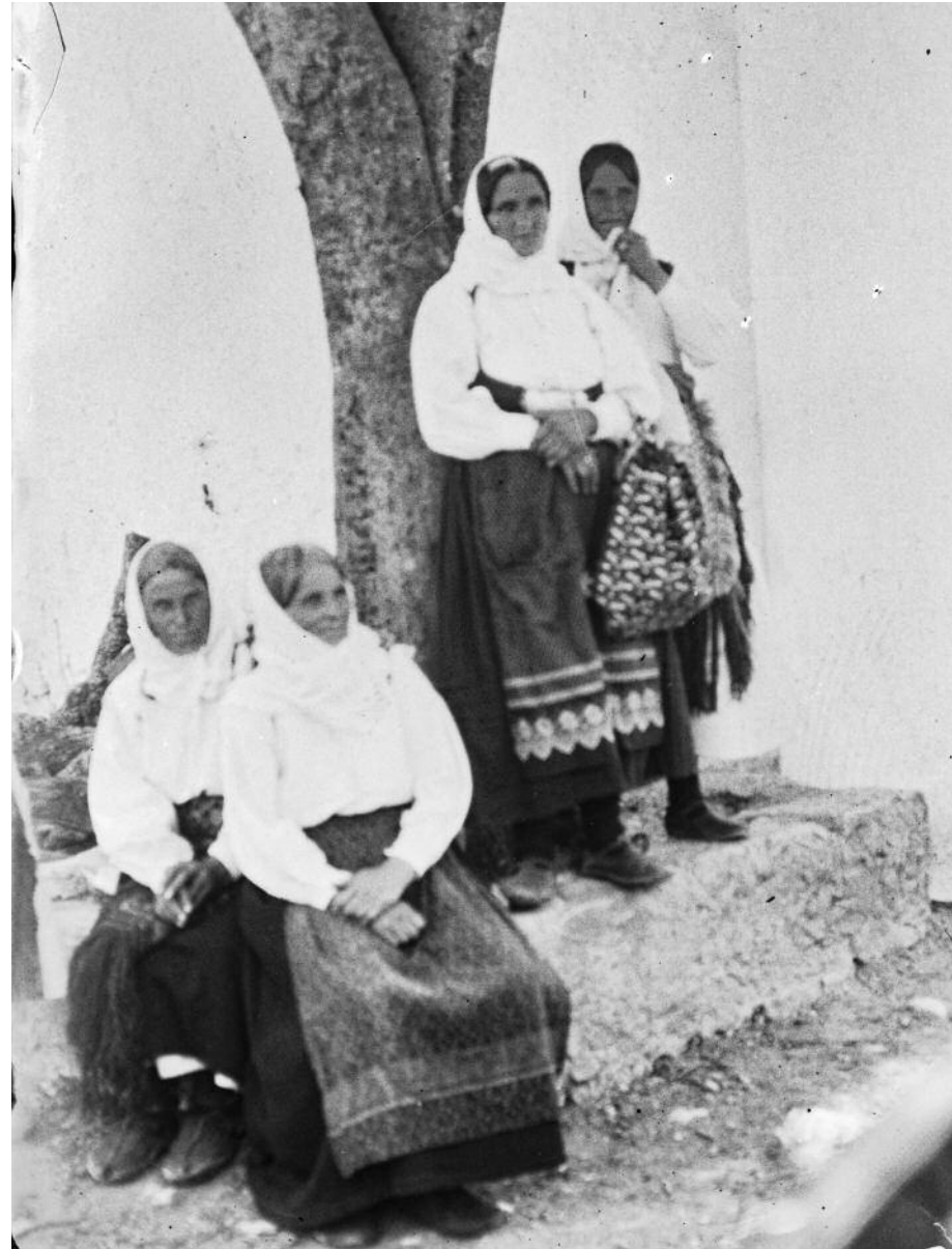
sl. 7. Seljanke. Žegar. 6. svibnja 1933.

Bratu koji se ne slaže i želi se dijeliti ne dopuštaju mu to te on odlazi iz obitelji, u grad, služiti, u najam, no i kad se dijele, nakon očeve smrti on neće dobiti isti udio jer nije živio ni privređivao žitak u međuvremenu, „gdje ima braće, tu ima i dijela, ali je sramota, kad se i svi dijele, a kamo li jedan sam kad hoće da bježi od ćaće, ako je živ, i od braće; valja da kaže, zašto hoće on tako izvan sviju“. (224).