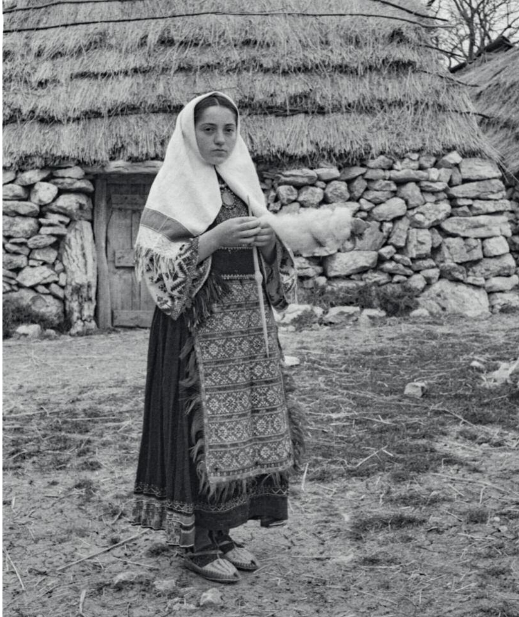
sl. 8. Žena u svačanoj nošnji s preslicom u ruci. Kruševo. Fotograf Jelka Radauš Ribarić, ožujak 1974.