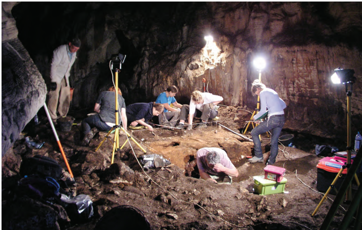
SL. 1. Kličevica – Velika pećina

S obzirom na arheološke nalaze, pregled materijalne kulturne baštine u Zadarskoj županiji moguće je započeti od starijega kamenog doba, odnosno paleolitika . To kulturno-povijesno razdoblje različito je datirano (po nekima od 4 milijuna godina do 10 000 godina pr. Kr., a po drugima, što je prihvatljivije, od 2 milijuna do 10 000 godina pr. Kr.; Batović, 2009., 6-10). U to vrijeme čovjek je bio najviše povezan s prirodom. Tijekom paleolitika zbivale su se pravilne klimatske smjene toplih i hladnih razdoblja. U vrijeme najvećega zahlađenja otprilike prije 26 000 godina, razina mora bila je oko 100 m niža od današnje. Tada je, naime, cijeli sjeverni prostor sadašnjega Jadranskoga mora bio kopno, a južna granica trajnoga ledenog pokrivača išla je od Istre, preko Like i srednje Bosne na istok. To je bila i granica polarnih i životinjskih zajednica. Ljudi su živjeli od lova na divlje životinje, a u manjem opsegu skupljali su hranu u pri-