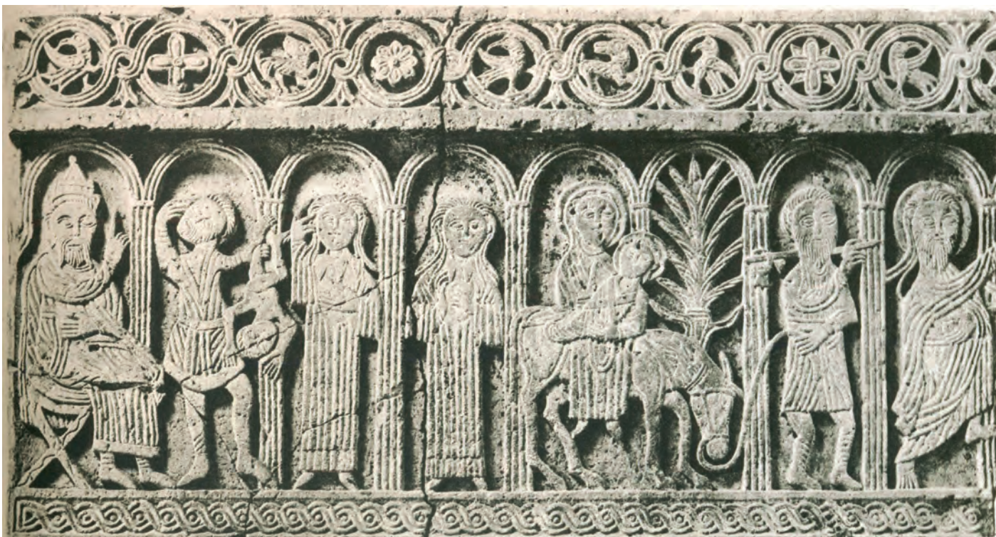
SL. 15. Zadar Sv. Nediljica, 11. st.