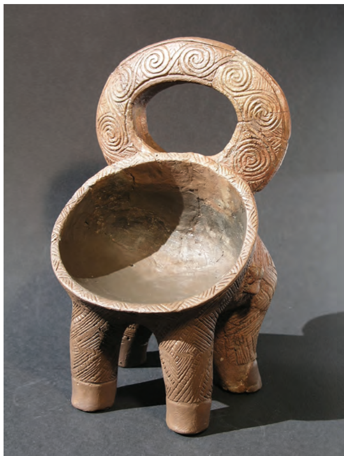
SL. 2. Smilčić – Riton koji pripada danilskoj kulturi

Rana faza mlađega kamenog doba naziva se smilčićkom kulturom (ili impresso kulturom). Ime je, znači, dobila po važnom nalazištu Smilčiću (Batović, 1966.) u Ravnim kotarima, dvadesetak kilometara od Zadra. Otkrio ju je i definirao prof. dr. sc. Š. Batović. Ta je kultura raširena po cijelom istočnom Jadranu, ali i u Hercegovini. Vezna je uz more i ribarstvo. Posude iz toga doba ukrašavane su otiskom školjke, morskih puževa, sitnim ubodima, oštrim predmetima, prstima (to je tehnika utiskivanja, odnosno