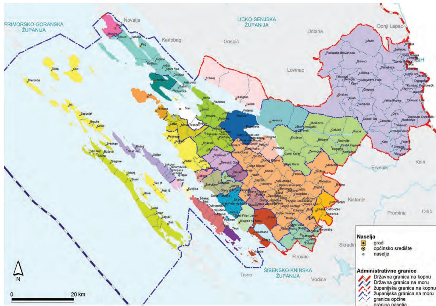
SLIKA 3. Teritorijalno ustrojstvo Zadarske županije