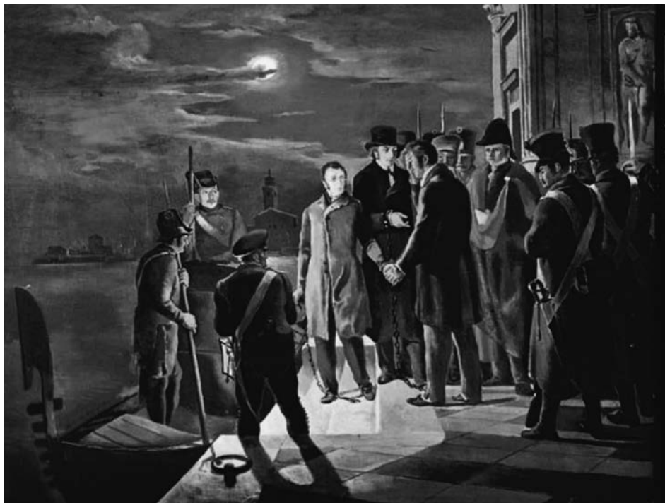
Il trasferimento di Silvio Pellico e Piero Maroncelli dai Piombi di Venezia allo Spielberg

Lo stesso vale per il Tommaseo e Daniele Manin, che il 18 gennaio del 1848 furono arrestati e rimasero in carcere nonostante l'autorità giudiziaria li avesse assolti dall'accusa di cospirazione. Tra i numerosi capi d'imputazione c'era il loro particolare attivismo durante il nono e l'ultimo congresso degli scienziati, tenutosi a Venezia, oltre alle petizioni per la causa nazionale, la difesa da parte di Manin della giustizia veneziana e le posizioni del Tommaseo contro la censura. In seguito alla rivolta Manin e Tommaseo vennero liberati e si posero alla guida del nuovo Governo Provvisorio (proclamato il 22 marzo dello stesso anno) che richiamava il nome dell'antica Serenissima. Ne scrive il Doda: «Lo scrittore Tommaseo domandava all'Austria contemporaneamente, in una pubblica seduta d'Accademia, venisse l'ufficio della censura ricondotto alle promesse ed alle leggi del 1815. Poco dappoi egli e il Ma-