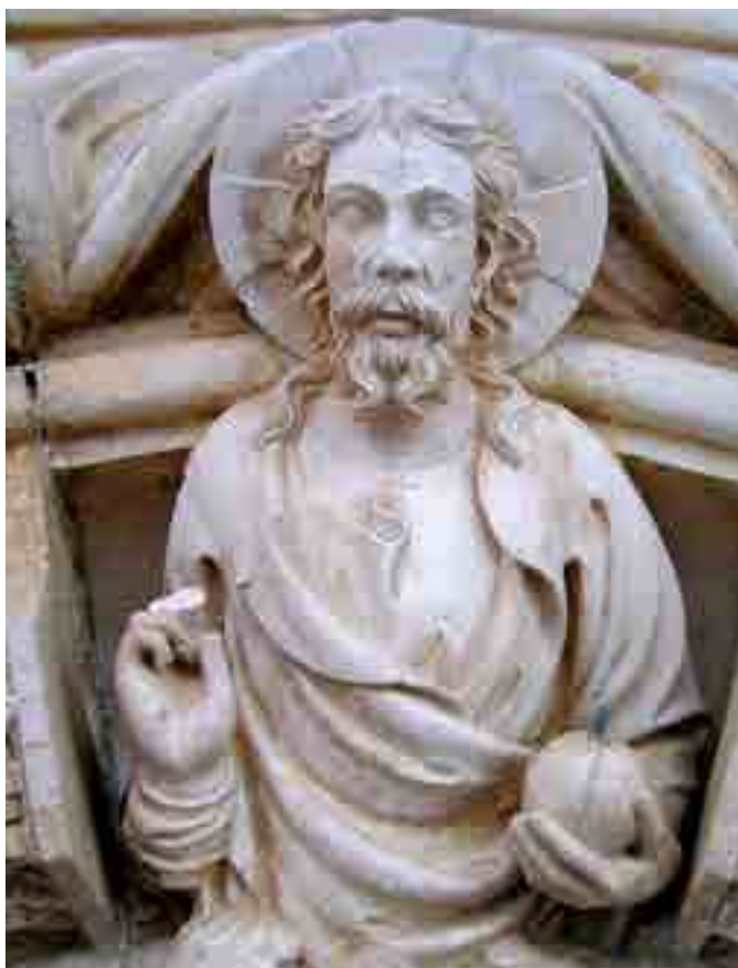
Fig. 8. Statua di Cristo, il portale principale della cattedrale di Sebenico