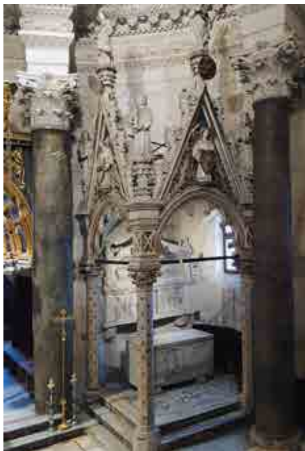
Fig. 6. Cappella di San Doimo dopo il restauro, cattedrale di Spalato

zandoci di nuovo sul portale, nelle sue armonie non è difficile costatare una serie di elementi in linea con il linguaggio settentrionale del tardo medio evo che in Dalmazia non si riscontra prima degli albori del Quattrocento. 24