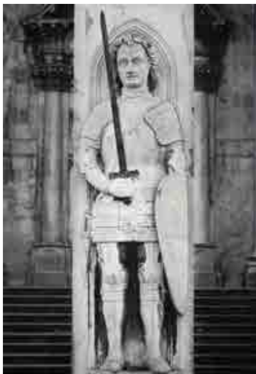
Fig. 3. Colonna d'Orlando, Dubrovnik

nuto specifico, è percepibile la sua sensibilità per i principi architettonici. 9 La stessa capacità si intuisce nelle sue attività documentate in qualità di protomagistro della chiesa collegiata di San Biagio, 10 oggi completamente ricostruita, come pure in alcune lastre tombali che realizzò nelle altre chiese. Quando gli fu commissionato dal Governo della Repubblica un grande cimerius su un palazzo importante, nel documento fu chiaramente precisato che si sarebbe dovuto scolpire secondo un disegno fatto di sua mano. 11 Tutto questo permette di percepire il largo spettro creativo di Bonino nel ventaglio delle sue opere di gusto lombardesco, il quale entrò nella scena dalmata proprio grazie a lui.