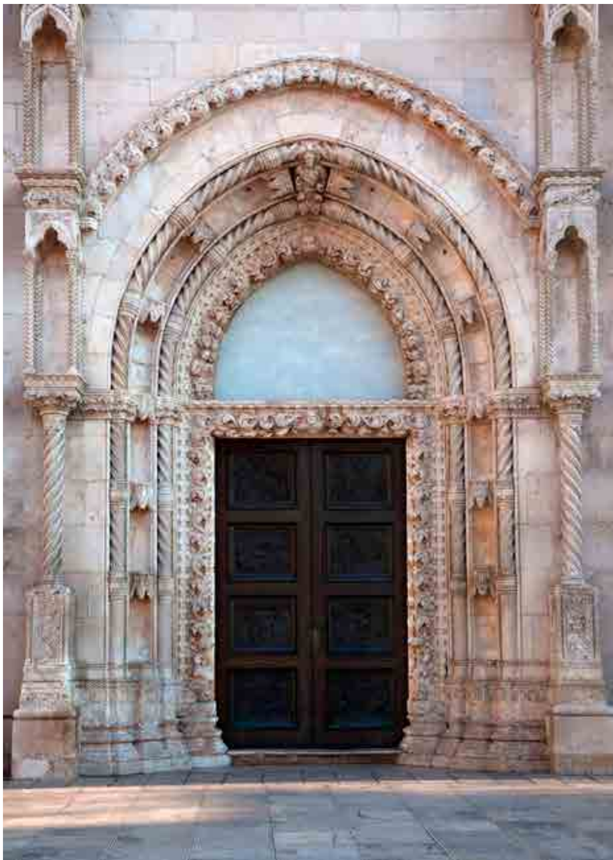
Fig. 7. Portale della cattedrale di Sebenico, le figure degli apostoli temporaneamente spostate