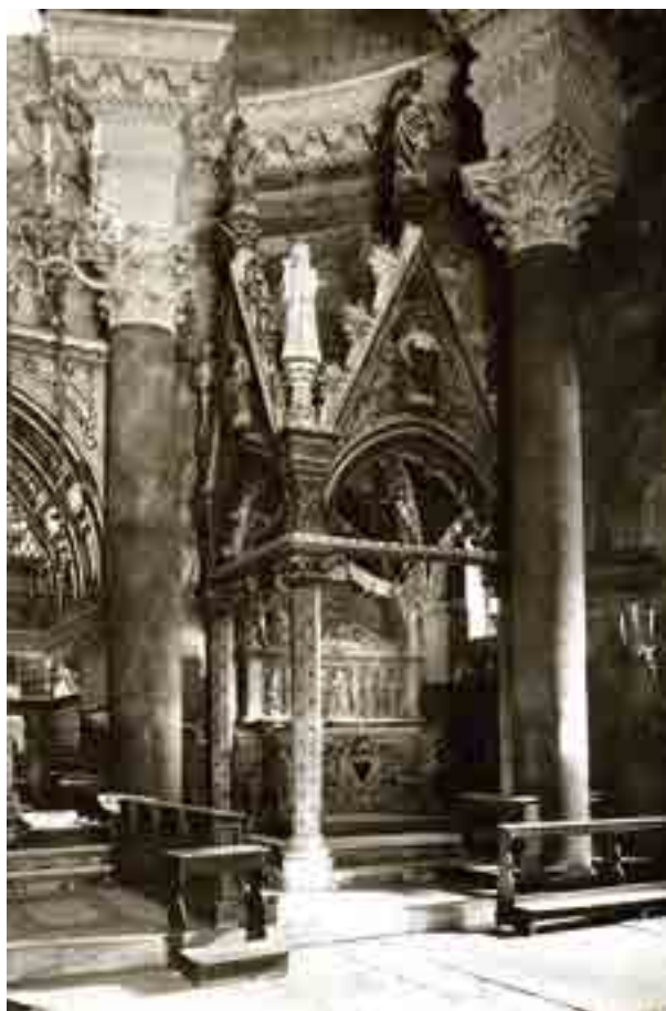
Fig. 5. Cappella di San Doimo, cattedrale di Spalato