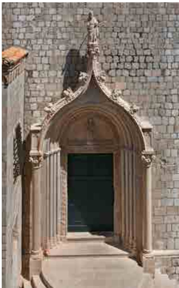
Fig. 2. Portale della chiesa di San Domenico, Dubrovnik

In ogni caso, è sicuro che Bonino apparve per la prima volta sulla scena storica a Curzola con i lavori per il portale della cattedrale di San Marco, 6 e che perì nell'epidemia di peste mentre scolpiva il portale della cattedrale di San Giacomo a Sebenico. 7 La sua parte nelle composizioni citate è chiaramente leggibile attraverso uno stile molto personale, inoltre riconoscibile sulla cornice del portale della chiesa di San Domenico a Dubrovnik, anche se morfologicamente i due portali sono molto diversi. 8 Inoltre, sulla celebre colonna di Orlando (lo stendardo portabandiera della città stato dell'adriatico meridionale), sebbene la sua espressione formale fosse condizionata dal conte-