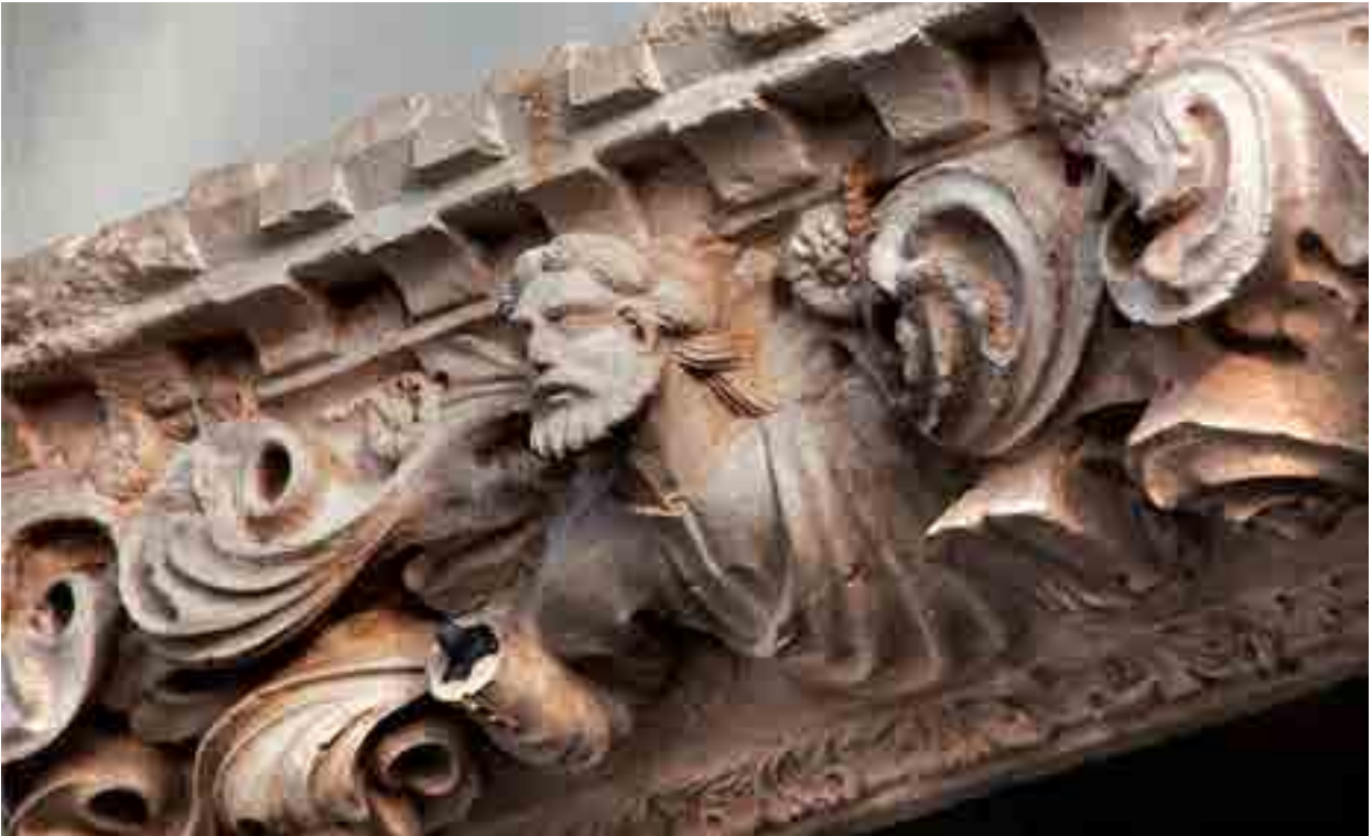
Fig. 9. Statua di San Giacomo, il portale principale della cattedrale di Sebenico

Tuttavia, la vera ispirazione per questo articolo è stata la constatazione della coincidenza della disposizione architettonica delle due chiese pensate nel momento in cui il milanese Bonino convalidava il proprio ruolo di proto con la creazione dei portali: prima quello curzolano e poi quello di Sebenico. A parte il variare sempre la stessa simbologia teologico-religiosa, le piante della zona anteriore di questi due edifici coincidono in larghezza e nella disposizione delle colonne tra le navate, come dimostra il rilievo che riporto. 31 Queste coincidenze secondo la mia opinione non sono per niente casuali, ma sono legate al fatto che l'idea di qualsiasi portale non possa essere creata senza una visione del progetto più o meno completo della chiesa su cui si sarebbe trovato. 32 Di regola, le pareti e il portale venivano costruiti assieme, in quanto gli strati orizzontali dei blocchi di pietra dovevano essere incastrati con gli elementi verticali del portale scolpito, creando un'unica parete stabile che richiedeva una certa esperienza. In parole povere, l'autore di questi due portali logicamente doveva essere il progettista della chiesa: colui che probabilmente già nel 1408 stipulò la costruzione della cattedrale di San Marco con il vescovo di Curzola e Stagno, e che a Sebenico nel 1429 – già morto – fu nominato "il primo magistro" – in realtà il protomagistro della cattedrale dedicata a San Giacomo.