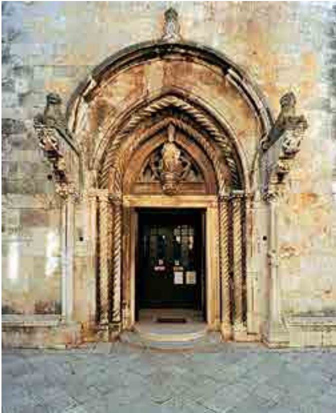
Fig. 1. Portale della cattedrale di San Marco, Curzola

ninica, ma senza gli intrecci con le correnti parallele del gotico veneziano, certamente più vitali nello spazio adriatico. Considerando queste posizioni accettabili in linea di principio – almeno fino al ritrovamento di prove contrarie – considero importante concentrarsi sui portali ecclesiastici attribuiti al produttivo Milanese. 2 Discutendoli, intendo esporre alcune osservazioni che indicano che l'autore non solo fu uno scultore prestigioso, come veniva definito finora, ma anche un costruttore ugualmente abile: una constatazione completamente trascurata dalla critica.