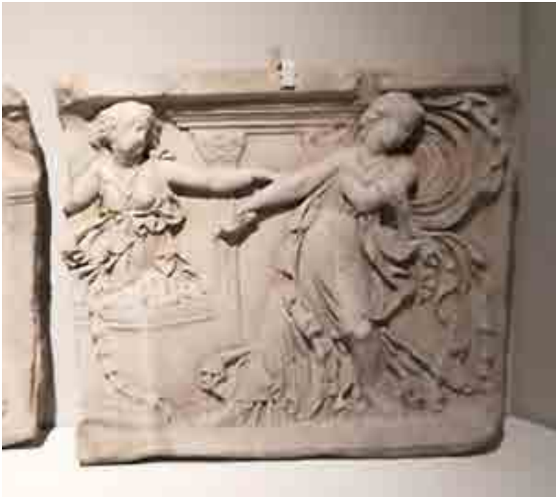
Fig. 12. Altea istigata da Furia, Museo Archeologico, Firenze