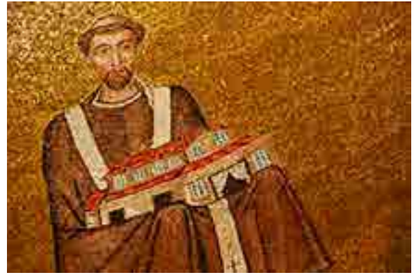
Fig. 15. Papa offre il modelletto della chiesa, mosaico absidale, Sant'Agnese, Roma

a cui si affiancano, del tutto inopinatamente per le nostre regole prospettiche, facciata e abside. Si tratta di uno schema iconografico raro ma attestato in aree distanti e in un arco cronologico che abbraccia tutto il medioevo. A Roma lo si era già incontrato nel modellino retto forse da Giovanni IV, ritratto in pendant con papa Onorio I (625-638) che tiene un libro in mano, posti ciascuno a lato di Sant'Agnese, a cui la chiesa è dedicata (Fig. 15).