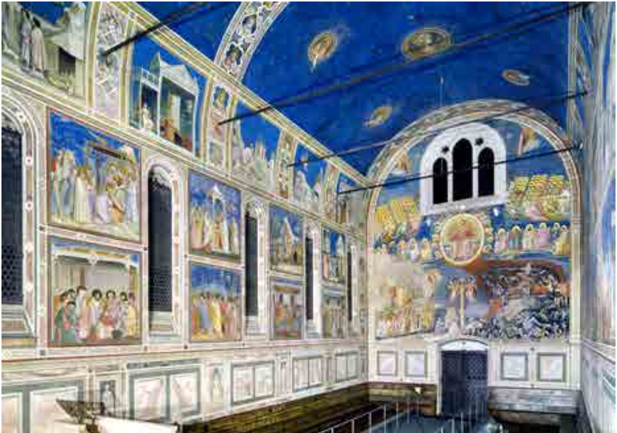
Fig. 10. Giotto, cappella Scrovegni, Padova

Vi sono richiami espliciti di gesto e significato tra storie bibliche e Virtù, già da tempo individuati, ad esempio Ira e Caifa, Desperatio e Giuda Impiccato.