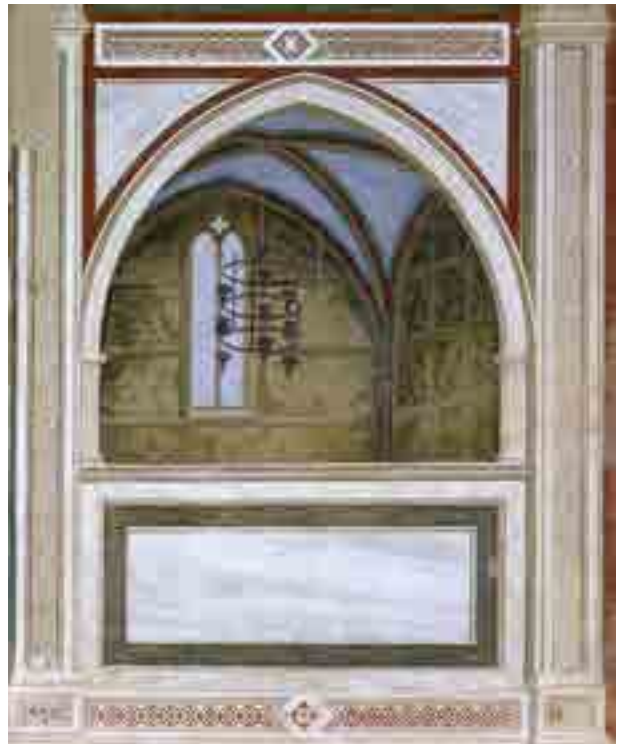
Fig. 3. Giotto, coretto, cappella Scrovegni, Padova

A Padova Giotto sperimenta più compiutamente, seppure in modo empirico, una progettazione spaziale, che non è, né poteva essere, ancora quella teorizzata da Leon Battista Alberti, dell'unico punto di fuga, ma una visione prospettica, nel senso etimologico di perspectiva , così come è usato nel medioevo, di scienza della visione. La perspectiva era del resto una materia trattata dai maestri attivi nel libero studio della città di Padova. Proprio a Padova si manifesta compiutamente il "Giotto Spazioso", 4 secondo la felice definizione inaugurata nel 1952 da Roberto Longhi, incentrata sui due coretti, come li aveva chiamati Fiocco nel 1939, 5 e due inganni ottici, chiamati "ripostigli" da Cavalcaselle, che per primo vi cercò significati allegorici (Figg. 2-3). La critica novecentesca ha cercato di trovare le ragioni di questa grande invenzione giottesca, a partire da Andrea Moschetti, direttore del Museo Civico di Padova: "di questa allegoria, l'unica introdotta da Giotto in forma così astratta...ci sfugge il significato". 6 Per Weigelt, nel 1925, i due spazi diventano due piccole cantorie, importante elemento di cesura delle scene narrative. 7