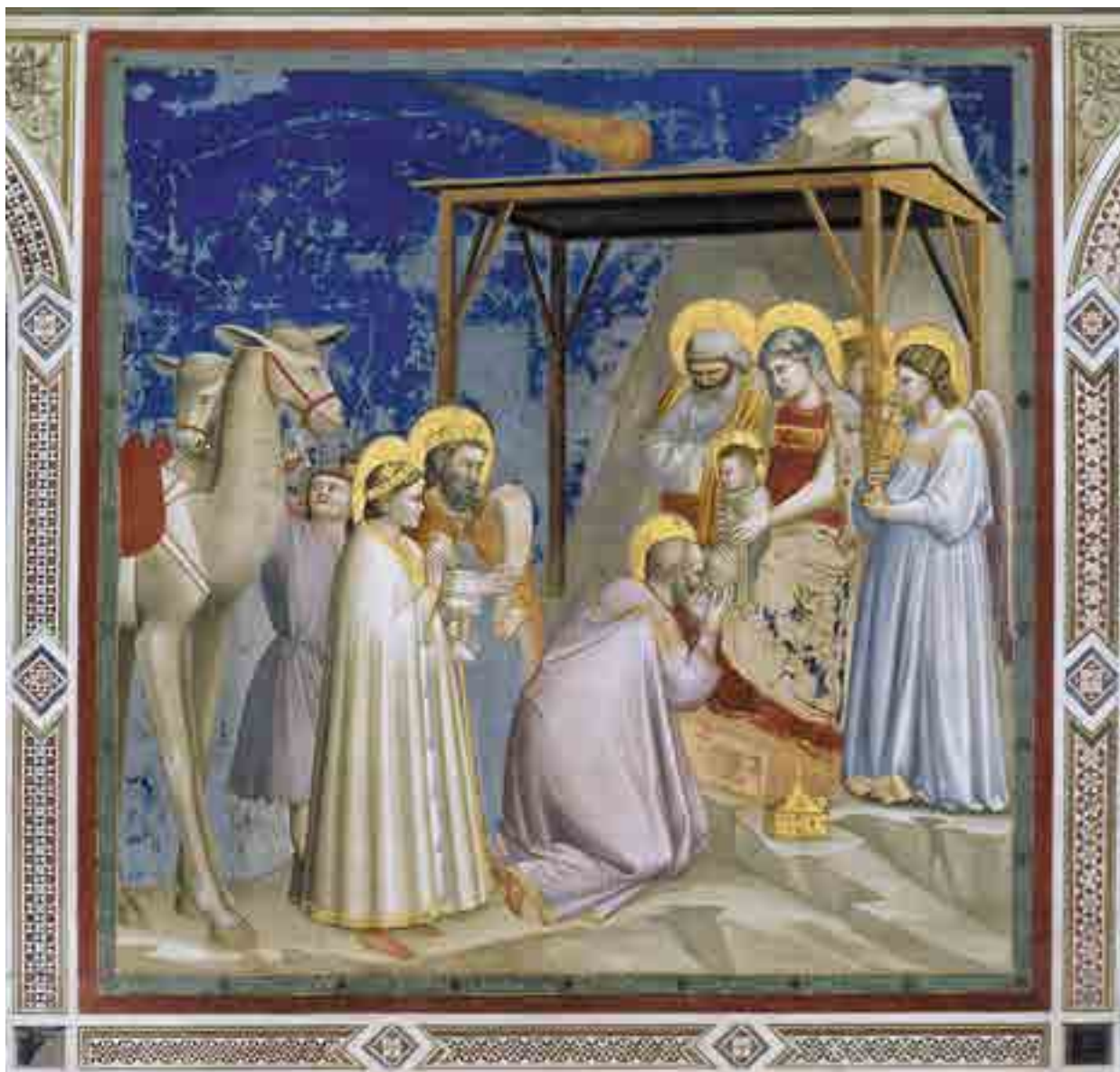
Fig. 4. Giotto, Adorazione dei Magi, cappella Scrovegni, Padova

Io credo che qui vi sia, come ho già avuto modo di argomentare, “una delle realizzazioni più significative e impressionanti della storia di tutti i tempi, frutto dello straordinario rapporto tra arte e scienza... Giotto raffigura per la prima volta nella storia della pittura occidentale due spazi vuoti proprio negli stessi anni in cui uno dei più famosi maestri dello studium patavino [Pietro d’Abano] ne aveva teorizzato l’esistenza, in opposizione alla concezione tomistica aristotelica. Pietro dà piena evidenza alla scienza fisica come scienza della natura, non più intesa in senso aristotelico, ossia come risposta all’interrogazione metafisica sulla natura, ma come scienza ( modus sciendi ) che attraverso un nuovo concetto positivo di metodo sperimentale ( modus operandi ) può giungere ad una nuova concezione dell’essenza del vuoto ( modus essendi ). I rapporti tra gli studi di ottica e le sperimentazioni spaziali di Giotto, riletti in questa prospettiva, assumano un significato ancora più pregnante, che giustifica ancor più la fama raggiunta dall’artista presso i contemporanei e gli umanisti”. 9