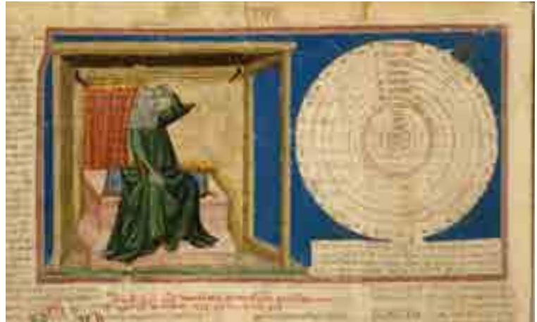
Fig. 8. Francesco da Barberino, Discorsi d'Amore , Prudentia (© Biblioteca Apostolica Vaticana, Barb. Lat. 4076 f. 69v)

municazione la cappella con il palazzo della famiglia Scrovegni, in opposizione all' Insipiens , come la personificazione della Circumspectio "Et videbis quod ista domina in singulis que videri vel sentiri possunt circumspicit unde vere potest qui ad singula oculum recte dirigit circumspectu vocari" (Figg. 7-9). 21