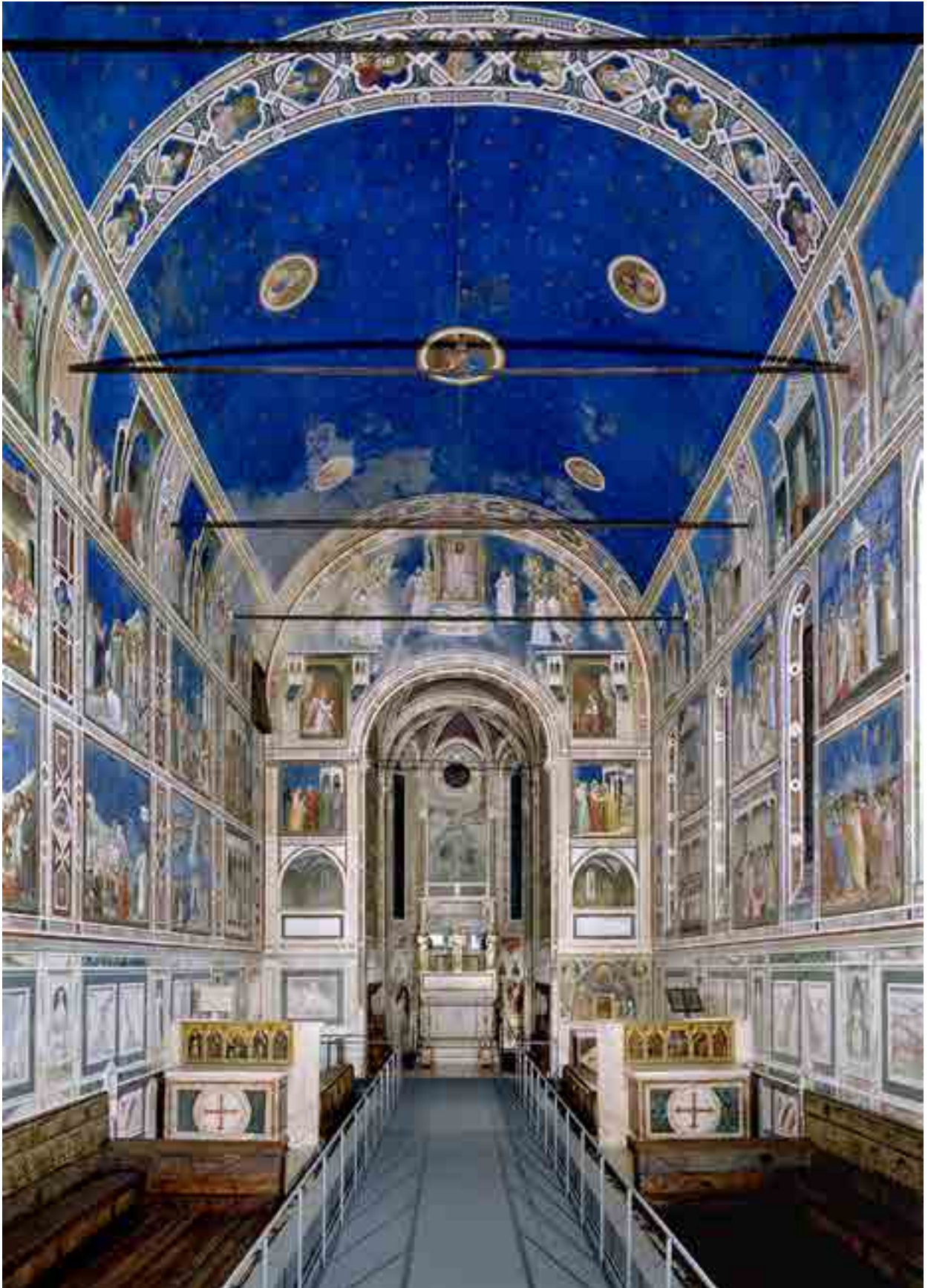
Fig. 1. Giotto, cappella Scrovegni, Padova