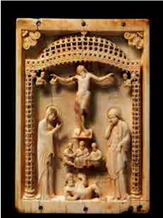
Fig. 18. Crocifissione, Avorio, Metropolitan Museum, New York