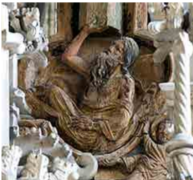
Fig. 21. Adamo (particolare), Lettner, Duomo, Halberstadt