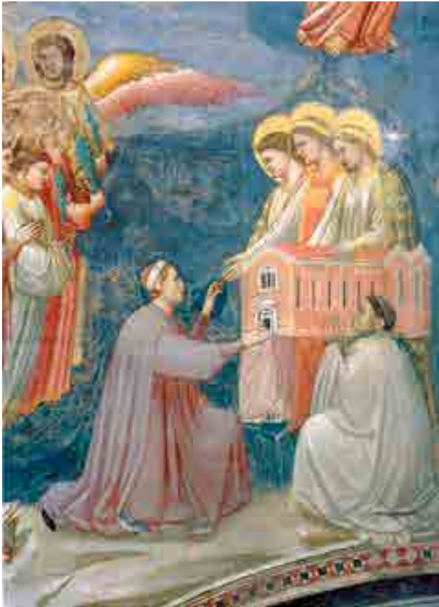
Fig. 14. Giotto, Enrico Scrovegni offre il modelletto della chiesa, cappella Scrovegni, Padova