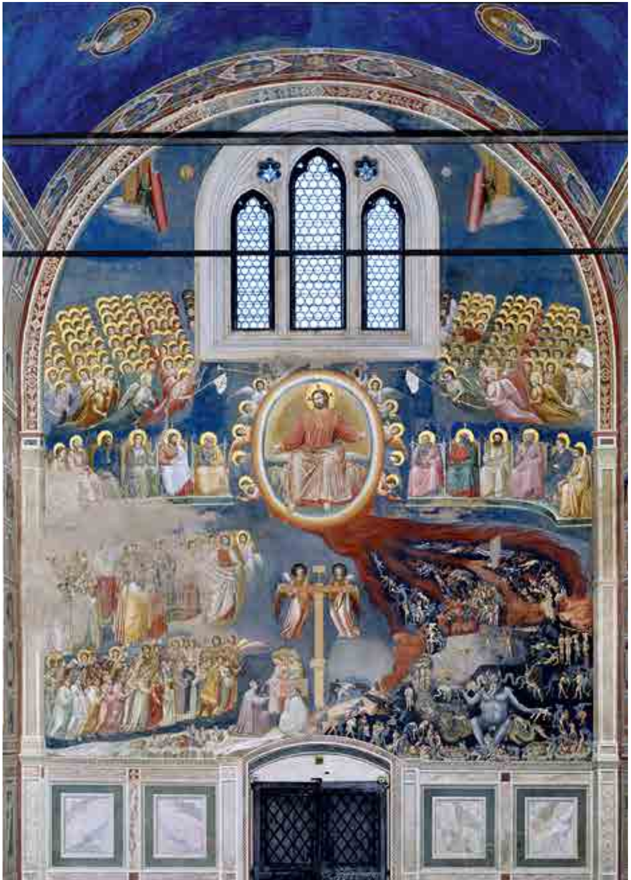
Fig. 22. Giotto, Giudizio Universale, cappella Scrovegni, Padova