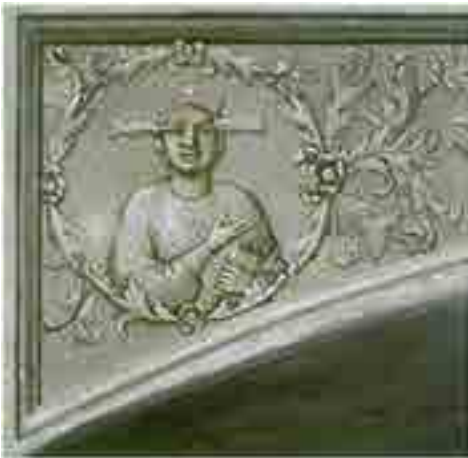
Fig. 7. Giotto, Circumspectio , cappella Scrovegni, Padova