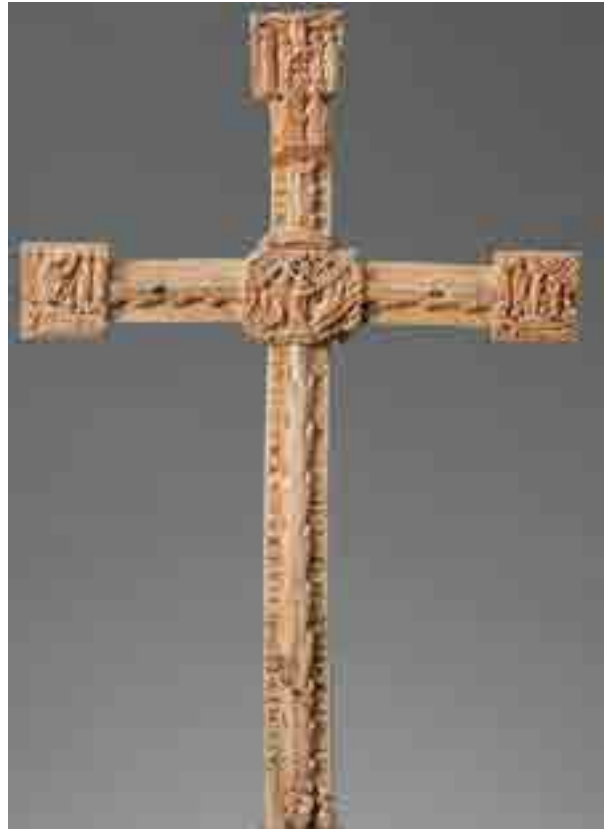
Fig. 19. Crocifisso (particolare), Avorio, Metropolitan Museum, New York