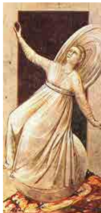
Fig. 11. Giotto, Inconstantia , cappella Scrovegni, Padova

già all’XI secolo e in Veneto si conservano antichi esempi, nella Cripta di Aquileia, nelle pitture di Summaga. 31 Ma nella mente di Giotto ebbero un peso visivo, che gli permisero di rinnovare radicalmente la tradizione, la possibilità di vedere i marmi antichi e tardo antichi di Roma nel foro Romano e la suggestione della trabeazione del tempio di Minerva nel Foro di Nerva 32 . La caccia alle citazioni dall’antico nell’opera di Giotto ha individuato nel fregio della basilica Emilia, raffigurante Trapea, oggi esposto nell’Antiquarium Forense, la suggestione per il manto gonfiato dal vento accentuato dal movimento nella figura dell’ Inconstantia (Fig. 11) Il motivo del mantello gonfiato dal vento è abbastanza diffuso, e si ritrova anche in un frammento di sarcofago oggi esposto al Museo Archeologico di Firenze che raffigura il Mito di Altea, come in rilievi conservati presso i Musei Civici di Padova (Fig. 12). 33