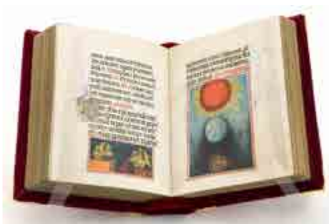
Fig. 5. Francesco da Barberino, Officiolo , Eclissi

L'illustrazione dell' Eclissi (Fig. 5), miniata nell' Officiolo , la straordinaria opera manoscritta di Francesco da Barberino, scritta a Padova tra 1305 e 1308, opera fino a poco tempo fa ritenuta perduta, rivela il parallelo interesse da parte di un letterato e poeta sulle ricerche astronomiche in corso presso lo studium di Padova. 12 Di fatto, in modo implicito, conferma l'attenzione dedicata da Giotto alla presentazione della stella cometa, di Halley, così come l'aveva descritta Pietro d'Abano, che l'aveva potuta osservare nel suo passaggio vicino alla terra del 1301. L'inserimento della stella cometa nella scena dell' Adorazione dei Magi compare assai anticamente nell'elaborazione di tale iconografia. La stella