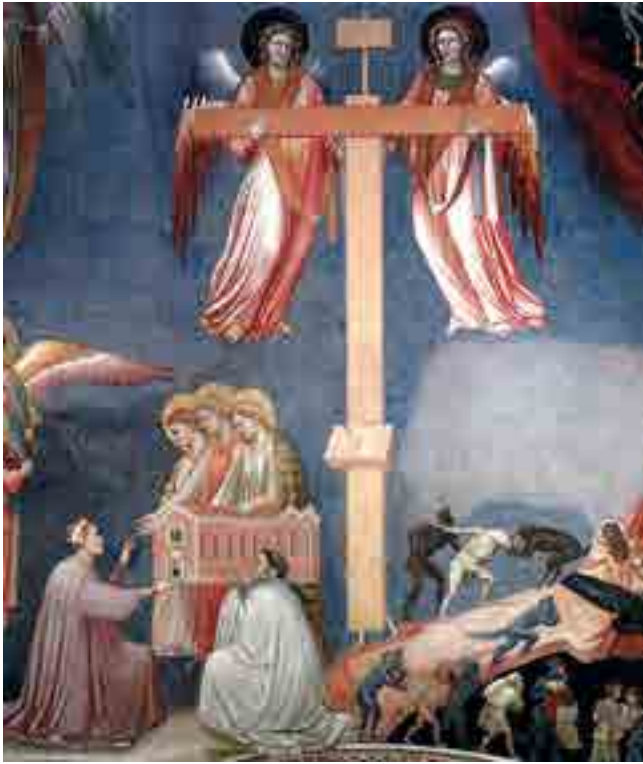
Fig. 16. Giotto, Giudizio Universale, particolare dell'anima che porta la Croce, cappella Scrovegni, Padova