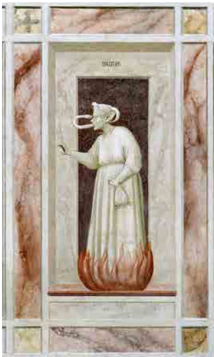
Fig. 6. Giotto, Invidia, cappella Scrovegni, Padova

La presenza della lamina d'oro non esclude l'intenzionalità di raffigurazione scientifica, come attesta la raffigurazione dell'eclissi nella miniatura che illustra l'Offiziolo. Del resto una scienziata come Margherita Hack, in Notte di stelle , riprende il passo del medico filosofo padovano e chiosa il passo di Pietro d'Abano "... esalazioni secche e calde che si infiammano...dopo un grande fuoco (il nucleo N.d.A) la materia perde il colore rosso e si tinge di nero. Per questo Giotto la dipinse con un nucleo rosso fuoco molto evidente e una coda curva e striata dove il rosso sfuma in nero" 14 .