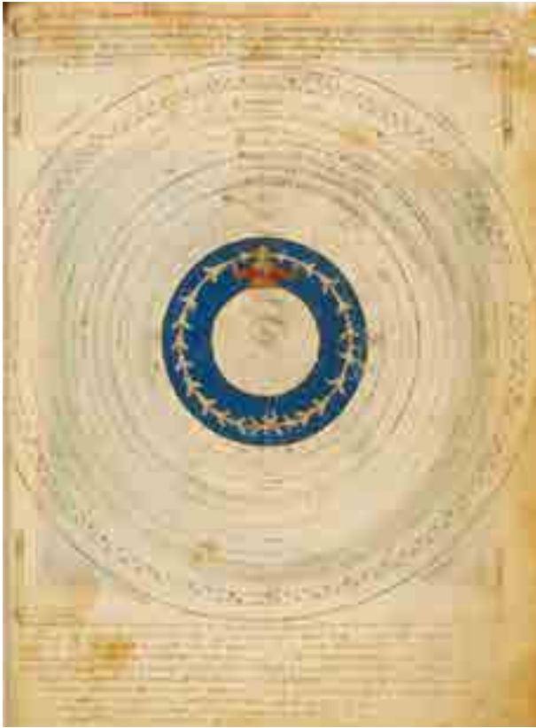
Fig. 9. Francesco da Barberino, Discorsi d'Amore, Circumspectio (© Biblioteca Apostolica Vaticana, Barb. Lat. 4076 f. 101r)

Questo passo di Pietro d'Abano è inoltre particolarmente significativo, perché aiuta a comprendere che al di là dei topoi retorici, sempre presenti nei testi degli umanisti, da Dante a Boccaccio, da Petrarca a Francesco Villani, quando si celebra la perizia del pittore fiorentino in grado di duplicare la natura, al punto da richiamare il famoso confronto tra Apelle e Zeusi di pliniana memoria, vi è effettivamente una convinzione delle grandi capacità ritrattistiche di Giotto e della sua abilità nel saper raffigurare le passioni e i mutamenti dell'animo.