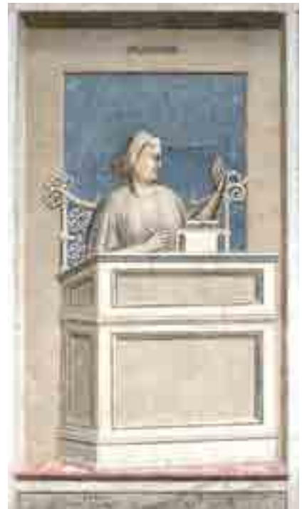
Fig. 13. Giotto, Prudentia, cappella Scrovegni, Padova (© Rita Deiana Universit  di Padova DBC)

Le personificazioni sono accompagnate dal titolo e da iscrizioni latine in versi. Purtroppo il testo lacunoso delle iscrizioni, per le molte cadute di colore, hanno reso difficile, nel tempo, la loro lettura, privandoci di uno dei testi fondamentali per comprendere non solo ogni aspetto di queste raffigurazioni, ma per analizzare in un contesto pi  ampio, l'indissolubile rapporto tra testo e immagine proprio della cultura figurativa medievale, affatto esclusivo della miniatura. Specificatamente sulle iscrizioni aveva richiamato l'attenzione Giovanna Gianola. 35 Di recente Giulia Ammannati ha presentato uno studio assai importante. Avvalendosi di una campagna di riflettografie, ha potuto integrare di molto il testo scritto e raggiungere una pi  completa lettura dei titoli e quindi delle stesse immagini figurate. 36 " Pinxit industria docte mentis ",   il titolo del volumetto, edito nel 2017 dalle edizioni della Normale. Il titolo   tratto proprio dall'iscrizione che accompagna l' Invidia e l'autore del testo si riferisce espressamente a Giotto: «[P]atet hic Invidi[a]/sua feres propria/ quam pinxit industria/ docte mentis (Ecco qua l' Invidia , con i suoi attributi, dipinta dall' industria di una docta mente», 37 o meglio dipinta dall' arte di una mente colta, di un uomo che ha studiato e conosce la scienza nel suo complesso. 38