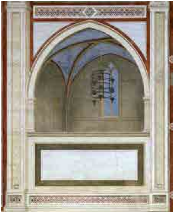
Fig. 2. Giotto, coretto, cappella Scrovegni, Padova