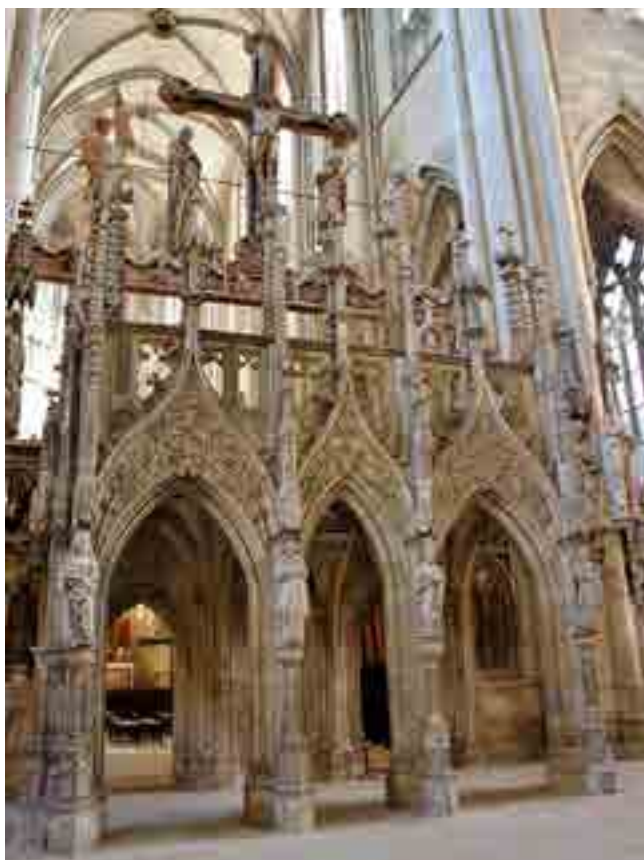
Fig. 20. Lettner, Duomo, Halberstadt

Nel Lucidator scriverà che la scientia è comprehensio veritatis ex demonstratione acquisita, è