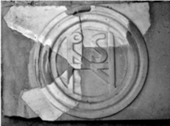
Fig. 2. Fragment complété au ciment d'une des plaques au monogramme d'Honorius II de Salone, Musée archéologique de Split

Deux morceaux de deux plaques de chancel en marbre proconnésien datées de la première moitié du VI e siècle, découverts à Hagios Démétrios de Thessalonique, arborent au centre du champ de leur avers le reste du monogramme-bloc en méplat, inscrit dans une couronne en double tore et listel, d'un même dédicant laïc. Le revers de ces plaques était orné d'une grande croix pattée. Le premier signum est trop abîmé pour être déchiffré 24 ; sur la foi du second, Denis Feissel a proposé de lire au génitif, Γρηγορίου μαγίστρου ζ (de maître ζ Georges) 25 , lecture qu'Eugenio Russo a fini par accepter en 2006 26 . Johannes Diethart a suggéré de développer Πραγματίου Γρηγορίου 27 . Mais la proposition la plus originale est celle de Giorgios Velenis 28 , qui objecte que le sigma manque pour lire magister et propose de reprendre l'édition primitive – Πατριάρχου Γρηγορίου ([don] de Gré-