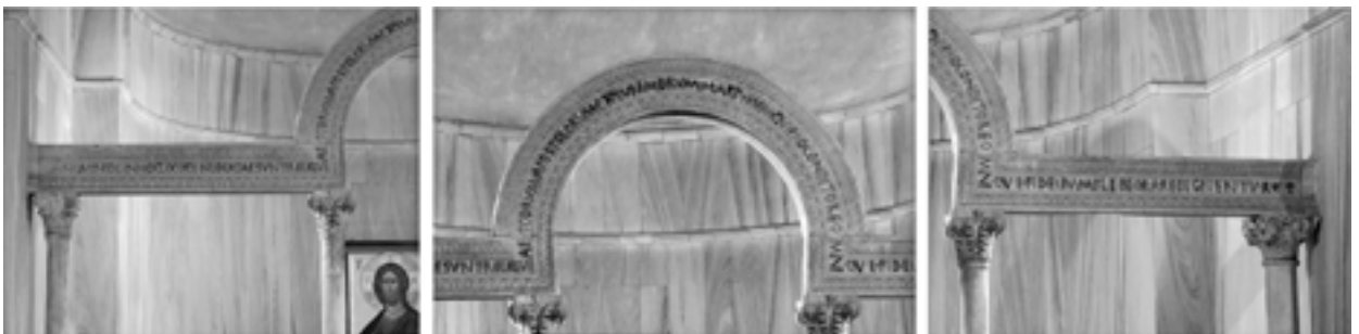
Fig. 5a-d. La pergula de l'oratoire de saint Prosdocime à S. Giustina de Padoue, vues d'ensemble (a) et de détail de l'inscription (b-c-d)

reconstitué dans les années 1970 : la barrière avait été démontée et réutilisée dans le sacellum même, au XVI e siècle. Les deux plaques ont disparu – peut-être arboraient-elles le monogramme d'Opilion ζ –, tout comme les chapiteaux des piliers-colonnettes des deux extrémités, qui ont été remplacés (Fig. 5d). L'inscription aux lettres gravées soulignées de nielle court sur une ligne qui suit l'architrave et l'arc au-dessus de l'accès central (Fig. 5a-c) : † [hedera] In nomine Dei · in hoc loco colocatae sunt · reliqui/ae s(an)ctorum · apostolorum · et · plurimorum · martyrum · qui pro conditore omni/que · fidelium plebe orare dignentur [hedera] † 47 (Au nom de Dieu, en ce lieu ont été placées les reliques des saints apôtres et de maints martyrs qui sont dignes de prier pour le fondateur et tout le peuple des fidèles). L'iden-