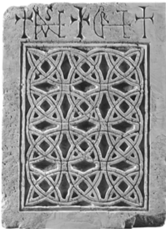
Fig. 4. Plaque de la pergula de Bilice (cl. MHAS)

orientaux, débutant par CHR I ou E... C'est là ce qui poussa Viktor Novak à lire en 1929 Miserere Christe sur la plaque à cercles sécants (Fig. 4) 37 , lecture retenue depuis. Dans sa restitution récente de la pergula de Bilice, Ana Mišković situe les deux plaques côte à côte, affichant une répétition inversée de l'invocation à la clémence du Christ 38 . Encadrer par ces plaques l'accès au sanctuaire nous semblerait plus pertinent : la mise en page de leurs bordures sommitales est proche de celle des linteaux de portes contemporains de la région, gravés de trois croix latines alignées 39 , enrichie ici des deux paires de signa 40 – quoi de plus approprié qu'une double prière au seuil même du chœur ζ