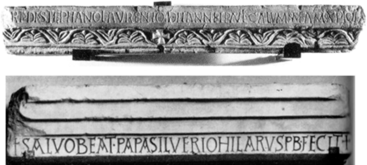
Fig. 6a-b. Tronçons de pergulae de S. Stefano rotondo (a) et de S. Pudenziana à Rome (b) (Corpus CISAM, t. VII-6, pl. V-14 [a], et t. VII-1, pl. XLVI-97 [b])

tité du préfet du prétoire Rufus Venatius Opilio , consul en 524 sous le règne de Théodoric (493-526) 48 , est suggérée implicitement et humblement par le terme conditor dans ce simple procès-verbal non daté, mais une longue inscription dédicatoire placée en façade de la basilique rendait hommage à son œuvre. L'épigraphe du chancel était ainsi facilement comprise par les lecteurs de l'époque. Un dispositif très similaire existait dans l'oratoire cruciforme à coupole de S. Maria mater domini à la basilique funéraire des S. Felice e Fortunato à Vicence 49 . Au-devant de l'autel se dressait avant 1649 une pergula également inscrite dans les années trente du VI e siècle, dont ne subsiste qu'une description (« une corniche soutenue par quatre colonnes ») publiée au XVIII e siècle. L'épistyle portait la dédicace d'un haut fonctionnaire du royaume ostrogoth, contemporain d'Opilion, le référendaire Grégoire : Hoc oratorium b(eatae) M(ariae) matris domini Gregorius sublimis uir referendarius a fundamentis aedificauit et in Christi nomine dicauit 50 (Cet oratoire de la bienheureuse Marie mère du seigneur, Grégoire, homme sublime, référendaire, l'a édifié depuis les fondations et [en] a fait offrande au nom du Christ).