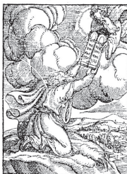
In Vinegia appresso Stefano et Battista Cognati al Segno de S. Moise. CON GRATIA ET PRIVILEGIO. M. D. XLIX.

Da Catharo Dalmatino. Non più date in luce.