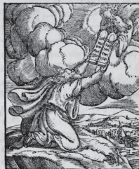
Con gratia et privilegio, In Vinegia appresso Battista et Stephano cognati, Al Segno de S. Moise. M. D. XLIX.

Delle eccellenti uirtu, et marauigliosi fatti di Her- cole, di latino in uolgare nouamente tra- dotto per Bernar dino Chriſoſopho.