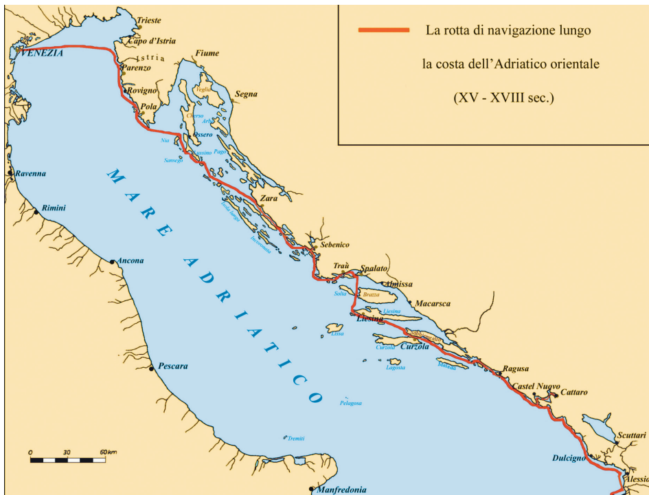
Fig. 3: La rotta di navigazione principale dell'Adriatico nell'evo moderno

mente conosciuto, lungo circa undici chilometri, ma estendevano, fino a comprendere tutte tutte quelle isole che separavano la laguna di Venezia dal mare Adriatico, o Lido di Iesolo e Lido del Cavallino a nord, nonché la Pellestrina a sud del Lido di Venezia. 8