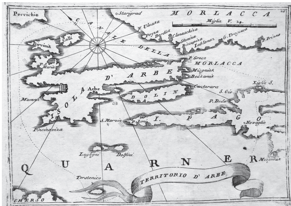
Fig. 2: Isola d'Arbe (Coronelli, Mari, Golfi, Isole, Spiagge,... , 1694)

il numero delle rappresentazioni insulari. 6 Da Rosaccio, alla fine del XVII secolo, negli isolari pubblicati non si ebbero ulteriori progressi nella qualità sia delle informazioni raccolte che delle rappresentazioni cartografiche. Con il veneto Vincenzo Maria Coronelli, il genere letterario, geografico e didattico degli isolari raggiunse il suo massimo splendore. Grazie alla posizione sociale raggiunta nella Serenissima e al titolo di “cartografo della Repubblica”, Coronelli venne in possesso di informazioni e carte segrete conservate negli archivi a Venezia. Grazie a queste informazioni, Coronelli fu in grado di pubblicare un isolario e delle carte nautiche di grande qualità. Degni di considerazione sono le minuziose raffigurazioni di isole e zone costiere, basate per lo più sull'esatta misurazione dei terreni, raccolte in