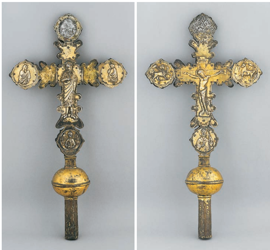
Fig. 2: Croce di Piscimano

cristiana, circondato dai simboli degli evangelisti inseriti nei tondi o negli spazi polilobati del tratto terminale delle aste. Ambedue le croci zaratine prese in considerazione rispettano grosso modo questo consueto schema iconografico, seppur con alcune varianti. Sulla croce di Piscimano, in un secondo momento, i tetramorfi vennero posizionati sulla parte anteriore mentre la Madonna e San Giovanni Evangelista finirono sul lato posteriore. Nel tratto inferiore, al posto del simbolo dell'evangelista, fu collocato il busto di San Benedetto; il busto sovrastante che raffigura il Dio Padre è invece più recente.