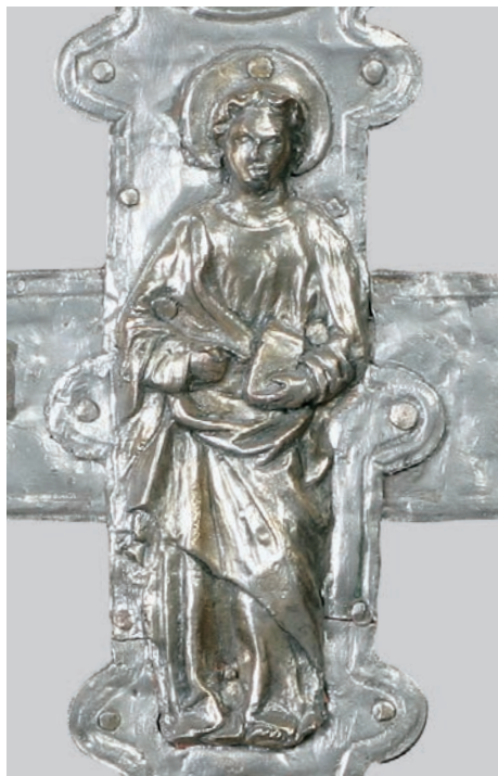
Fig. 18a: Croce di Novegradi, particolare - S. Caterina

per mettere a fuoco una serie di aspetti molto significativi. Non volendo adentrarci in uno studio storico dettagliato, ricorriamo alla relazione del collega Giorgio Ronconi presentata durante il nostro primo incontro a Padova nel 2005 e successivamente pubblicata nel primo volume degli atti del Convegno 37 . G. Ronconi, che si occupa delle relazioni intercorse tra i Carraresi, signori di Padova, e i conti Frangipane, ci offre un quadro della situazione e delle circostanze storiche venutesi a creare con il matrimonio tra Caterina da Carrara e Stefano di Bartolomeo Frangipane a Modruš. Il matrimonio fu promosso dal re ungaro-croato che in quel frangente mirava alla costituzione di un'alleanza militare contro la Repubblica di Venezia. Francesco da Carrara, dopo aver stretto una