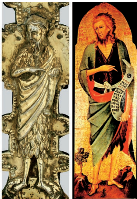
Fig. 5: San Giovanni Battista dalla croce di Piscimano e il frammento di polittico a Kožlovac attribuito a Meneghelo di Giovanni

(in riferimento a un polittico conservato alla National Gallery di Londra che racconta la storia di Sant'Elsino) mentre nella letteratura croata lo si conosce come "Pittore del crocifisso di Tcon" 18 (località sull'isola di Piscimano dove è ubicato il monastero dei monaci benedettini). Negli ultimi decenni è stato invece identificato con un pittore zaratino di origine veneziana, Meneghelo di Giovanni de Canalli, attivo a Zara nel periodo 1384-1431 ma anche sull'altra sponda dell'Adriatico, per esempio a Fermo 19 . Le affinità stilistiche delle sue figure dipinte di San Giovanni Battista con quella sbalzata sulla croce di Piscimano ci persuadono del fatto che alla base di quest'ultima vi sia un