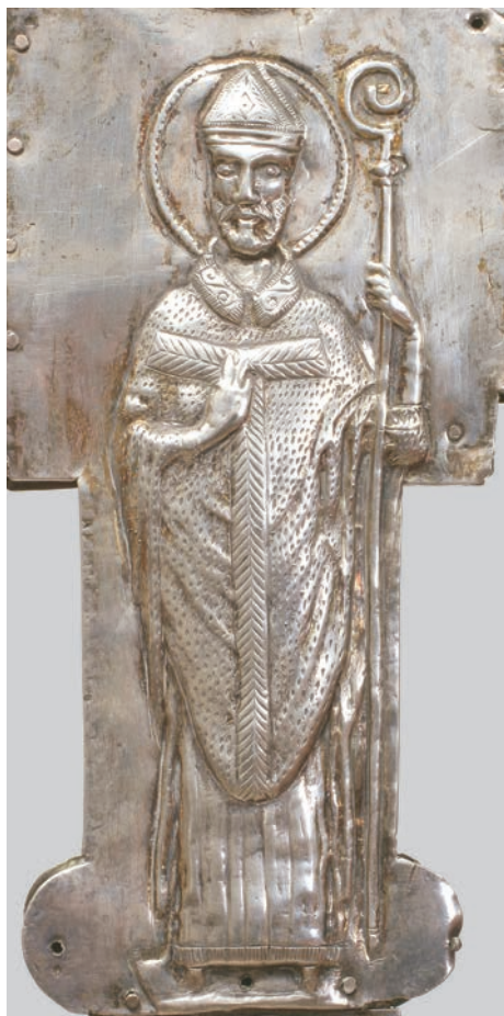
Fig. 3: Croce di Pago, particolare - San Benedetto

manufatti: la raffigurazione di San Benedetto sulla croce di Pago trova corrispondenza con un busto sulla croce di Piscimano (fig. 3 e 4). Appare dunque evidente che anche questi particolari figurativi furono modellati secondo il medesimo disegno. Le modalità di esecuzione della figura di San Benedetto e del corpo di Cristo sono un solido nesso tra queste due opere 16 . Osservan-