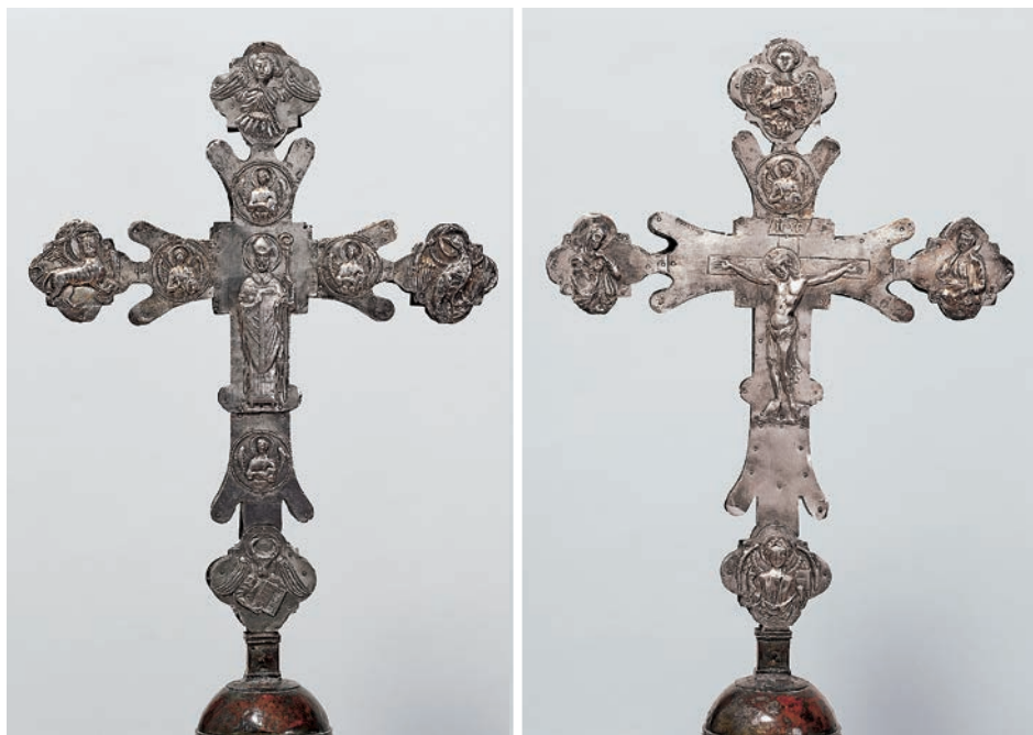
Fig. 1: Croce di Pago

la di Piscimano (fig. 2) 15 . L'anima lignea di queste croci è rivestita da lamine argentee dorate. Le terminazioni delle croci sono polilobate con biforcazioni sui bracci e placca centrale, caratteristiche tipiche di molti esemplari trecenteschi. Sul lato anteriore di manufatti analoghi è solitamente raffigurato Cristo crocefisso affiancato dalla Madonna e da San Giovanni Evangelista. In genere il tondo sovrastante reca il busto di S. Michele Arcangelo, mentre quello inferiore raffigura la scena in cui Adamo esce dal sarcofago; sulla parte posteriore trova posto il santo protettore della corrispondente comunità