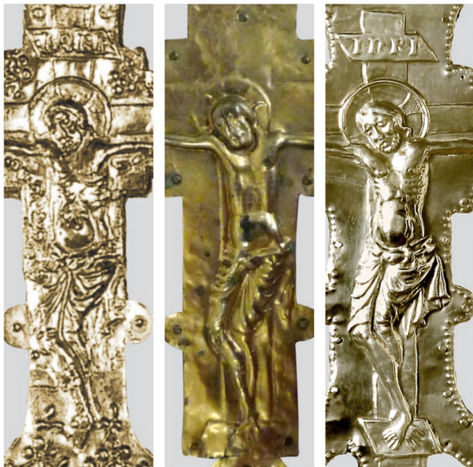
Fig. 12b: Villorba