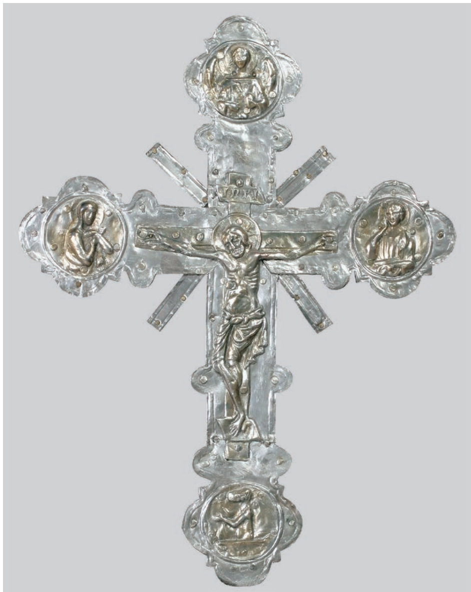
Fig. 18b: Croce di Novegradi, lato anteriore