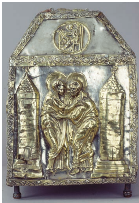
Fig. 11: Reliquiario di San Gregorio a Zara

Altri elementi figurativi della croce triestina denotano invece uno stile diverso rispetto a quello della croce di Porcen. Il corpo di Cristo dell'esemplare di Trieste non imita più i modelli bizantini ma è più moderno, con le gambe e i piedi sovrapposti, raffigurazione caratteristica delle croci eseguite alla luce dell'esperienza giottesca. Queste nuove raffigurazioni del corpo di