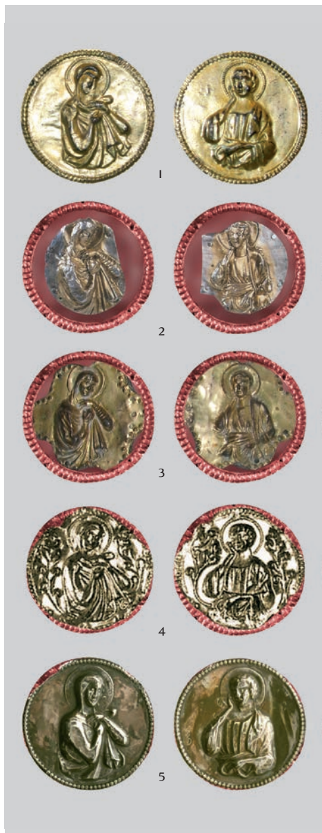
Fig. 15a: Busti della Madonna e di San Giovanni italiani: 1 Bormio, 2 Agordino, 3 Porcen, 4 Villorba, 5 Trieste