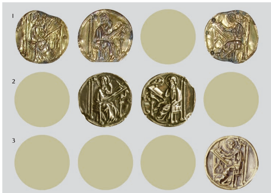
Fig. 10: Tondi recanti i Dottori della Chiesa (1 Porcen, 2 Trieste, 3 Zara)

Una conclusione del genere può essere raggiunta dall'analisi di altre croci analoghe. Sul lato posteriore dei bracci della croce di Porcen (fig. 7) sono fissati tre piccoli tondi eseguiti a sbalzo con le figure dei Padri della Chiesa cattolica, elementi questi che si ripetono su alcuni manufatti medievali dell'area altoadriatica. Per esempio, il tondo sul lato destro dalla cro-