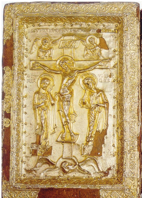
Fig. 8: Rilegatura di Treviso (lato posteriore)