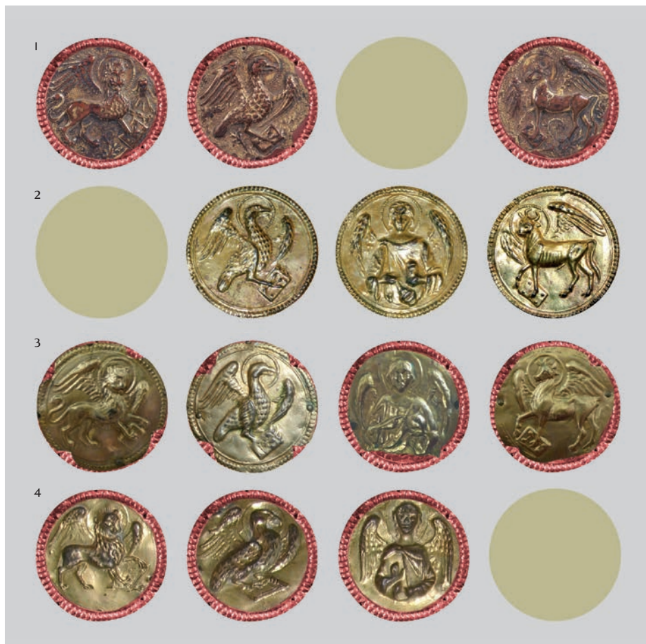
Fig. 13a: Tetramorfi sulle croci: 1 Coll. privata, 2 Bormio, 3 Rasai, 4 Porcen

Il nesso tra la maggior parte delle croci, alle quali vanno nuovamente aggiunti i due esemplari dei dintorni di Zara (Pago e Malpaga - Dračevac), è rappresentato dai medaglioni recanti i busti della Madonna e di San Giovanni (Bormio, Agordino, Porcen, Villorba, Trieste, Buccari, Senia, Novegradi) (fig. 15). Non si riesce però ad individuare il numero esatto di questi manufatti a causa della carente qualità e delle dimensioni ridotte delle fotografie pubblicate, fattori fondamentali per lo studio dei dettagli necessari alla formulazione di un giudizio in proposito. Desidero però sottoporre all'attenzio-