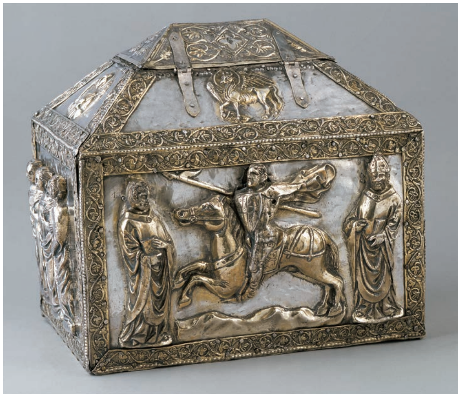
Fig. 14: Reliquiario di San Zoilo a Zara

sti non ce n'è uno, ma il busto di San Michele Arcangelo si avvicina al gruppo ivi trattato. Inoltre, in un rimaneggiamento successivo, eseguito su alcuni particolari di questa croce come ad esempio il corpo di Cristo crocefisso, vennero effettuati ampi tagli per togliere i busti dai medaglioni tanto che anche le ginocchia di Cristo vennero danneggiate. A dispetto di queste mutilazioni, si può ancora apprezzare l'elevata qualità dei dettagli realizzati a sbalzo. È pertanto possibile ipotizzare l'utilizzo di nuovi stampi che, più tardi, probabilmente a fronte di un loro uso eccessivo, si rovinarono oppure che l'orafo sia stato molto abile nell'eseguire i particolari su un modello preesistente.