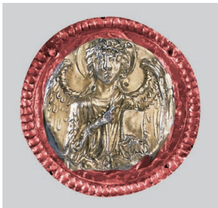
Fig. 19: Il busto di San Michele Arcangelo sulla croce di San Tommaso Agordino

serie di accordi col re, già nel 1360 entrò in possesso delle città di Feltre e di Belluno e, qualche tempo dopo, nel 1384, ottenne dal duca d'Austria anche Treviso 38 . È proprio da quella parte d'Italia che provengono le cinque croci astili di cui abbiamo discusso. I tre esemplari della costa adriatica orientale (Buccari, Senia, Novegradi) provengono invece dal territorio controllato dagli alleati croati dei Carraresi, membri della casata dei Frangipane, e dal conte Butko Kurjaković che nel 1394 ricopriva la carica di bano , ossia quella di capo dell'esercito croato.