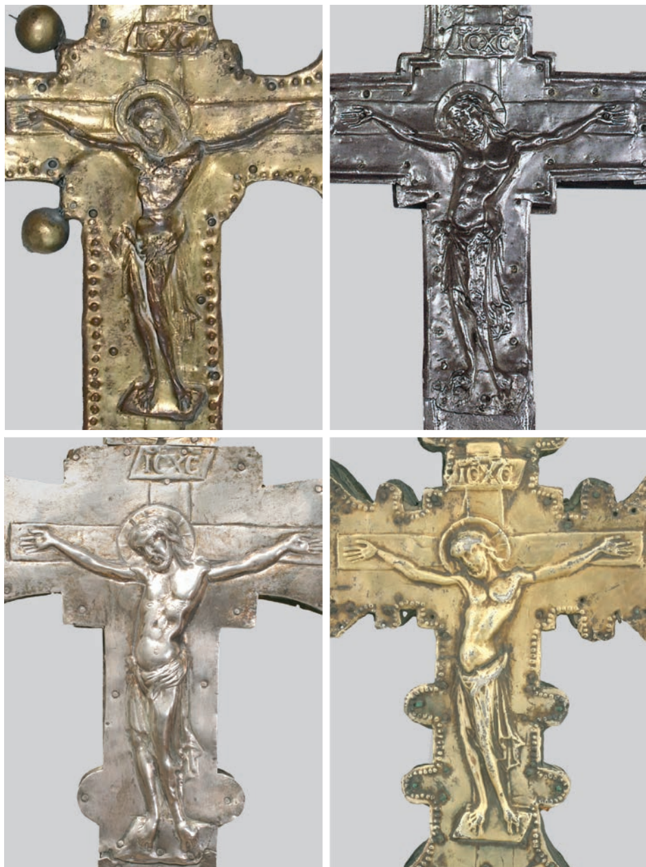
Fig. 9: Quattro corpi di Cristo riferibili alle croci di Porcen, Valada, Pago, Piscimano