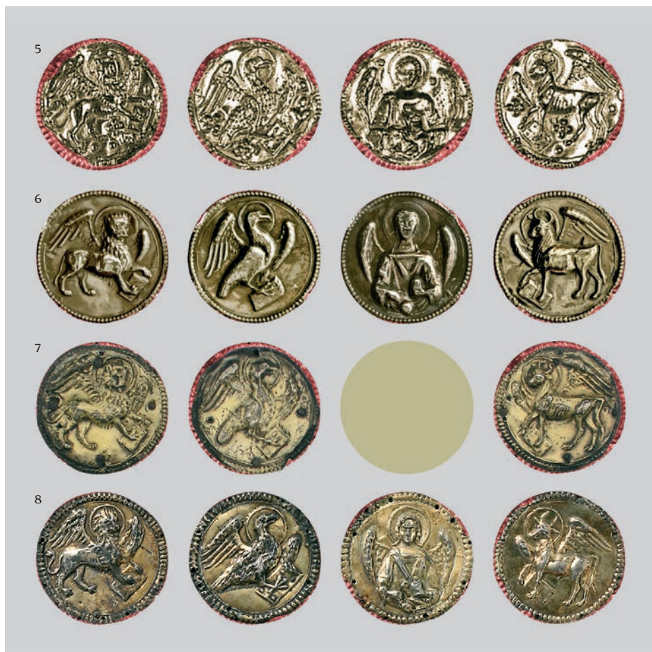
Fig. 13b: Tetramorfi sulle croci: 5 Villorba, 6 Trieste, 7 Buccari, 8 Senia

ne del lettore un altro tipo di busto della Madonna e di San Giovanni, meno usuale ma altrettanto singolare, riscontrato in crocifissi di Rasai presso Feltre e di Sancassiano, vicino Zara (fig. 17). Il riscontro di questi elementi dimostra ulteriormente l'intensa circolazione di matrici utilizzate per la tecnica dello sbalzo tra il Veneto e la Dalmazia cui consegue un aumento numerico dei manufatti di oreficeria derivati da modelli comuni e pertanto strettamente legati tra loro (fig. 20).