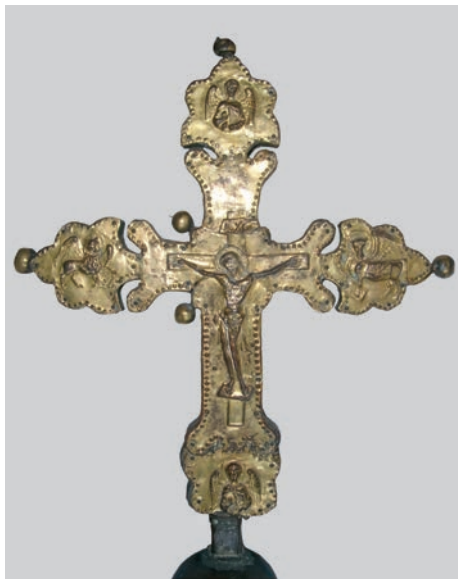
Fig. 6: Croce di Porcen, lato anteriore

numerose scene bizantine di Crocifissione del XII-XIII secolo, il titulus ICXC (Iesus Xristos) presenta caratteri greci piuttosto che l'INRI latino (Iesus Nazarenus Rex Iudeorum) come del resto in molti altri crocifissi dell'epoca. A mio avviso, dunque, si tratterebbe di una vera e propria scelta stilistica molto conservativa del committente che riflette il gusto delle comunità benedettine trecentesche in Dalmazia.