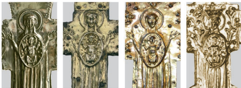
Fig. 16: Trieste