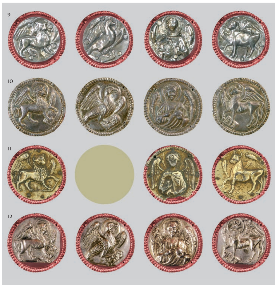
Fig. 13c: Tetramorfi sulle croci: 9 Novegradi, 10 Sancassiano, 11 Piscimano, e su reliquiario di San Zoilo a Zara (12)

Tuttavia, nonostante l'elevato numero di dettagli figurativi sbalzati, è possibile distinguere molte differenze qualitative. Non intendo analizzare in dettaglio tali diversità, tuttavia ritengo importante ribadire che la croce di San Tommaso Agordino si dimostra di qualità superiore rispetto ad altri analoghi manufatti, sebbene su di essa, purtroppo, si sia conservato il minor numero di dettagli da utilizzare a fini comparativi. Oltre al corpo di Cristo, vi sono anche i medaglioni recanti la Madonna e San Giovanni. Tra i simboli degli evangeli-