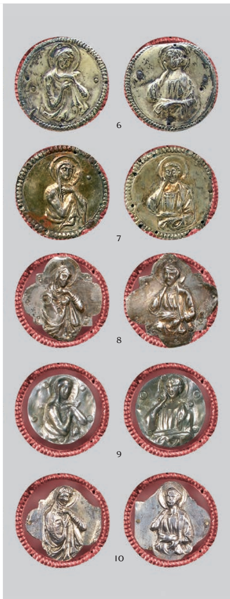
Fig. 15b: Busti della Madonna e di San Giovanni croati: 6 Buccari, 7 Senia, 8 Pago, 9 Novegradi, 10 Malpaga - Dračevac