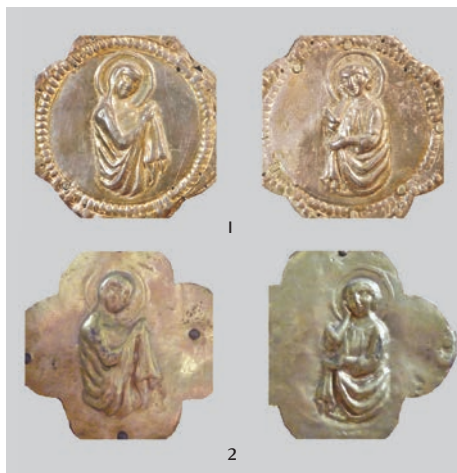
Fig. 17: Busti della Madonna e di San Giovanni (1 Sancassiano, 2 Rasai)

Per quanto concerne la datazione di tutte queste croci, recanti i corpi di Cristo sbalzati secondo un modello unico piuttosto diffuso, propongo l'ultimo decennio del XIV secolo. Se la mia ipotesi si dovesse dimostrare esatta, potrebbe gettare nuova luce sui rapporti finora sconosciuti tra le famiglie dei Frangipane di Veglia e i Carraresi di Padova, all'epoca signori di Feltre e di Belluno. Ancora una precisazione a favore della datazione ipotizzata per le croci in questione: sul retro della croce di Novegradi è raffigurata Santa Caterina (fig. 18) alla quale fu consacrata la chiesa da dove proviene questo manufatto. Nel 1393 a Novegradi fu eretto un convento francescano, fondato dal conte Butko Kurjaković ed intitolato proprio a Santa Caterina. I resti dell'edificio conventuale sono tuttora visibili vicino alla chiesa parrocchiale di Santa Maria Minore, nella quale il crocefisso in questione è attualmente custodito. L'appartenenza della croce al convento francescano è indiscutibile e, di conseguenza, è molto probabile che il manufatto fosse stato commissionato proprio in occasio-