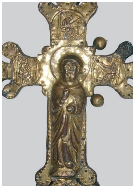
Fig. 7: Croce di Porcen, particolare del lato posteriore

Analizzando la croce di Vallada, A. M. Spiazzi pose attenzione alla rilegatura di un evangelionario appartenente al tesoro della cattedrale di Treviso (fig. 8) che sul lato posteriore reca una Crocifissione sulla quale la resa del corpo di Cristo corrisponde perfettamente a quella degli esemplari dalmati e veneti. Per fortuna in questo caso si conosce molto bene il committente dell'opera. Si