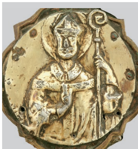
Fig. 4: Croce di Piscimano, particolare - San Benedetto

manufatti: la raffigurazione di San Benedetto sulla croce di Pago trova corrispondenza con un busto sulla croce di Piscimano (fig. 3 e 4). Appare dunque evidente che anche questi particolari figurativi furono modellati secondo il medesimo disegno. Le modalità di esecuzione della figura di San Benedetto e del corpo di Cristo sono un solido nesso tra queste due opere 16 . Osservan-