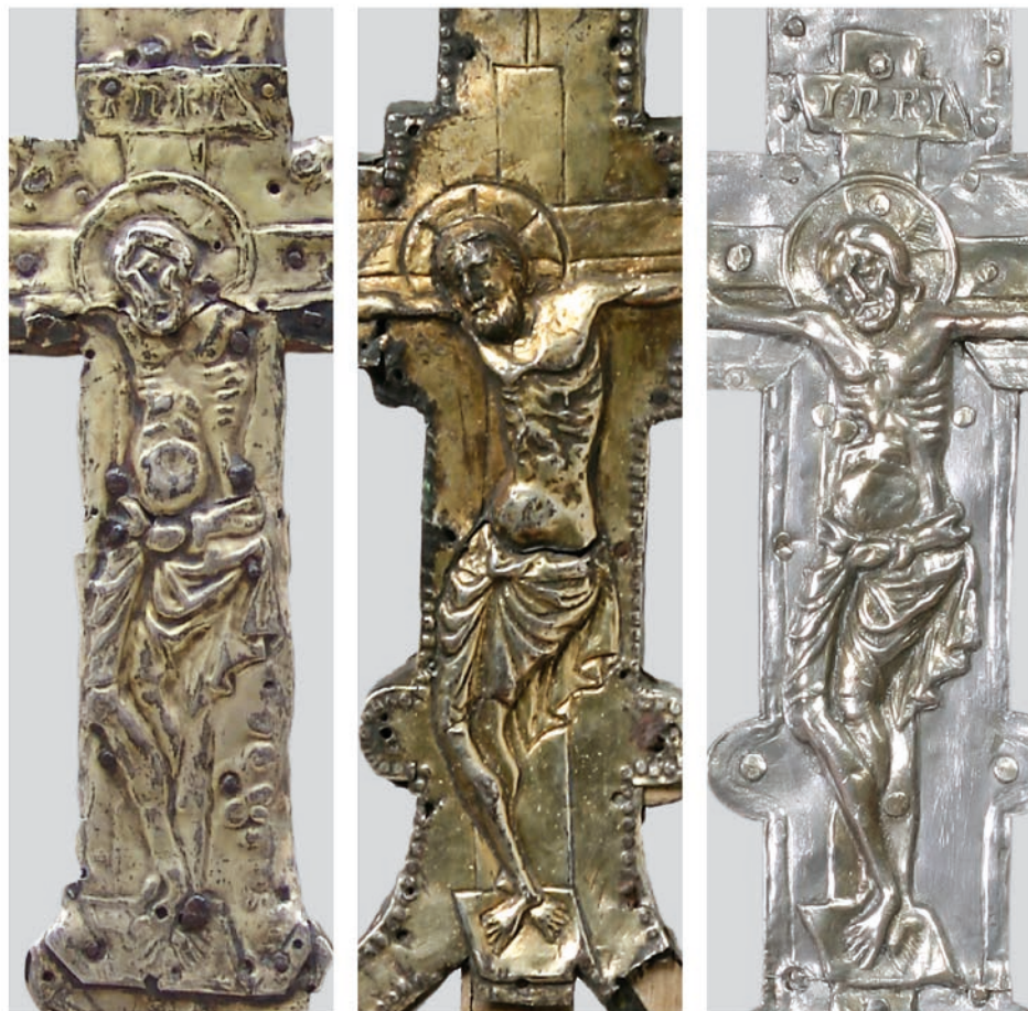
Fig. 12c: Buccari