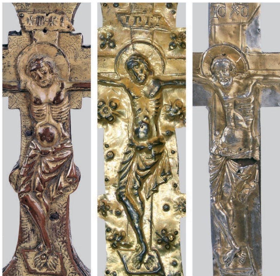
Fig. 12a: Coll. privata