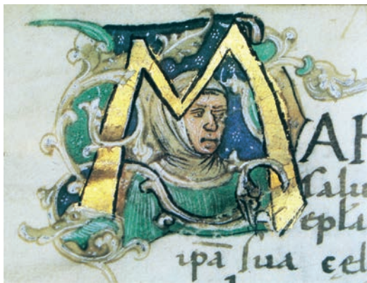
Fig. 6: Cristoforo Cortese, Miscellanea , Trogir, Archivio Capitolare, M. 181, f. 50r, iniziale M con ritratto

Di lui si conservano a Trogir almeno due opere autografe assai interessanti perché documentano due diverse fasi e due diversi esiti stilistici del miniatore. La prima è un Messale conservato all'Archivio Capitolare di Trogir in pergamena di 215 fogli (Cod. 19) 19 . Esso presenta decorazioni marginali in filigrana abitate da putti e angeli, tra cui quelle del foglio incipit del Messale, purtroppo in parte ritagliato e manomesso. Putto e angelo, ma anche la decorazione a foglie