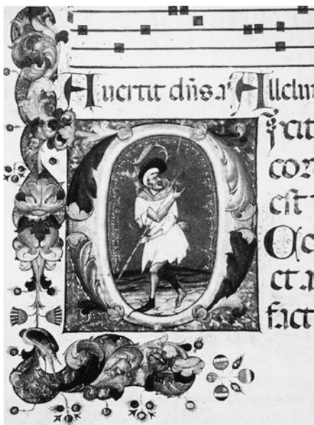
Fig. 3: Giovanni di Antonio da Bologna, foglio da Salterio , già Berlino, collezione Paul Graupe, iniziale D con l'Insipens

bri tramite le comunità francescane e domenicane. A documentare l'arrivo dei Graduali di San Francesco a Zara, scartando una loro esecuzione in Zara, come ho già avuto modo di scrivere, è la presenza nelle litanie del Graduale segnato B di addizioni di mano più tarda di santi venerati in loco, come Crisogono e Donato, che appunto dimostrano un seriore adattamento al culto locale. Un'altra importante testimonianza di opera che raggiunse la terra dalmata, ma non fu ivi eseguita è quella del Graduale conservato nell'Archivio del Capitolo di Trogir datato 1372, studiato da Andrea de Marchi nel catalogo della mostra Tesori della Croazia 14 . Il codice è in parte dipinto da Andrea da Fermo, un miniatore marchigiano che appone la sua firma «Andreas de firmo» nella miniatura con la Pentecoste