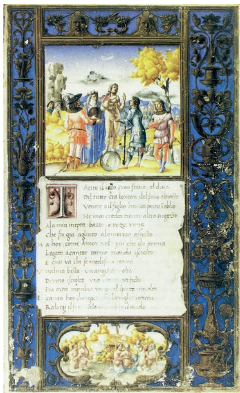
Fig. 13: Secondo Maestro del Canzoniere Grifo, ANTONIO GRIFO, Canzoniere , Venezia, Biblioteca Nazionale Marciana, It. Z. 64, 4824, f. 233r, fregio sui quattro margini e vignetta con Trionfo di Anteros e di Venere Genitrice

dalla bottega del Bordon 34 . Uno di questi, cui la critica ha dato il nome di Secondo Maestro del Canzoniere Grifo perché autore di alcune pagine del Canzoniere del poeta cortigiano Antonio Grifo, mi sembra molto vicino