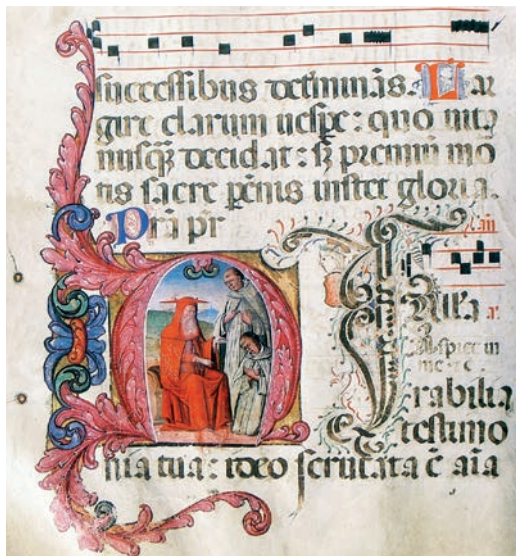
Fig. 10: Maestro delle Sette virtù, Salterio , Dubrovnik, Biblioteca Franciscana, Cod. A, f. 60v, iniziale A con san Girolamo intento a insegnare a due monaci certosini

E' possibile dunque che anche libri in glagolitico, con ogni probabilità scritti in loco, venissero dati da miniare, probabilmente a Venezia, a artisti veneziani. Il confronto che propongo è con l'incunabolo attribuito al Maestro di Pico contenente la Legenda Aurea di Jacopo da Varagine in volgare della Biblioteca del Seminario di Padova (FORC. M. 2. 22), eseguito per la famiglia veneziana dei