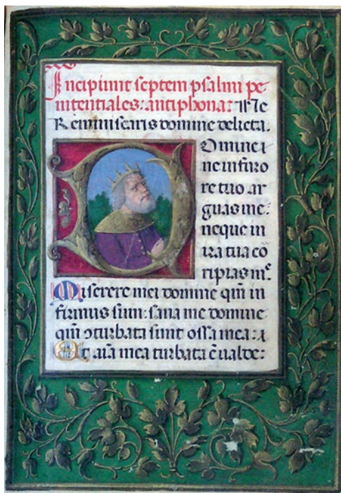
Fig. 12: Benedetto Bordon o Secondo Maestro del Canzoniere Grifo, Libro d'Ore , Zara, Naučna Biblioteka (Research Library), cod. 8, f. 89r, fregio sui quattro margini e iniziale con Re David.

delle carte più rappresentative, quelle cioè con iniziali figurate e fregi che si trovano agli incipit degli Uffici contenuti nel Libro d'ore. Con tale termine si intende il libro liturgico per la preghiera delle ore destinato ai laici e dunque contenente una versione succinta dei testi del Breviario. L'inizio delle ore della Vergine, con l'iniziale S ( Salve sancta parens ) (f. 59v) raffigurante la Vergine su fondo di paesaggio e uno splendido fregio marginale realizzato in oro di pennello su fondo rosso con racemi, trofei di vasi e mascheroni. Ancora vi mostro la carta incipit dei Sette Salmi penitenziali ove entro la D del salmo, Domine ne in furore tuo arguas me , appare Re David (f. 89r) (Fig. 12) e l'Ufficio dei Morti (f. 93r) con una vivissima raffigurazione del teschio entro la D di Dilexi .