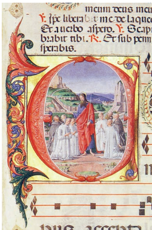
Fig. 11: Maestro delle Sette virtù, Antifonario , Ferrara, Museo Civico di Palazzo Schifanoia, Corale Certosino D, inv. n. OA 1332, f. 2r, iniziale E con San Paolo adorato da monaci certosini

Di questo miniatore, che a Venezia lavora in incunaboli giuridici a fianco di Girolamo da Cremona e Benedetto Bordon, vi mostro, a confronto con la pagina miniata di Dubrovnik, l'iniziale con San Paolo adorato da monaci certosini (Fig. 11), da un Antifonario del tempo d'Avvento dipinto per la Certosa di Ferrara attorno al 1480 (Corale certosino D, inv. OA 1332) 30 . La componente ferrarese, alla Ercole de' Roberti, si percepisce in entrambe le prove nel marcato espressionismo dei volti, nella stilizzazione delle figure, nell'andamento geometrico e innaturale dei panneggi, nelle teste sferiche dei monaci. Essa appare però congiunta a stilemi veneti quali il cromatismo e la profondità del paesaggio. Nelle due opere sono diversi i fregi e le iniziali fogliacee, da imputare forse a collaboratori. L'ornato di Dubrovnik trova riscontro con opere venete