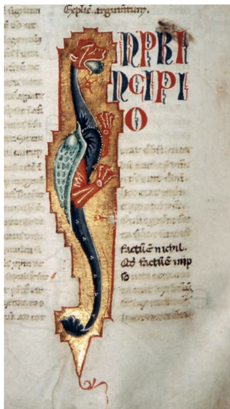
Fig. 4: Miniatore veneziano, Bibbia , Dubrovnik, Biblioteca dei Domenicani, f. 428v, iniziale I, zoomorfa in forma di drago

(Venezia, Biblioteca Nazionale Marciana, ms. lat. Cl. IX 28 = 2798), due dei capolavori della miniatura duecentesca marciana da poco emersa in tutta la sua pregnante bellezza e originalità grazie agli studi di Giordana Mariani Canova e Susy Marcon 16 . A tale gruppo va aggiunta la Bibbia oggi a Padova alla Biblioteca del Seminario Vescovile (cod. 230) 17 (Fig. 5). Le iniziali della Bibbia di