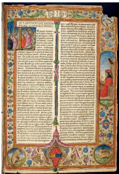
Fig. 9: Maestro di Pico, JACOPO DA VARRAGINE, Legenda Aurea , editore Gabriele di Pietro, Venezia, 1477, Padova, Biblioteca del Seminario Vescovile, Inc. FORC. M. 2. 22, fregio figurato sui quattro margini e iniziale P con Santi

Venendo al secondo Quattrocento assai interessante è il Messale della Biblioteca di Vrbnik (Verbenico) nell'isola di Krk 25 (Fig. 8). Nonostante il testo sia redatto in alfabeto glagolitico, antico alfabeto slavo usato soprattutto in codici liturgici, i fregi marginali con cornice in filigrana di penna arricchita da fiori multicolori, bottoni dorati, frutti e oculli, ma anche l'iniziale D con figura di Re David sono da attribuire al Maestro di Pico, artista attivo tra Ferrara e Venezia tra il 1460 e il 1505, cui la critica ha dato il nome di Maestro di Pico in relazione ad una Historia Naturalis di Plinio dipinta dal maestro nel 1481 per l'umanista e filologo fiorentino Giovanni Pico della Mirandola, oggi conservata alla Biblioteca Marciana (ms. Lat. Vi, 245=2976) 26 .