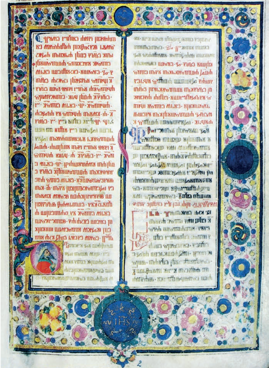
Fig. 8: Maestro di Pico, Messale , Krk, Vrbnik (Verbenico), f. 19r, fregio sui quattro margini e iniziale con Re David