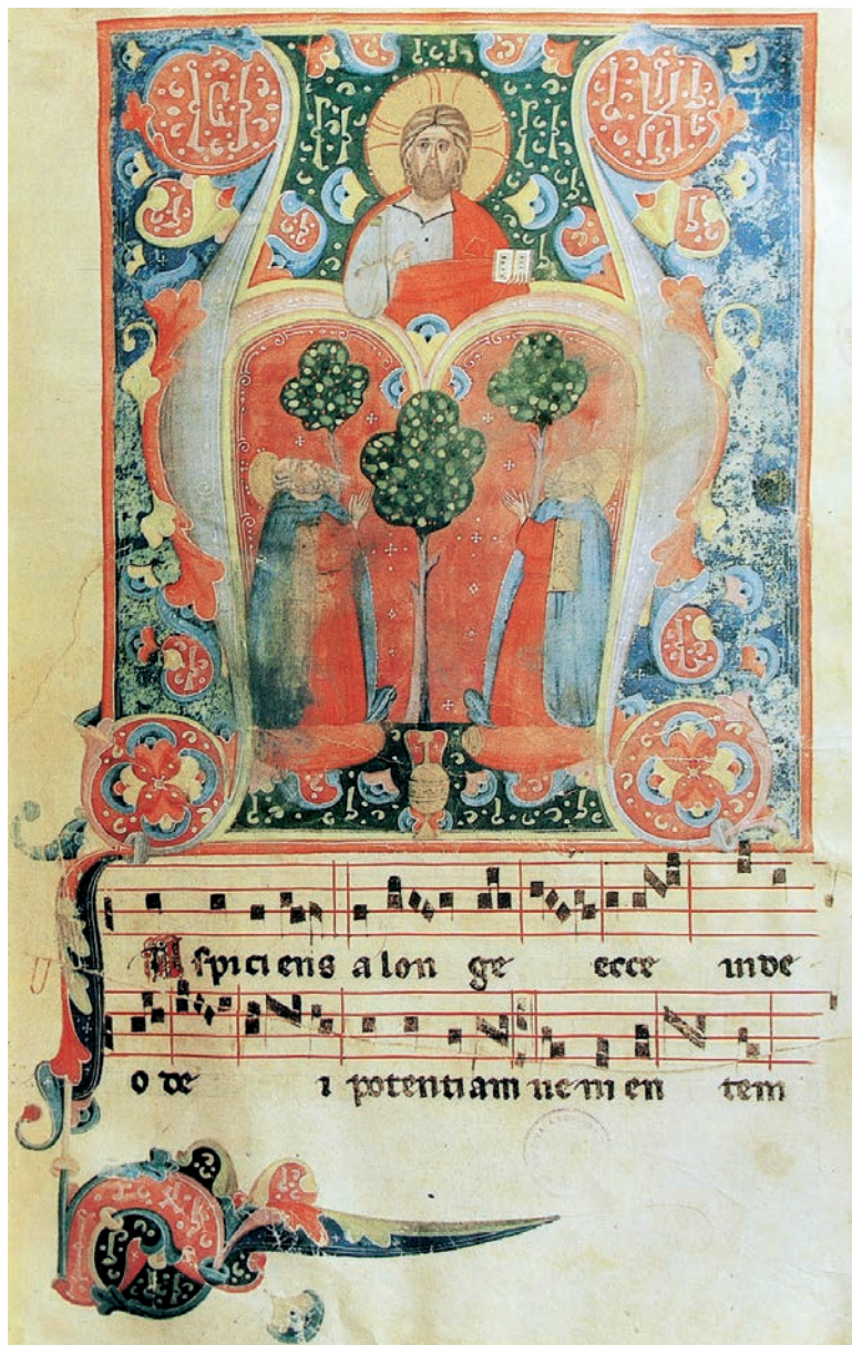
Fig. 1: Nerio, Antifonario , Sebenico, San Francesco, Cod. 65, f. 15r, iniziale A con Cristo in Maestà adorato da santi