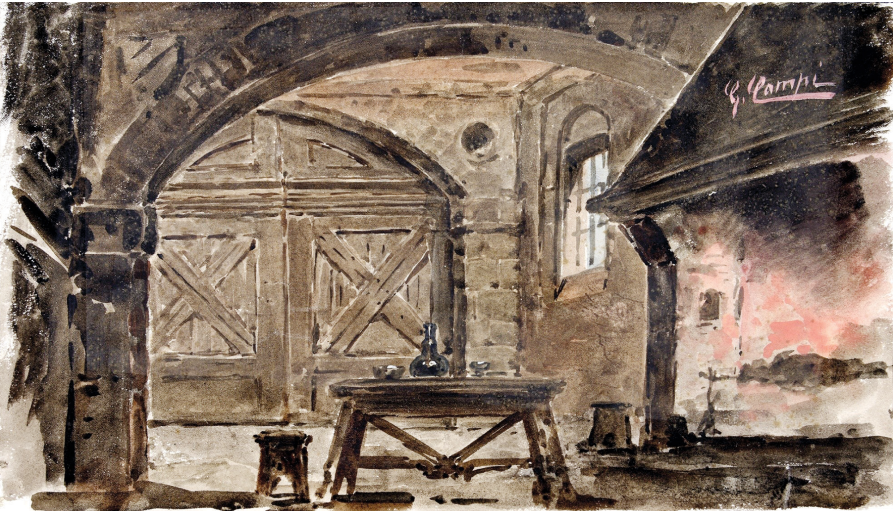
Giacomo Campi, [«Ampia stanza nella casa di Giorgio»]

Come la patria nostra Il valor nostro è antico; E come questi monti Fra cielo e mare fieramente dritti, Indomiti noi siam, tremendi, invitti! 22