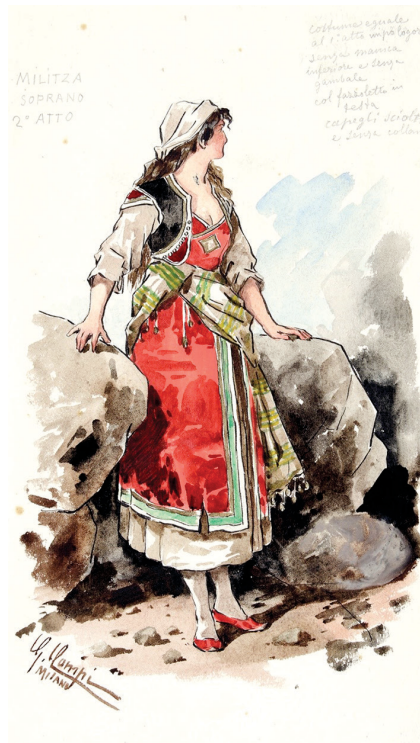
Giacomo Campi, Militza 2° atto

E mentre i due si scambiano parole e versi di eterno amore, nella scena successiva, la sesta, appare in mezzo ai macigni Vladimiro che si accosta ai due amanti, li spia e poi aggredisce Hassan affondandogli il kanjar nel petto. Militza stringe l'amato tra le braccia e Vladimiro, anche questa volta, «forsennato la colpisce col pugnale tratto dal petto di HASSAN» 51 . Così cade moribonda sul corpo del giovane dichiarando «son tua... in eterno!», mentre Vladimiro fugge e dalla gola «si sente una ripresa della marcia dei Montenegrini che ritornano vittoriosi» 52 .