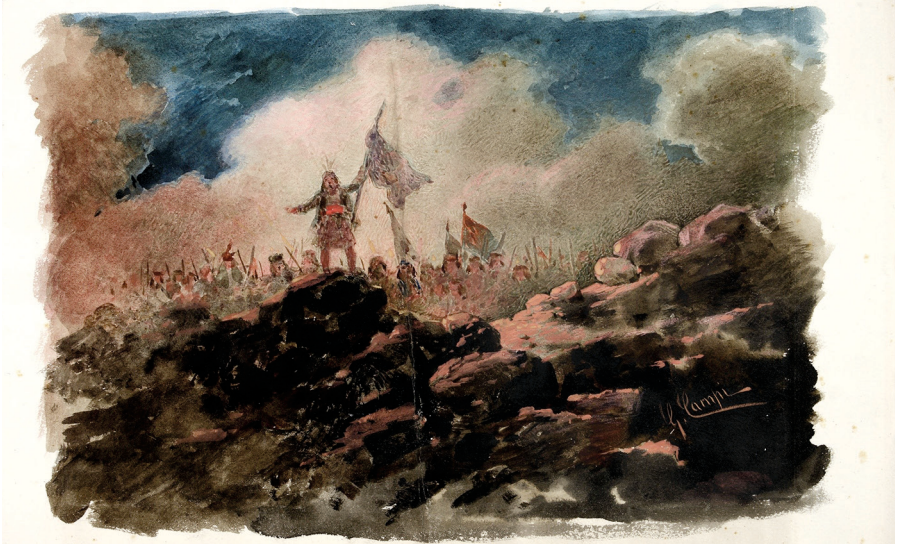
Giacomo Campi, [Montenegrini vittoriosi]

La scelta di Anzoletti per un soggetto di «carattere slavo», con tutti i suoi slavismi, i richiami e le allusioni all'Oriente (a partire dal lessico stesso: domaćin , ledenitz , carùl , kanjar ) è del tutto insolita se si pensa alla sua produzione. Ci si domanda perché fosse tanto attratto dalle vicende storiche del Montenegro e da chi potesse attingere notizie così puntuali sulla cultura e la tradizione slave. Non si può che ammettere che alla base di questa suggestione vi fosse l'evento che aveva segnato quegli anni, e cioè le nozze di Vittorio Emanuele ed Elena Petrović.