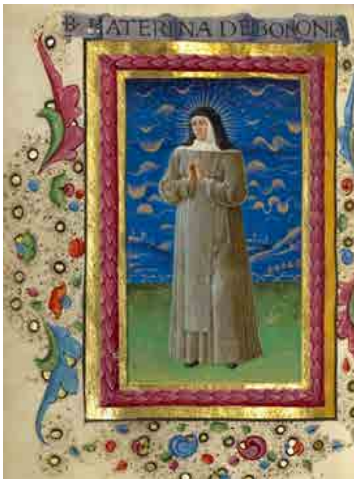
Fig. 5. Guglielmo Giraldi, Libro d'ore , Los Angeles, Getty Museum, MS Ludwig IX. 13, f. 185v, Beata Caterina Vigri

Se queste sono testimonianze di effigi di Caterina, la spiritualità pauperistica dell'osservanza francescana maschile e femminile è bene documentata in un gruppo di miniature staccate appartenenti a una serie di Corali, eseguite nei primi anni sessanta del XV secolo per un convento francescano ferrarese che per Kanter potrebbe essere proprio il Corpus Domini. 19 Tra questi cutting vi sono l'iniziale con la Natività della Vergine (Berlin, Kupferstichkabinett, n. 4493) e quella relativa alla festa di Tutti i santi (New York, The Metropolitan Museum, Rogers Fund, 1911; 11.50.2) (Fig. 6) per le quali, data l'altezza qualitativa, è stato fatto il nome del pittore di corte Cosmè Tura. Proprio l'iniziale con Tutti i Santi di New York mostra quattro santi, due figure maschili e due femminili, che potrebbero essere identificati con osservanti francescani. In particolare il santo a sinistra dovrebbe essere San Giovanni