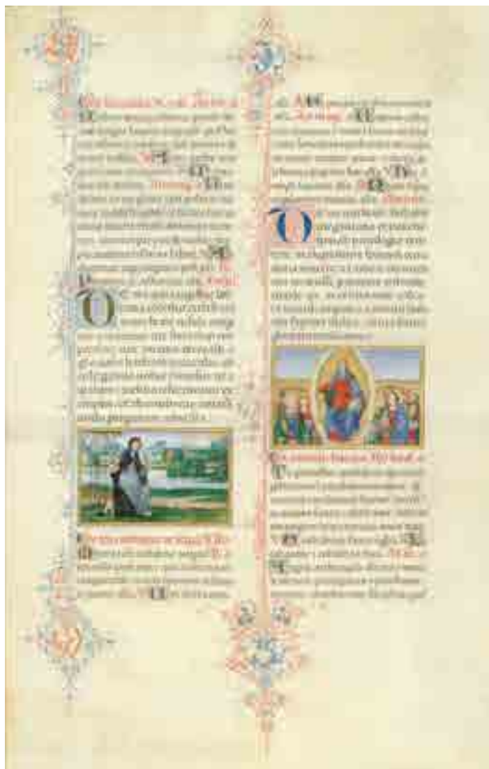
Fig. 9. Matteo da Milano, Breviario di Ercole I d'Este , Modena, Biblioteca Estense Universitaria, ms. V.G.11 = Lat. CCCCXXIV, F. 214r, Santa Caterina nell'atto di ricevere le stigmate

sotto di lei quattro terziarie domenicane mentre ai lati sono dipinti Pio II, che canonizzò la santa nel 1461, proprio in ragione delle stigmate, e Ercole I d'Este con il figlio Alfonso. Il dipinto eseguito ben oltre la morte di Ercole, è strettamente connesso alla memoria della beata e al culto del suo corpo incorrotto: fonti documentarie infatti attestano che nella chiesa di Santa Caterina da Siena l'ancona si trovava di fronte alla teca con le reliquie, e quando, in seguito alla soppressione della chiesa nel 1796, la pala fu spostata in duomo, anche la teca fu trasferita in quella sede. 27