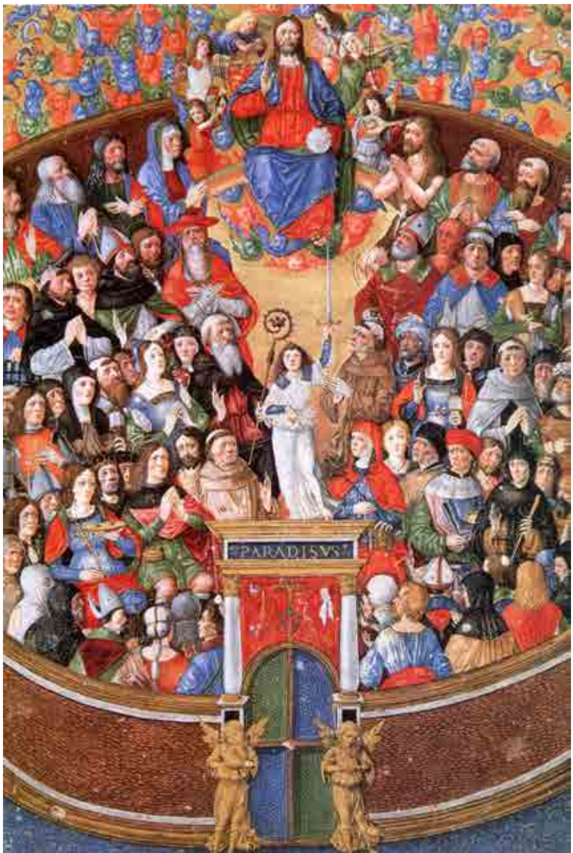
Fig. 8. Matteo da Milano, Zagabria, Strossmayerova Galerija, Foglio staccato dal Breviario di Ercole I d'Este, SG 338, Il Paradiso