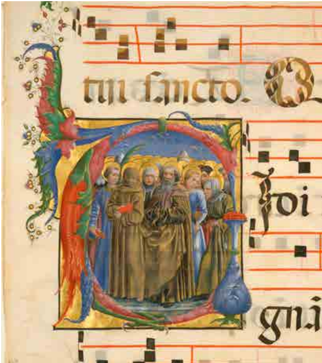
Fig. 6. Cosmè Tura, New York, The Metropolitan Museum, Rogers Fund, 1911; 11.50.2, Iniziale staccata da Antifonario, Tutti i Santi

da Capestrano che viene di solito raffigurato come qui con una croce rossa sul saio. 20 La croce sarebbe ricordo della partecipazione di Giovanni alla crociata contro i Turchi conclusasi con una vittoria nella battaglia di Belgrado. Giovanni da Capestrano fu nel 1450 a Ferrara in occasione del giubileo e della canonizzazione di San Bernardino, dove visitò il monastero del Corpus Domini, incontrando le clarisse, allora nel numero di 85 e dunque anche Caterina Vigri. 21 Non è invece possibile dare un'identità alle sante donne presenti nell'iniziale, ma l'enfasi visionaria con cui sono ritratte è in sintonia con la