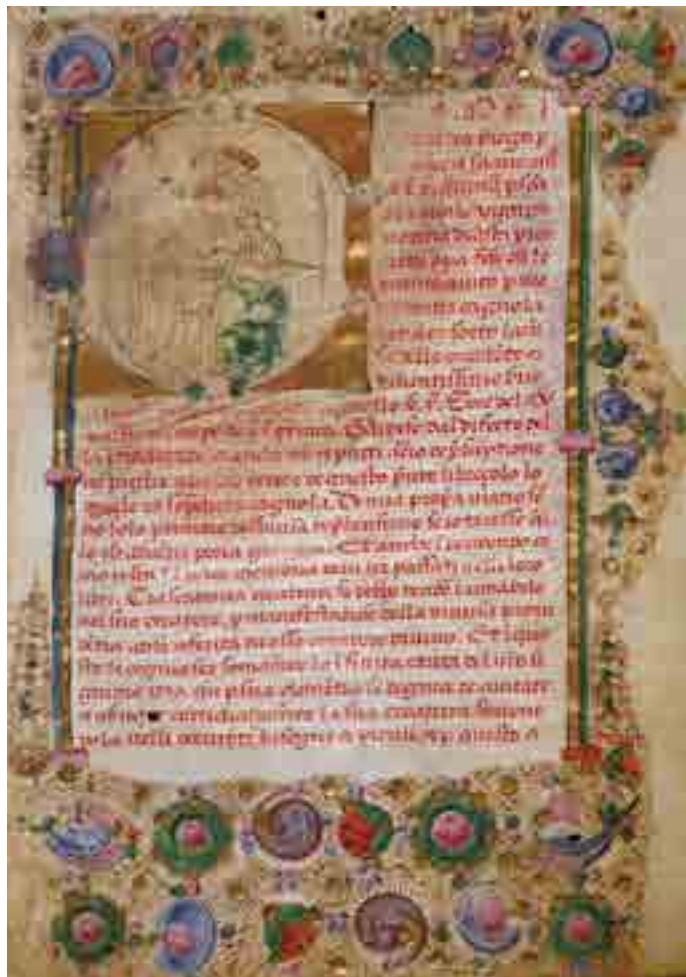
Fig. 4. Miniature ferrarese, Caterina Vigri, Le sette armi spirituali, Ferrara, Biblioteca Comunale Ariostea, ms. Classe I, n. 354, f. 1r, Caterina Vigri dinnanzi alla Vergine con il Bambino

L'altro manoscritto ferrarese di particolare interesse è il libro d'ore Gualenghi d'Este, oggi conservato al Getty Museum di Los Angeles (MS Ludwig IX. 13). 18 Fu eseguito su commissione di Andrea Gualengo e Orsina d'Este nel 1469 circa dai miniatori