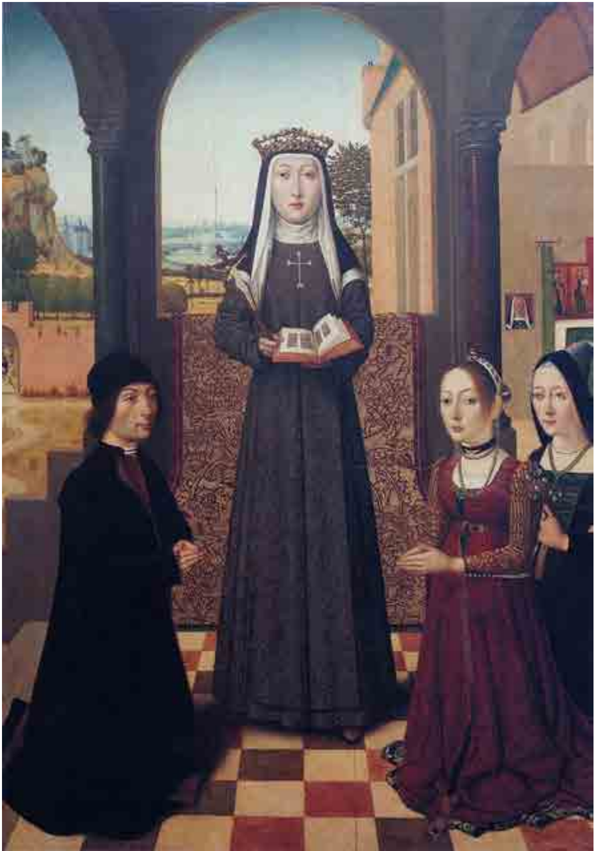
Fig. 2. Maestro dei Ritratti Baroncelli (attr.), London, The Courtauld Institute of Art, Santa Caterina Vigri con tre donatori