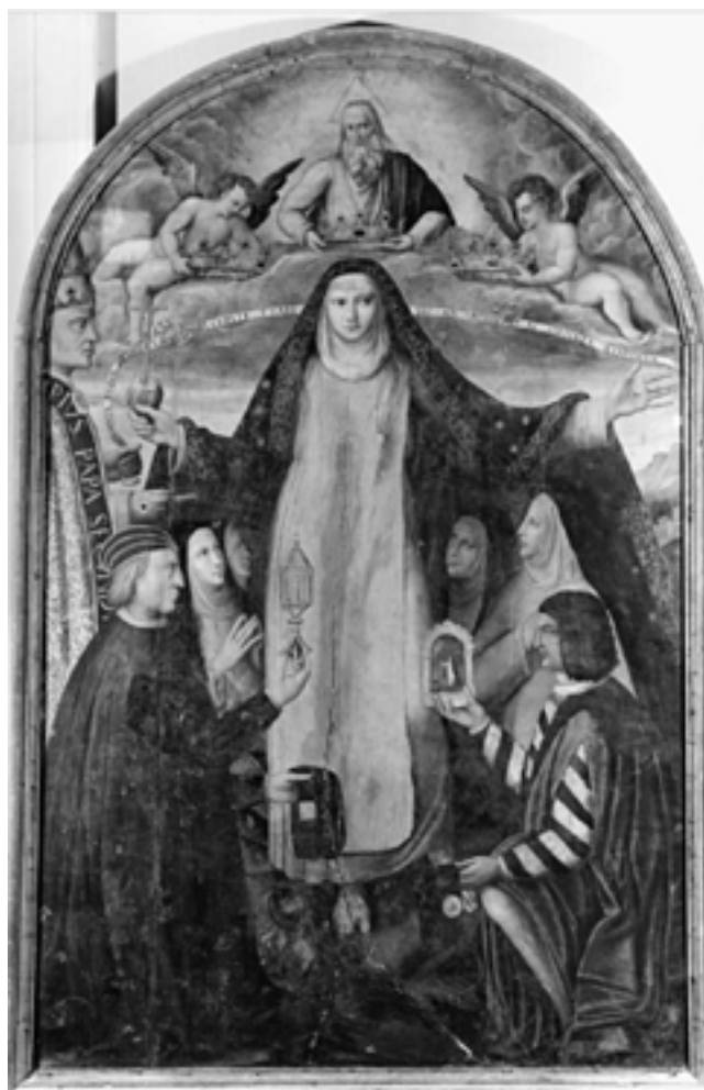
Fig. 7. Pittore ferrarese XVI secolo, Ferrara, Pinacoteca Nazionale, Inv. 243, Santa Caterina da Siena incoronata da Dio padre tra le nubi con papa Pio II, Ercole I, alcune monache e Alfonso I d'Este

Altra santa vivente fu Lucia Broccadelli da Narni, nata nel 1476 e morta nel 1544, riconosciuta ufficialmente come beata solo nel 1710, il cui corpo incorrotto è oggi conservato nella sua città natale. 23 Quando nel 1497 Ercole d'Este venne a sapere che una giovane terziaria domenicana residente a Viterbo aveva miracolosamente ricevuto il dono delle stigmate, sebbene avvertito della possibile infondatezza di tale evento, la invitò a Ferrara. Lucia, fervente seguace della riforma di Savonarola e anche per questo particolarmente amata da Ercole e da quella parte della popolazione ferrarese ancora sensibile all'insegnamento del riformatore domenicano, arrivò nella città estense nel 1499. Come aveva promesso, Ercole fondò per lei una casa di terziarie domenicane intitolata a Santa Caterina da Siena, oggi non più esistente, nella quale le monache entrarono nell'agosto del 1501. 24 Nell'atto di donazione redatto nel 1502 da Bartolomeo Gogio notaio e letterato alla corte estense, Ercole viene elogiato per essere principe "Sapiens, magnanimus, clemens, iustus" e "religiosus", nonché per avere eretto nell'Addizione Erculea dieci nuovi monasteri e avere condotto a Ferrara una vergine che "divae Catherinae vestigia imitata" portava le stigmate impresse sul suo corpo. 25 Nonostante dal 1498 il capitolo generale