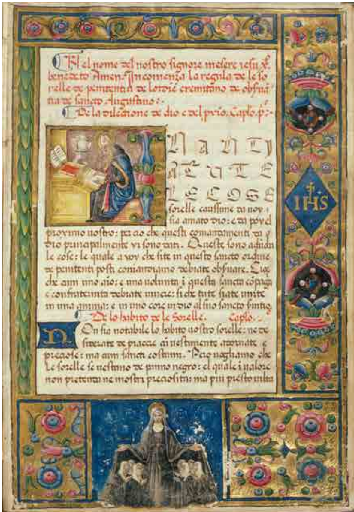
Fig. 10. Miniatore Ferrarese, Regola delle suore di Sant'Agostino, Modena, Biblioteca Estense Universitaria, Ms. Ital. 1181 = alfa.T.7.29, f. 1r, Sant'Agostino e Santa Monica con le sorelle