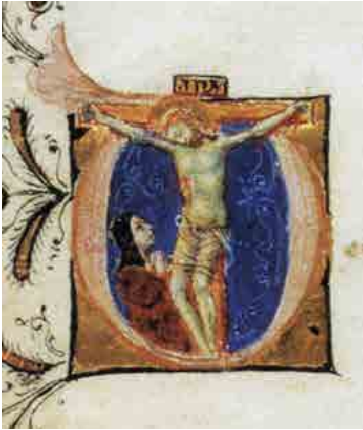
Fig. 3. Miniature bolognese, Caterina Vigri, Le sette armi spirituali , Bologna, Monastero del Corpus Domini, Cappella della Santa, f. 51r, Caterina Vigri in adorazione del Crocifisso

danti l'uso delle cortine in particolari cerimonie liturgiche, ad esempio il Maestro di Saint Giles che mostra l'interno della chiesa di Saint Denis nella pala oggi a Londra (National Gallery), ma anche Beato Angelico nella pala per l'altare maggiore di San Marco. 14 Nel caso della tavola del Courtauld, la posizione della tenda mobile lascia aperta la possibilità che la cortina fosse funzionale a svelare o velare il volto della santa.