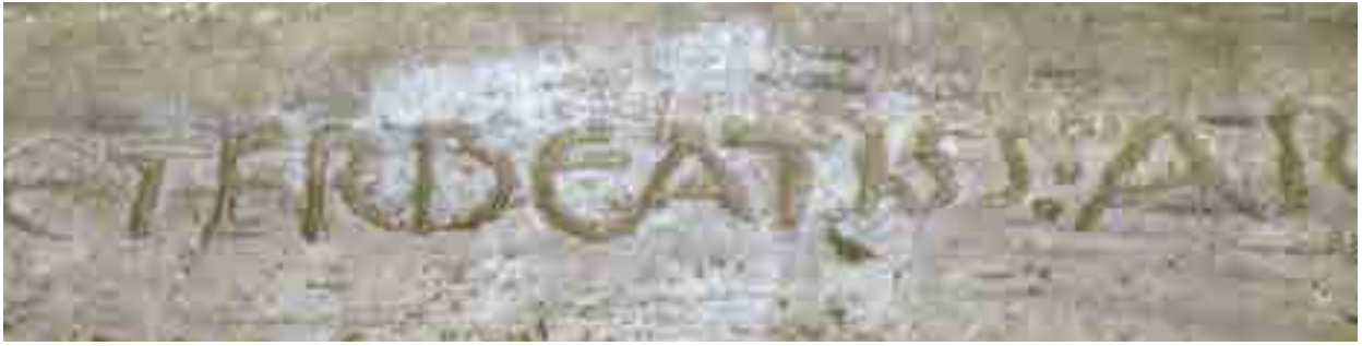
Fig. 5. Classe (Ravenna), Basilica di S. Apollinare, particolare della iscrizione sul sarcofago di Felice

bardi e convincerli ad abbandonare l'alleanza col pontefice, che decise di assumere una posizione di mediazione e convinse i Longobardi ad abbandonare Classe. Solo nel 729 il nuovo esarco Eutychio 61 riuscì ad entrare in Ravenna.