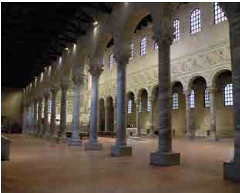
Fig. 1. Classe (Ravenna), Basilica di S. Apollinare, interno

quella proposta da Guillou sul finire degli anni '60 del Novecento. Qui viene ripresa con particolare riguardo per l'aspetto epigrafico nel contesto della produzione altomedievale ravennate.