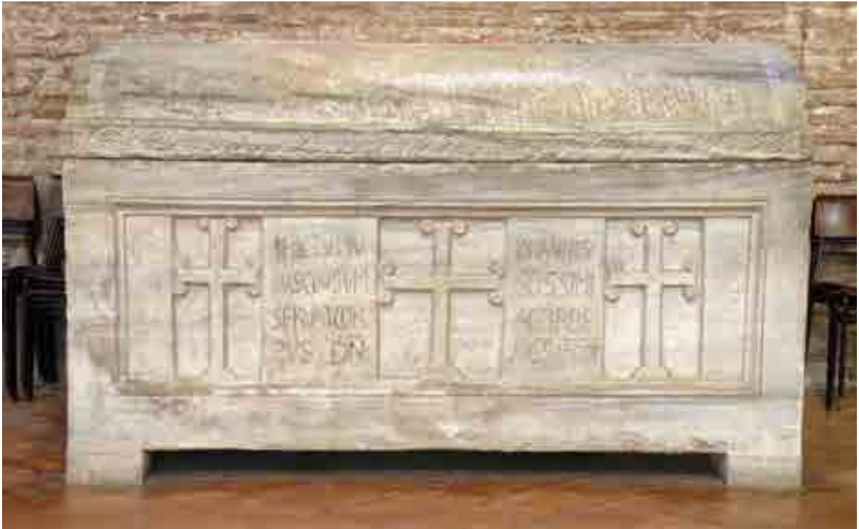
Fig. 4. Classe (Ravenna), Basilica di S. Apollinare, sarcofago di Giovanni

Poiché nella risistemazione settecentesca il pannello in oggetto fu collocato al di sopra di un sarcofago che l'epigrafe individua come di un Giovanni, negli ultimi due secoli gli studiosi hanno discusso spesso riguardo la possibilità di individuare il Giovanni dell'epigrafe nel Giovanni del sarcofago 58 . Le più recenti ricerche hanno chiarito tuttavia che il sarcofago è da riconoscere come la sepoltura dell'arcivescovo di nome Giovanni in carica dal 777 al 784 59 (Fig. 4).