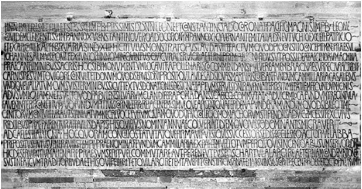
Fig. 2. Classe (Ravenna), Basilica di S. Apollinare, epigrafe

nate, fertile e fecondo; la legna da ardere e i porci che pascolino 45 le ghiande delle selve, dando alla Santa Chiesa (ravennate) luoghi scambiati in permuta: il fondo Trigintula situato nel territorio di Faenza, il fondo Pittulis nel territorio imolese e insieme 40 libbre di argento puro lasciategli (all'arcivescovo Giovanni) legittimamente dai genitori, a condizione che rimanga intatto e non sia mai revocato, perché non cessi la rendita a questo collegio di monaci con i cui redditi siano preparate le vivande cotte per coloro che annualmente abbiano celebrato la sua memoria 46 nel giorno in cui per volontà del Signore migrò ai regni celesti 47 . Alla presenza di questo Concilio stabilì e confermò che, se qualche successore della Sede o amministratore della chiesa o abate preposto a questo venerabile tempio avrà osato alienare permutare o concedere con carta di enfiteusi il sunnominato fondo Gamillaria o in parte o tutto, per qualsiasi idea pensi di alienarlo o permutarlo dall'usufrutto dei servi del Signore, o di affittarlo in enfiteusi, dovrà sostenere l'eterna condanna insieme con il traditore Giuda, e che colui che ha chiesto e colui che ha tentato di concedere (sia) stretto dai vincoli di anatema dei 318 Santi Padri.