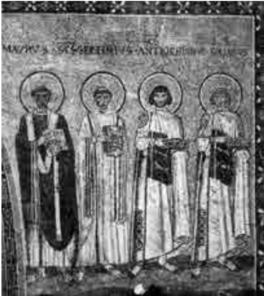
Fig. 3. Roma, battistero lateranense: particolare del mosaico a destra dell'arco santo