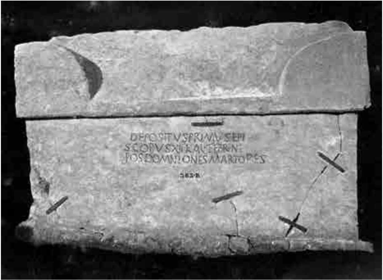
Fig. 4. Manastirine: sarcofago del vescovo Primus (da Lenzi 1913)

Viceversa la rivalutazione anche cronologica dei due frammenti epigrafici della mensa ormai detta “dei cinque martiri” ultimamente avanzata dal Duval e dal Marin indipendentemente dalle osservazioni martirologiche del Saxer riapre il discorso e sembra portare nuove conferme al culto dei martiri di Salona, quali sono raffigurati sul mosaico del Laterano e iscritti sui due frammenti della mensa. I loro nomi personali sarebbero ignorati dal Geronimiano forse per la scarsa risonanza del loro culto: ma se quei nomi, come pare, sono degni di fede, ad essi vanno aggiunti il diacono Settimio 25 e Anastasio fullo 26 recuperati per altra via dal Saxer.