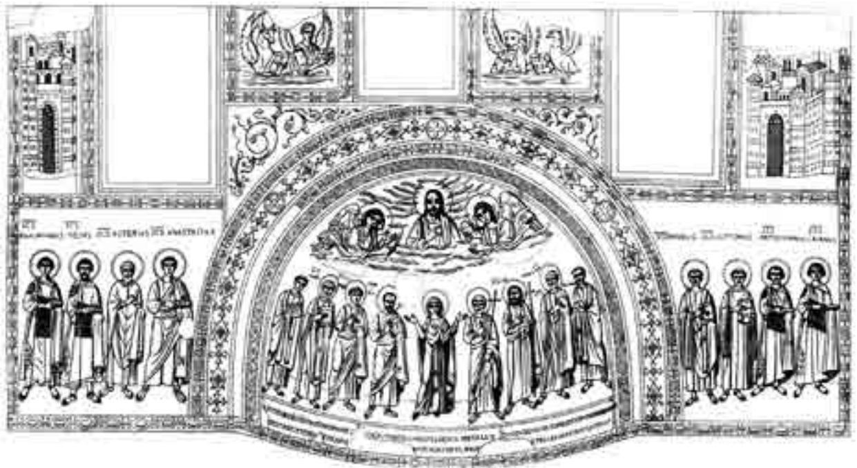
Fig. 1. Roma, battistero lateranense: decorazione musiva nell'oratorio di S. Venanzio con teofania tra figure di santi e di martiri dalmati e istriani (se. VII) (da Garrucci 1877)

gorosa critica storica e di confermare le presunte origini apostoliche delle due Chiese. Secondo questa tarda tradizione di Spalato, la città erede di Salona, la Chiesa dalmata collegherebbe la sua origine col principe degli Apostoli, rivaleggiando così con due grandi metropoli della regione adriatica, Aquileia e Ravenna, che rivendicavano entrambe origini petrine rispettivamente attraverso Marco e Apollinare, ritenuti discepoli di Pietro.