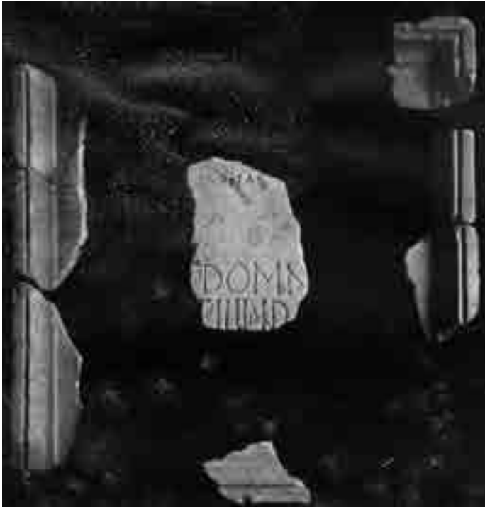
Fig. 5. Spalato, Museo Archeologico: mensa con l'iscrizione di Domnio (da Lenzi 1913)