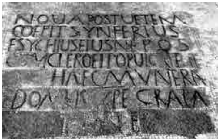
Fig. 8. Salona, basilica episcopale: epigrafe musiva dei vescovi Sinferio ed Esichio nell'ambulacro absidale (da Bulić 1903)

Dopo queste testimonianze e quella offerta dal mosaico lateranense del sec. VII, si abbandona il terreno solido dei documenti per avventurarsi nelle sabbie mobili in cui la storia si mescola alla leggenda, anche se non manca qualche testo come il primo canone del concilio di Spalato del 925, che ha o pretende di avere dei collegamenti storici precisi: Quoniam antiquitus beatus Domnius ab apostolo Petro predicare Salonam missus est constituitque ut ipsa ecclesia et civitas, ubi