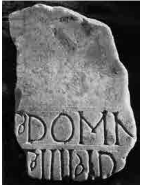
Fig. 5a. Spalato, Museo Archeologico: particolare della mensa di Domnio (da Lenzi 1913)

Provengono da lì infatti un sarcofago del sec. IV e un frammento di mensa funeraria iscritta riferibile al sec. IV-V, dove figura il nome di Domnio. Il sarcofago appartiene al vescovo Primo, nipote di Domnio, sepolto il 21 gennaio secondo quanto indica la formula obituaria dell'epitafio: depositus Primus episcopus XII kal(endas) febr(uarias), ne/pos Domniones martores 30 (Fig. 4); l'anno potrebbe essere il 325. L'iscrizione sulla mensa è mutila, ma presenta sufficienti elementi per assicurare l'identità di Domnio e la data della morte o deposizione al 10 aprile: [d(e)p(osi)]t(us) Domn[io/ ep(iscopus)] / [mar]t(yr) IIII id(us) [apriles] 31 (Figg. 5-5a).