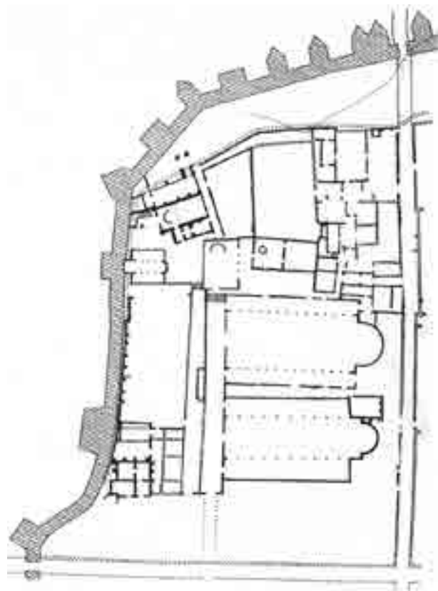
Fig. 7. Le prime basiliche del complesso episcopale di Salona (sec. IV) (da Marasović 1998)

to 32 (Fig. 7); ne dà testimonianza infatti l'iscrizione musiva nel presbiterio della basilica che suggerisce la cronologia di questa seconda fase (Fig. 8): nova post vetera / coepit Synferius; / Esychius eius nepos / c[u]m clero et populo [fe]cit. / haec munera / domus Chr(ist)e grata / tene 33 . Esichio, contemporaneo di papa Zosimo e di sant'Agostino (che ne ricorda la sua missione religiosa) 34 , resse la chiesa di Salona dal 404 al 426: il compimento dei munera domus si pone dunque nel primo decennio del secolo V. La formula post vetera pare riferirsi ai resti di una o due precedenti fasi costruttive del sec. IV non meglio definibili, venute in luce sotto l'impianto del V 35 . Col tempo la Chiesa salonitana ebbe modo di