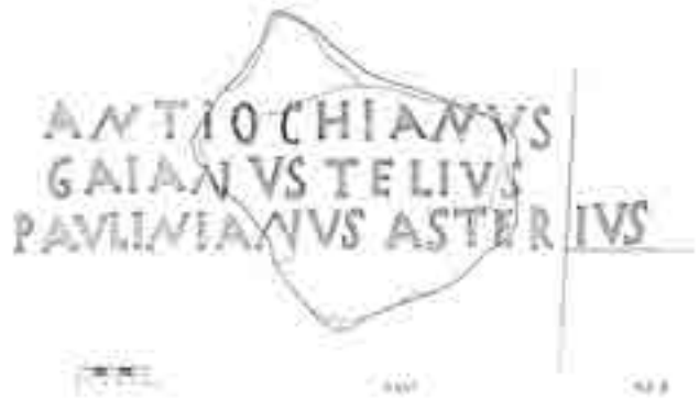
Fig. 3a. Risarcimento dell'iscrizione sulla mensa "dei cinque martiri" (da Duval, Marin 1992, p. 294, fig. 7)

da come il mosaico del Laterano. Egli pertanto respingeva la linea interpretativa del Delehaye e di quanti consideravano il mosaico del Laterano, sia sotto il profilo epigrafico che iconografico, una fonte autentica e non troublée dell'agiografia salonitana, come quella che ci consegna i santi della Dalmazia e dell'Istria distinti dai rispettivi nomi e raffigurati con abiti indicativi del ruolo e della dignità di ciascuno indipendentemente dal discusso latercolo del Geronimiano: in effetti Paulinianus , Telius , Antiochianus e Gaianus vestono tunica e clamide come principi o soldati, mentre Asterius indossa la casula in quanto prete. 20 Pertanto, dopo un'analisi critica delle fonti martirologiche ed epigrafiche, il Saxer riteneva di dover considerare martiri autentici di Salona il vescovo Domnio 21 , il diacono Septimio 22 , Anastasio fullo (lavandaio o tintore), forse di Aquileia annesso a Salona 23 , e Asterio, ignorato dal Geronimiano ma assicurato, oltre che dal mosaico del Laterano, dall'iscrizione votiva scoperta nel 1922 sul mosaico pavimentale della basilica di Kapliuč: [ oct ]avo k(al---) /um vot/um fecit ad ma/rtyrem Asterium 24 .