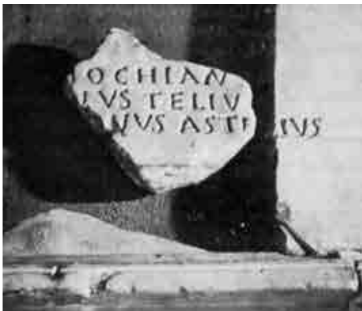
Fig. 2. Spalato, Museo Archeologico: la mensa “dei cinque martiri”, particolare con l'accostamento dei due frammenti (da Duval, Marin 1992, p. 3a)

(Fig. 2). Qui infatti sono incisi con caratteri simili i nomi mutili dei cinque martiri salonitani che i due studiosi, anche con laboriosi riferimenti al contesto archeologico, hanno creduto di poter risarcire nel modo seguente: [Ant]iochian[us / Gaia]nus, Teliu/[s / Paulinia]nus, Aste[r]ius; ciò è stato possibile sulla scorta delle rispettive scritte che individuano le loro figure sul ricordato mosaico del Laterano: Antiochianus e Gaianus a destra dell'arco santo (Fig. 3), Telius, Paulinianus e Asterius a sinistra 17 . Perciò le ultime tre lettere [---]IVS del nome inciso sulla mensa sarebbero da riferire ad Asterius e non al supposto Venantius, la cui enigmatica personalità viene a perdere così un appoggio archeologico di alta epoca, qual è appunto la mensa in questione (sec. IV-V) 18 (Fig. 3a).