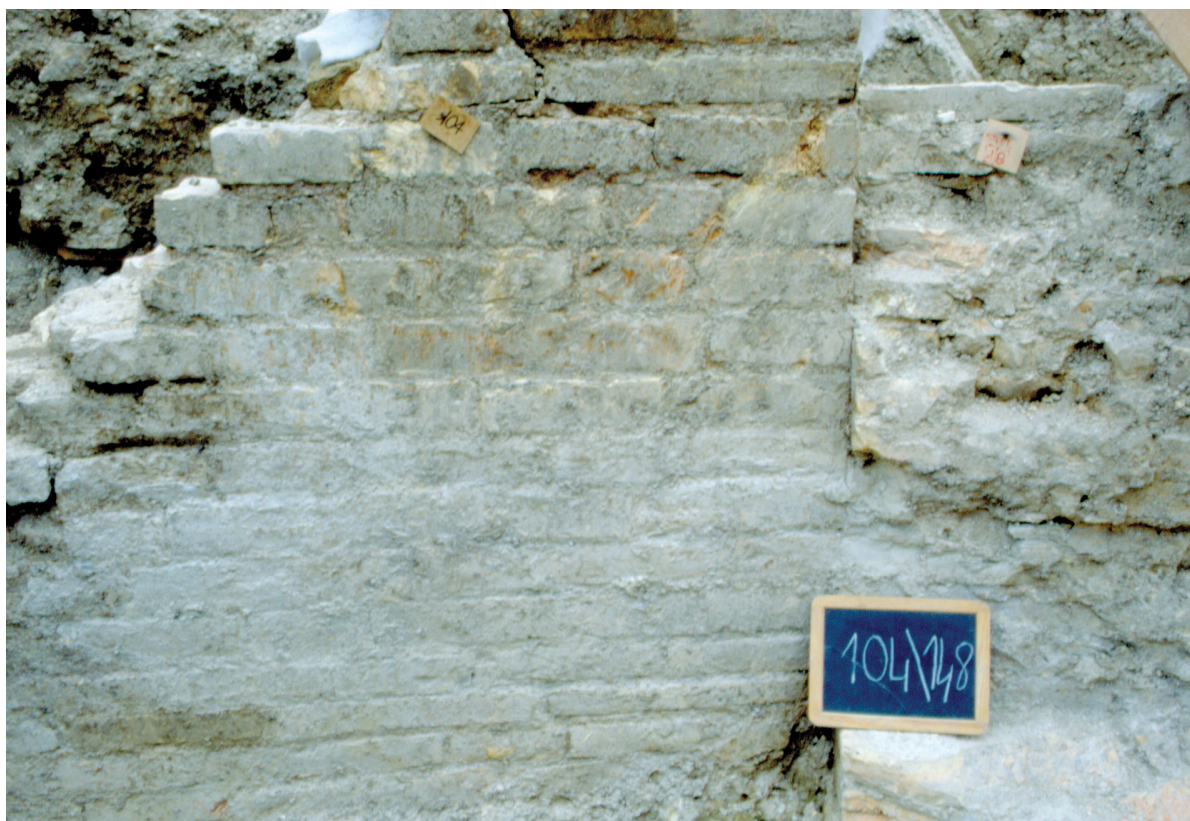
FIGURE 6 Remains of port buildings, e.g. storage spaces, Piazza Dante Alighieri (Soprintendenza Beni Archeologici Marche, 1999; DIA 293678)