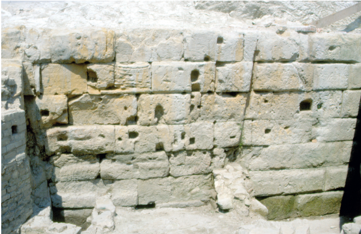
FIGURE 5 Remains of the quay dating from the Augustan period at Lungomare Vanvitelli (Soprintendenza Beni Archeologici Marche, 1999; DIA 284525)

SLIKA 5. Ostaci gata datirani u Augustovo doba na položaju Lungomare Vanvitelli (Soprintendenza Beni Archeologici Marche, 1999; DIA 284525)