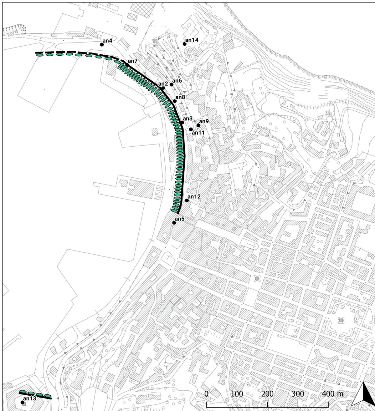
FIGURE 7 Harbour basin capacity, considering medium-sized ships, e.g. 150 tons (F. UGOLINI, 2018)

SLIKA 7. Kapacitet lučkog bazena na temelju brodova srednje veličine, primjerice 150 tona (F. UGOLINI, 2018)