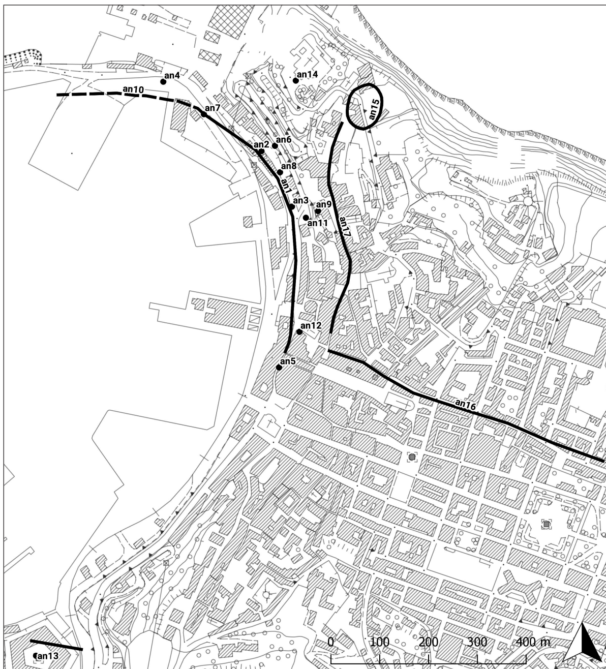
FIGURE 4 Archaeological map of the harbour sector at Ancona (F. UGOLINI, 2018)

SLIKA 4. Arheološki karta područja luke Ancone (F. UGOLINI, 2018)