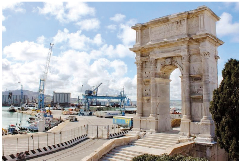
FIGURE 2 Arch of Trajan at Ancona. See also the inscription CIL IX, 5894 and mole area (after F. UGOLINI, 2017, 492, Fig. 2.50b)

reljefa na Trajanovu stupu (v. scenu LXXIX). 23 U pisanim izvorima iz tog razdoblja nigdje se izrijeком ne spominje povezanost između obnove luke Ancone i cara. Luka Ancona spominje se i u kasnoantičkim izvorima. Prokopije spominje Gajzerikov plan da ponovno uspostavi kontrolu nad lukom zbog njezine središnje uloge. 24 Također ističe kako su za vrijeme gotskih ratova Bizantinci Anconu još uvijek smatrali važnom trgovačkom i strateškom lukom. 25