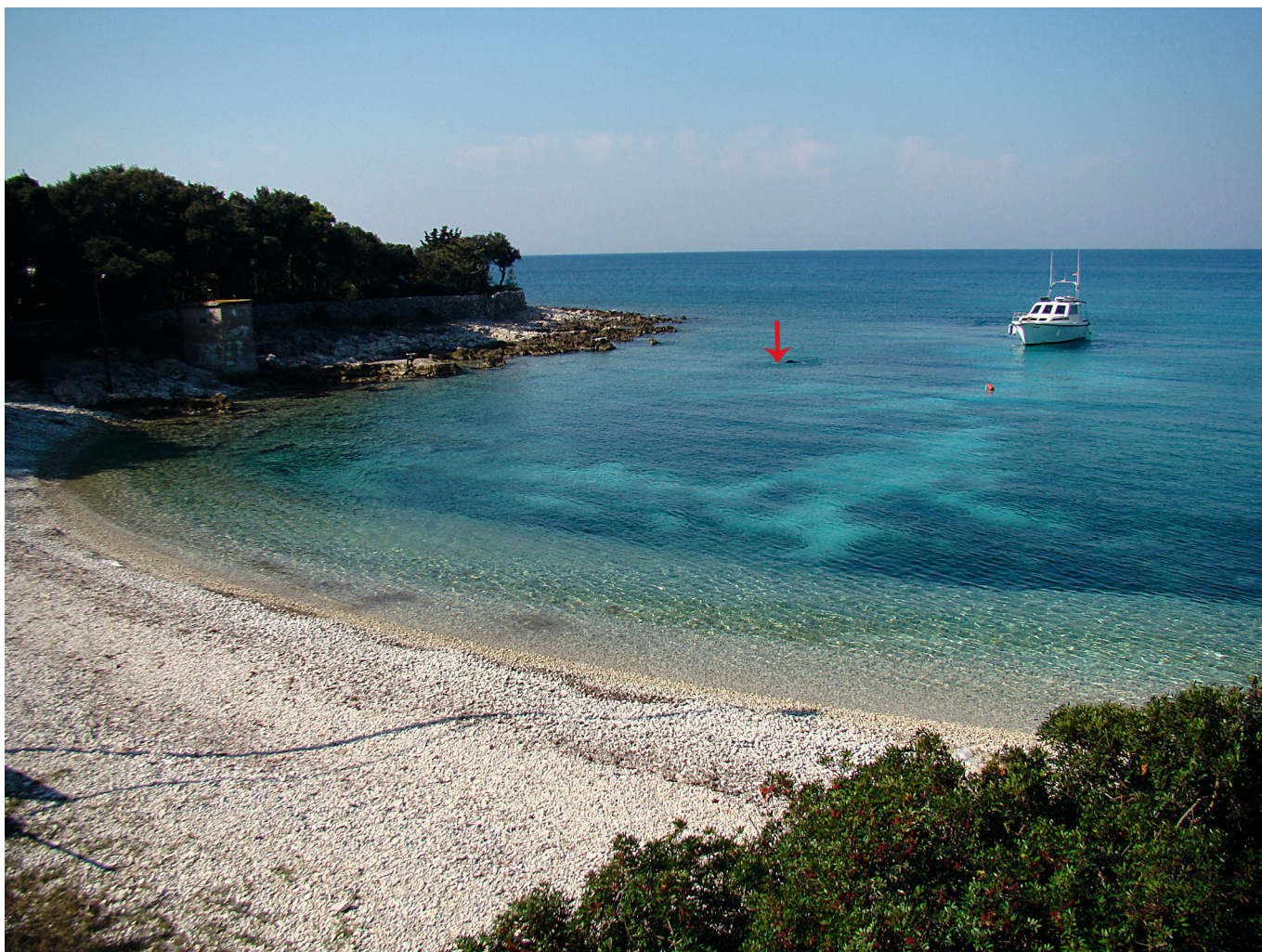
SL. 6. / FIG. 6.

Uvala Pocukmarak s označenim položajem lokaliteta.