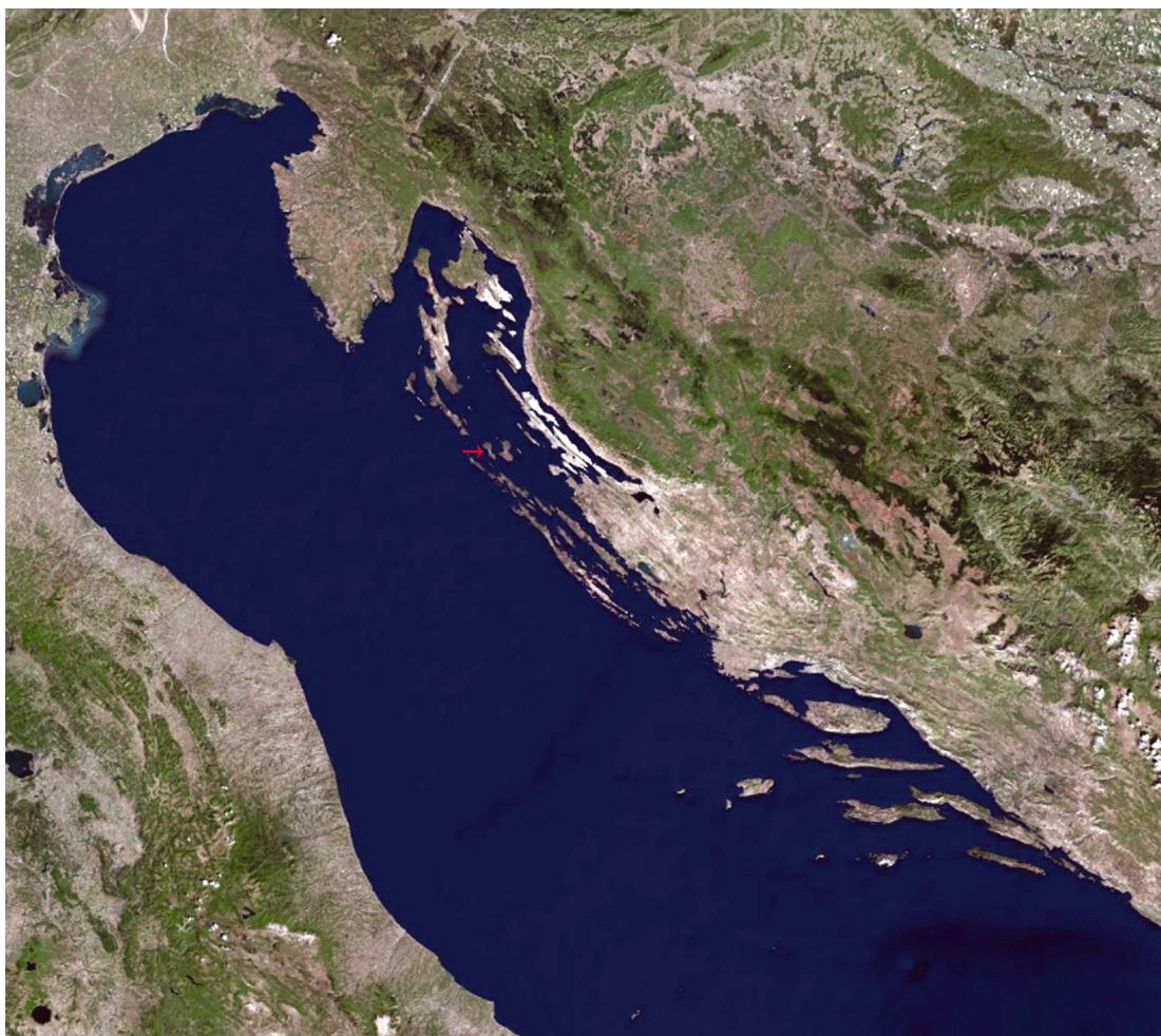
SL. 2. / FIG. 2. Smještaj otoka Silbe. Position of the island of Silba.