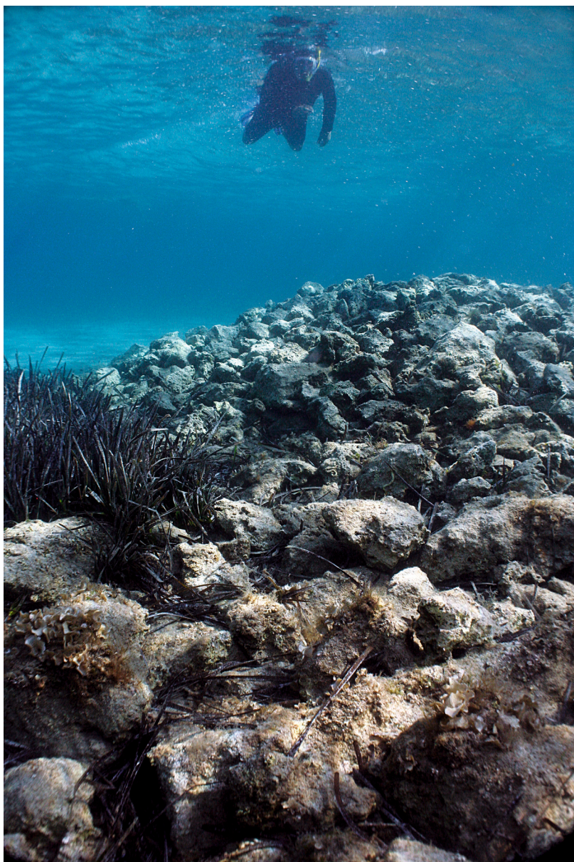
Sl. 8. / FIG. 8.

Zdenko Brusić u obilasku lokaliteta prije prvih istraživanja.