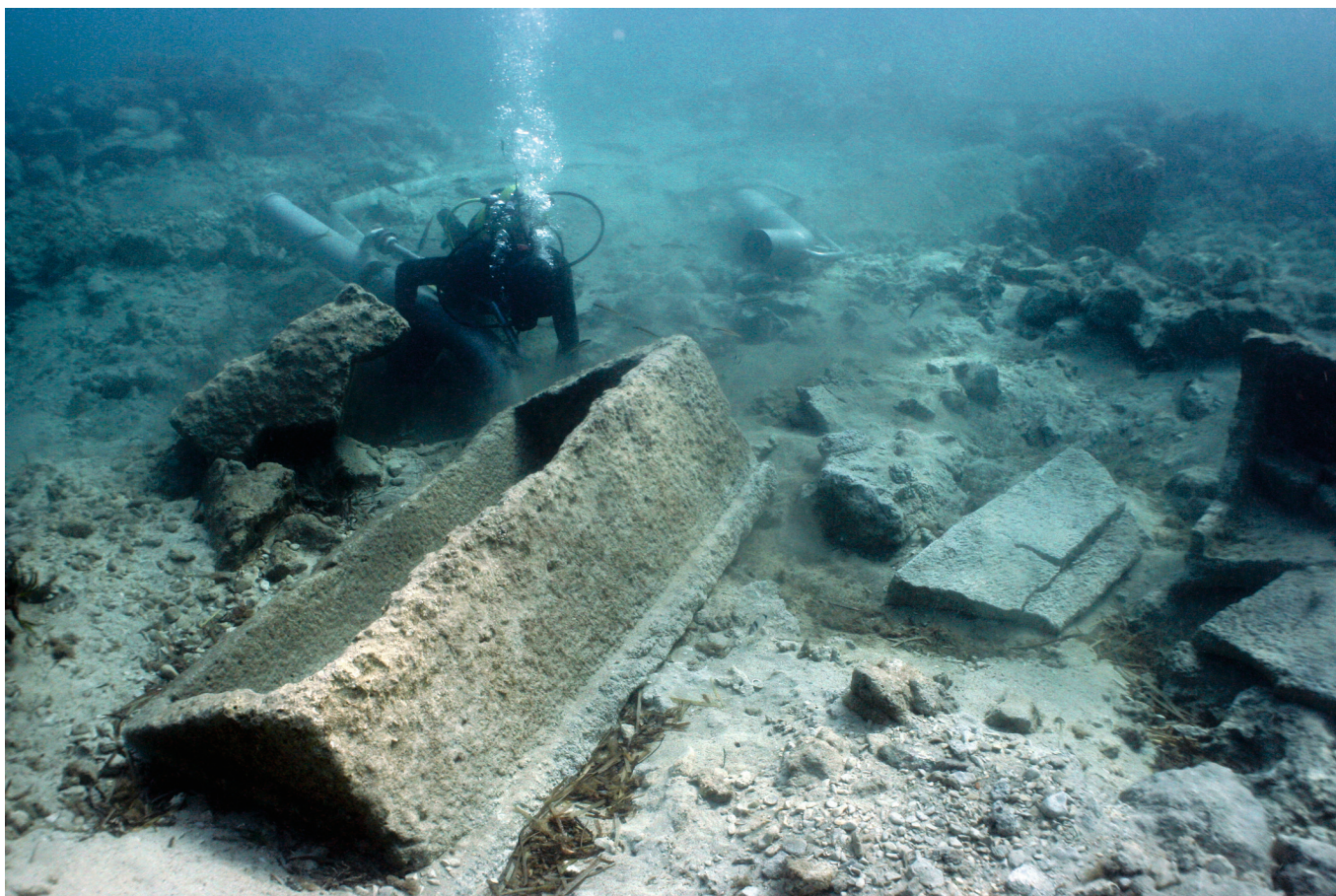
Sl. 7. / FIG. 7.

Spoliji sarkofaga na nalazištu.