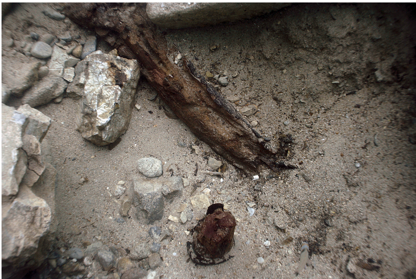
SL. 9. / FIG. 9.

Drvena greda i pylon zabijen u morsko dno.