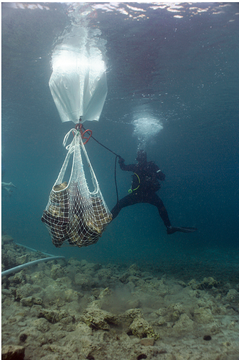
SL. 5. / FIG. 5.

Prenošenje kamena tijekom arheoloških istraživanja (foto: M. Parica).