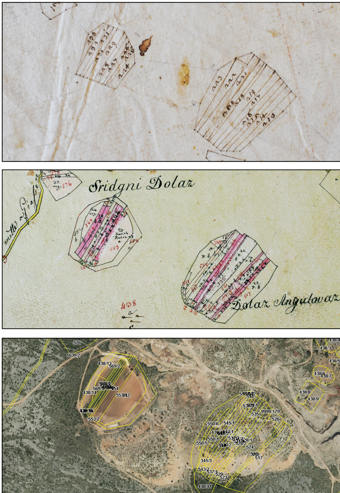
SLIKA 2. Sridnji dolac i Anzulovac u Jasenicama na katastarskim kartama od početka 18. do 20. stoljeća

FIGURE 2 Sridnji dolac and Anzulovac in Jasenice on cadastral maps dating to the period from the beginning of the 18th to the 20th century