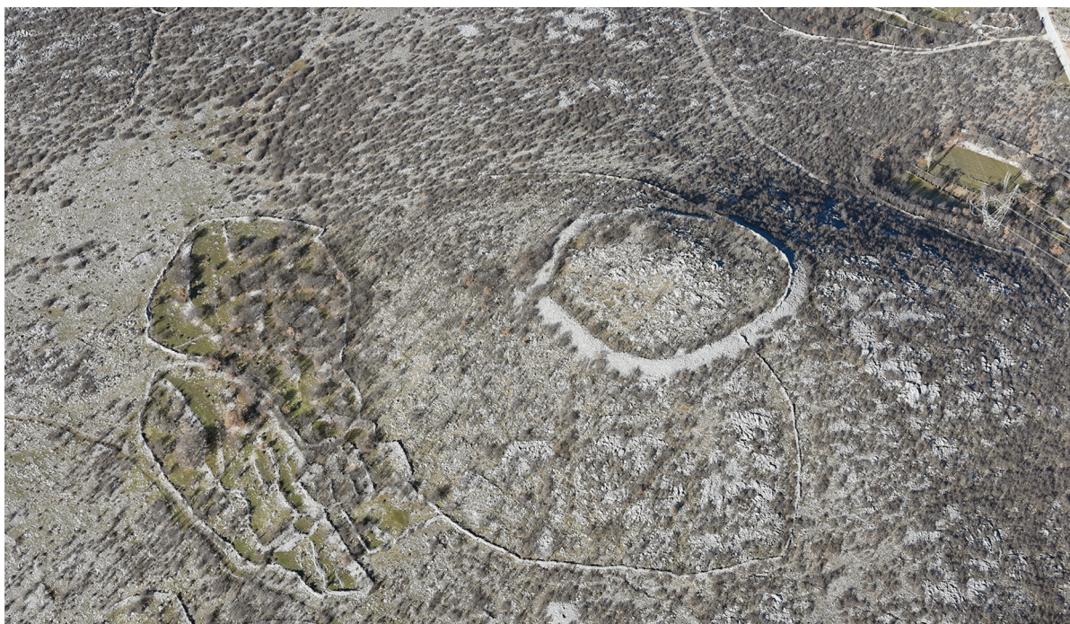
SLIKA 4. Gradina Veselinovića u Golubiću i napušteni zaseok u jugozapadnom podnožju FIGURE 4 Gradina Veselinovića (hillfort) in Golubić and deserted hamlet at its southwestern foot

kroz koju se promatraju navedeni problemi polazi od činjenice da je krajolik prije svega življeni prostor, a ne romantična projekcija u prošlost. Stoga je i polazna točka za definiranje tipova aktivnosti odnosno povijesnih karakternih tipova upravo to kako se krajolik rabi danas te koje su sve prostorne prakse u prošlosti imale utjecaja na njegovu današnju upotrebu. Kriterij definiranja karakternih tipova je analiza materijalnih praksi koje se odvijaju danas i integracija povijesnih materijalnih praksi u suvremene krajolike. Budući da je projekt još uvijek uvelike u svojim začetcima, na ovom mjestu moguće je definirati neke osnovne obrasce korištenja krajolika na području istraživanja tijekom povijesti. Na području istraživanja se jasno ističe pet povijesnih karakternih tipova: ograđeni krajolik, industrijsko-rudarski krajolik, naselja, prapovijesni krajolik i vojni krajolik.