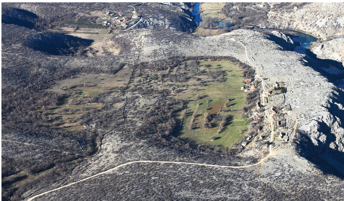
SLIKA 6. Zaselak Dramotić u Bilišanima FIGURE 6 Dramotić hamlet in Bilišane

ograda. Većina ih je izgrađena tijekom 18. i 19. stoljeća, što je potvrđeno proučavanjem arhivske kartografske građe, posebno usporedbom mletačkih katastarskih karata iz 1709. godine i austrijskih katastarskih karata iz 20-ih godina 19. stoljeća (Sl. 2). Iz srednjovjekovnih dokumenata doznajemo da su neke poljoprivredne parcele na području sjeverne Dalmacije već u tom razdoblju bile ograđene suhozidima, dok popisi iz osmanskog razdoblja spominju i ograđena šumska područja. 9 Empirijski podatci prikupljeni terenskim istraživanjima provedenim u sklopu projekta također podupiru tezu da većina suhozidnih ograda potječe iz novovjekovnog razdoblja, što se odnosi na danas vidljive suhozidne konstrukcije. Proces čišćenja zemljišta započeo je već u prapovijesti. Slučajeve kontinuiranog čišćenja i ograđivanja istog zemljišta od prapovijesti do modernog doba nije moguće pouzdano utvrditi jer se u takvim slučajevima kamen sukcesivno slagao na ista mjesta.