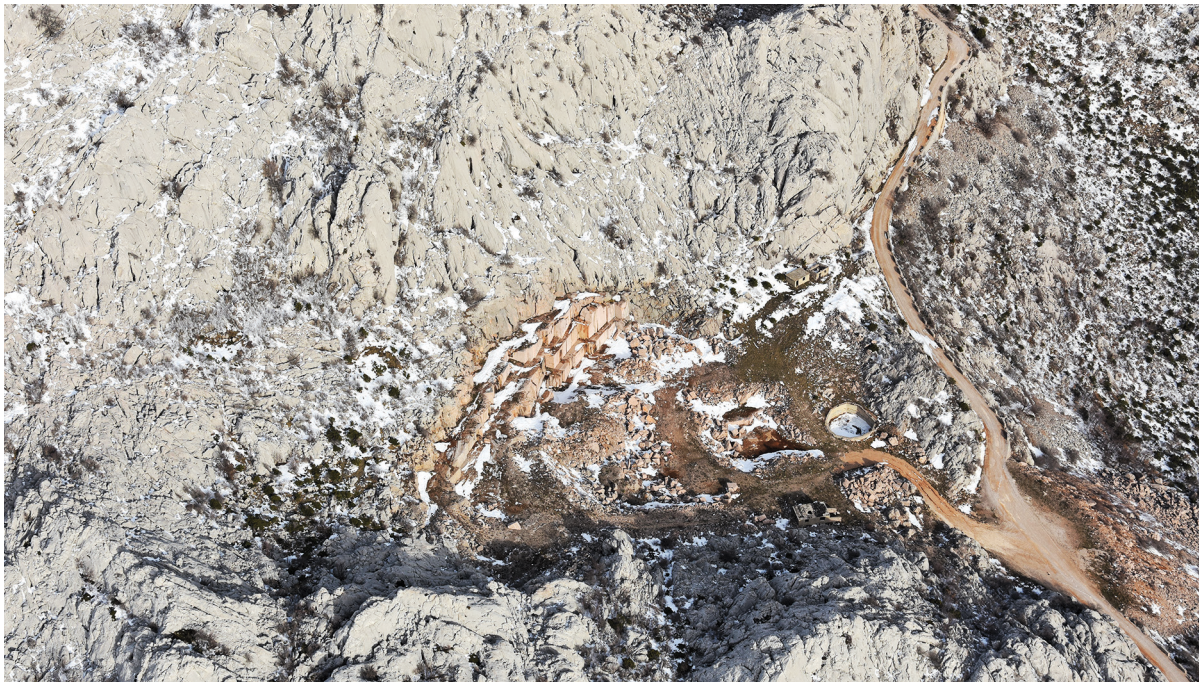
SLIKA 9. Recentni kamenolom na Velebitu

Development of tourism in the areas of the Karin and Novigrad Seas and the Velebit Channel in the second half of the 20th century brought a new type of settlement – tourist villages inhabited only in summer months. Several such settlements were built in the regions