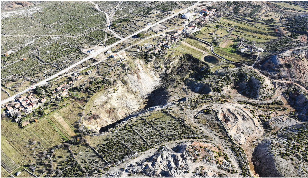
SLIKA 8. Središte sela Jasenice devastirano rudokopima boksita iz 20. stoljeća

FIGURE 8 Center of the village of Jasenice devastated by the 20th century bauxite mining