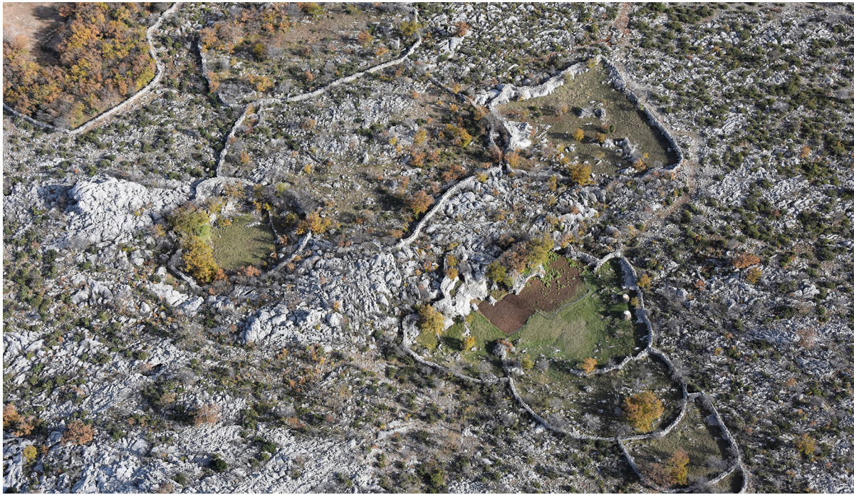
SLIKA 5. Suhozidne ograde kod zaseoka Zelenikovac u Jasenicama