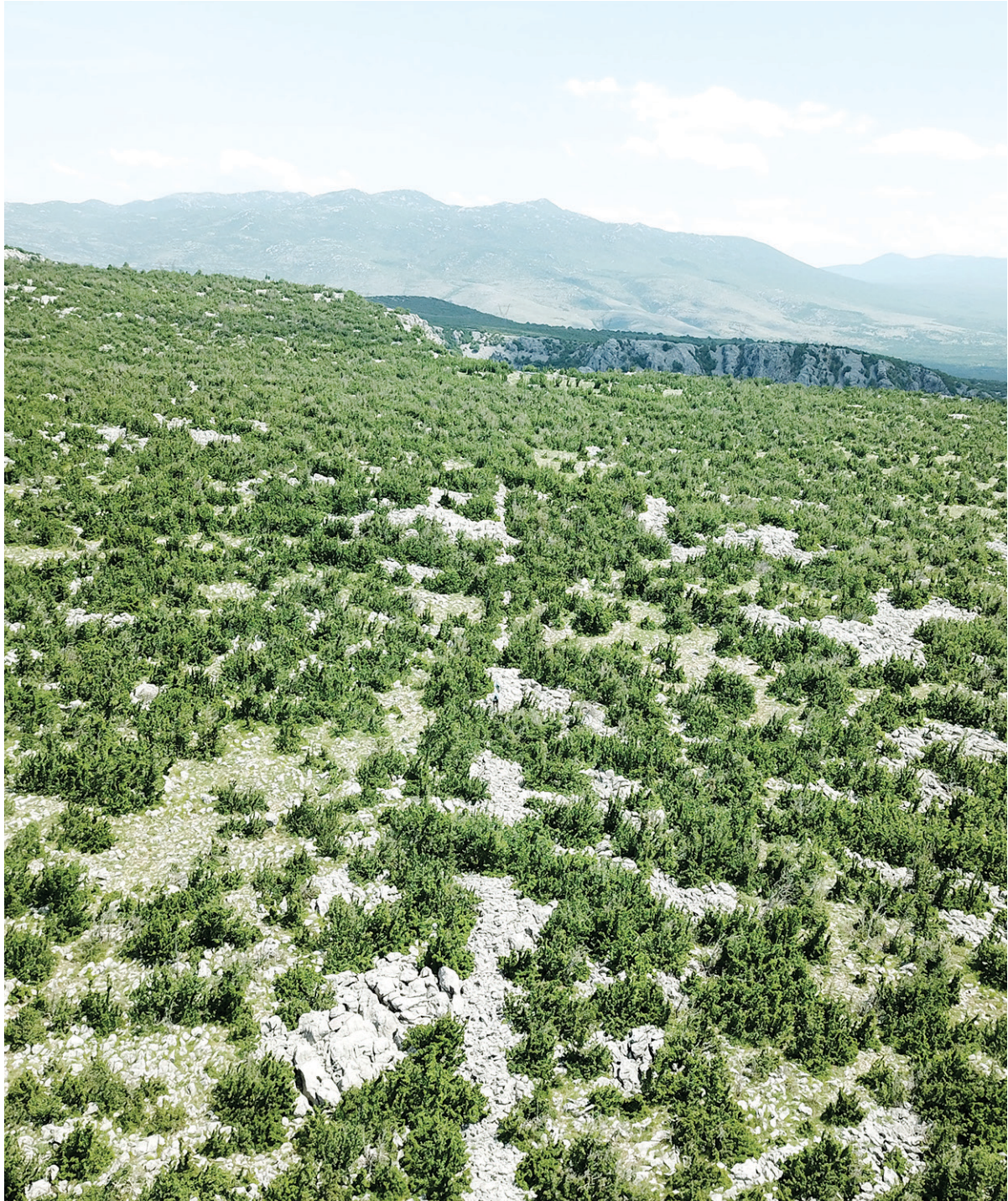
SLIKA 1. Rimski međašni zid u Golubiću – pogled s tla