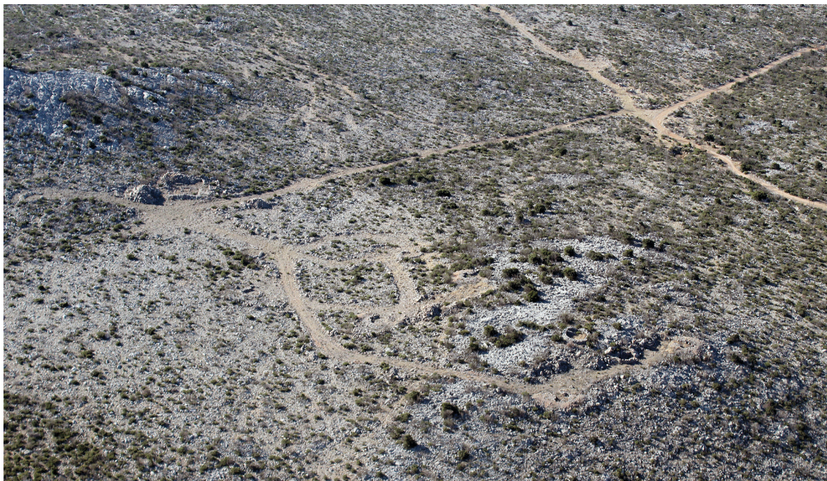
SLIKA 7. Ostatci vojne infrastrukture iz Domovinskog rata (Jasenice)