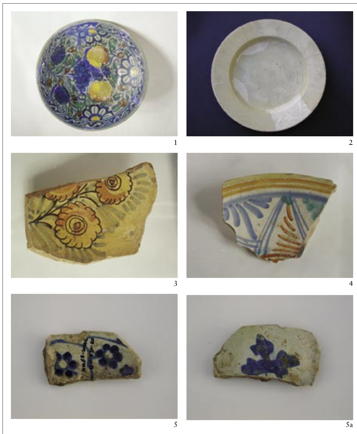
T. IV. Majolika: berettina 1, bianco su bianco 2, compendiaria 3, kasna 4; španjolska ili hispano-maurska 5-5a. Pl. IV. Majolika: berettina 1; bianco su bianco 2; compendiaria 3; late 4; Spanish or Hispano-Moorish 5-5a.