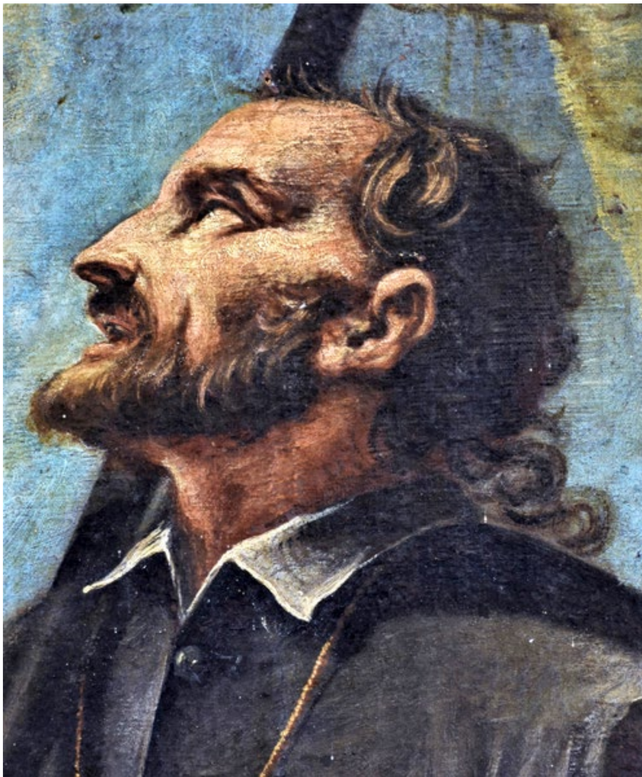
12. Giovanni Battista Augusti Pitteri, Bogorodica s Djetetom i svecem , Majka Božja od Porta, Bakar, detalj