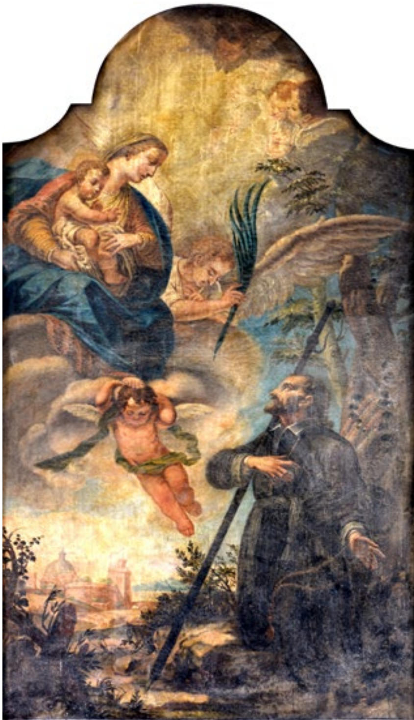
11. Giovanni Battista Augusti Pitteri, Bogorodica s Djetetom i svecem , Majka Božja od Porta, Bakar

imenjaku i zaštitniku na obiteljskom je imanju, tada pod Koparskom biskupijom, dao sagraditi trogirski biskup Jeronim Fonda 1746. godine. Taj je pothvat prelat ovjekovječio svojim grbom te posvetnim natpisom na pročelju (sl. 10). 57 Jeronim Fonda (Piran, 1686. – Trogir, 1754.) školovao se u Padovi, a 1709. zaređen je za svećenika Koparske biskupije. Postao je arhiđakon pulskog kaptola, a 1733. imenovan je ninskim biskupom sve do 1738. godine, kada je premješten na čelo Trogirske