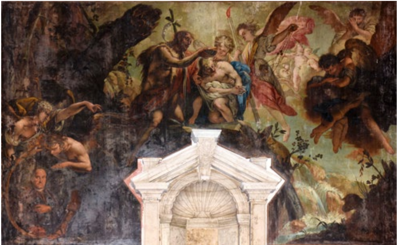
5. Giovanni Battista Augusti Pitteri, Krštenje Kristovo , San Martino, Burano

Giovanni Battista Augusti Pitteri, The Baptism of Christ , San Martino, Burano