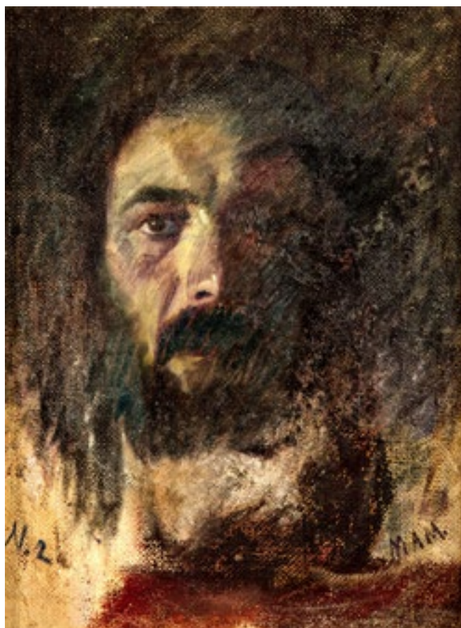
8. Glava Krista , oko 1925., ulje na platnu, 47,6 x 31,6 cm, Narodni muzej u Beogradu, inv. br. 032_1953)

Head of Christ , ca. 1925, oil on canvas, 47.6 x 31.6 cm, National Museum in Belgrade, inv. no. 032_1953