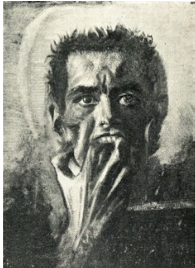
4. Meduza , 1910., ulje na platnu, 79 x 60,6 cm, Narodni muzej u Beogradu, inv. br. 032_1945

Medusa , 1910, oil on canvas, 79 x 60.6 cm