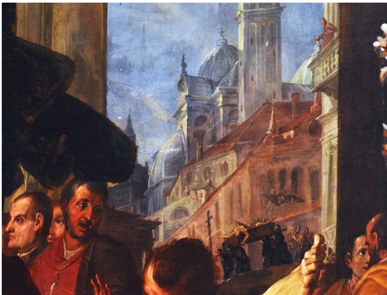
15. Antonio Bellucci, začelni dio šibenske katedrale Svetog Jakova na slici Zavjet dužda Nicolò Contarinija blaženom Lorenzu Giustinianiju u crkvi San Pietro di Castello u Veneciji

Antonio Bellucci, rear part of the Šibenik Cathedral of St James in the painting Doge Nicolò Contarini's Vow to Blessed Lorenzo Giustiniani in the church of San Pietro di Castello in Venice