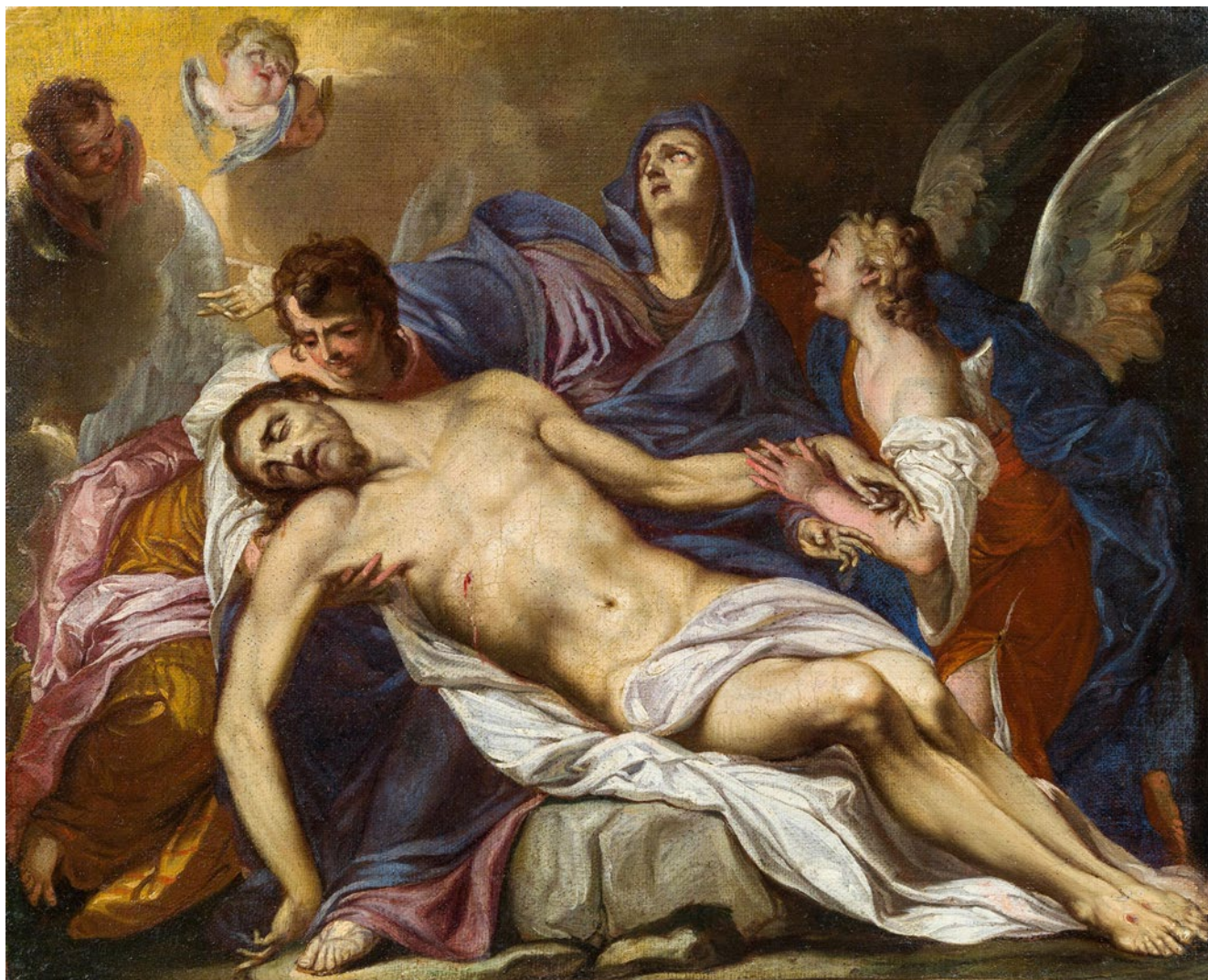
17. Antonio Bellucci, Pietà , privatna zbirka (izvor: Im Kinsky /bilj. 55/)

Antonio Bellucci, Pietà , private collection