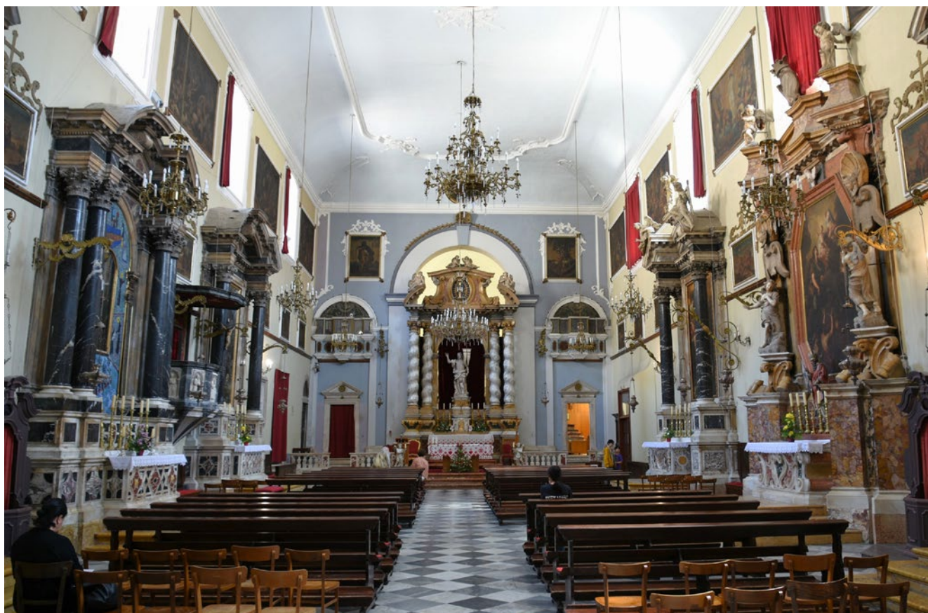
1. Unutrašnjost franjevačke crkve Male braće u Dubrovniku

Interior of the Franciscan church of the Friars Minor in Dubrovnik