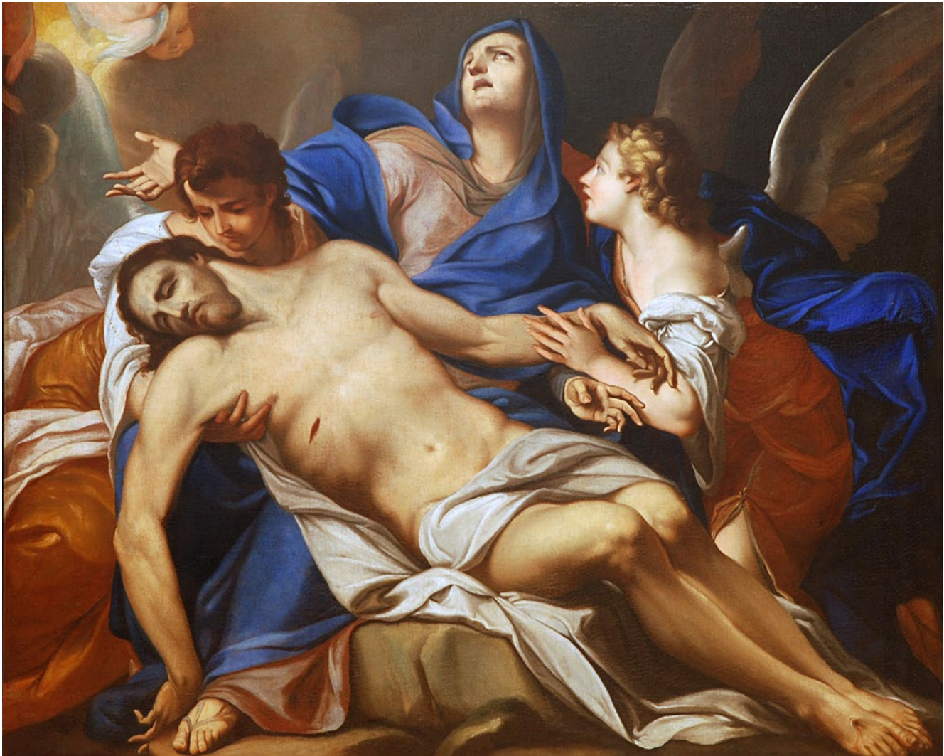
16. Antonio Bellucci, Pietà , Narodna galerija u Ljubljani (izvor: MATEJ KLEMENČIČ, ENRICO LUCCHESI, FERDINAND ŠERBELJ /bilj. 53/, 130)

Antonio Bellucci, Pietà , National Gallery in Ljubljana