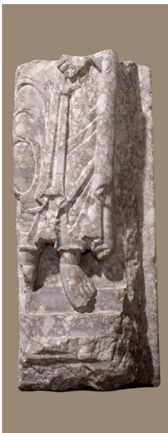
11. Stalna izložba crkvene umjetnosti u Zadru: romanički reljef s likom nepoznatoga svetca na ulomku pluteja s ambona iz katedrale u Zadru

Permanent Exhibition of Religious Art in Zadar: Romanesque relief depicting an unidentified saint on a fragment of a pulpit parapet from the Zadar Cathedral