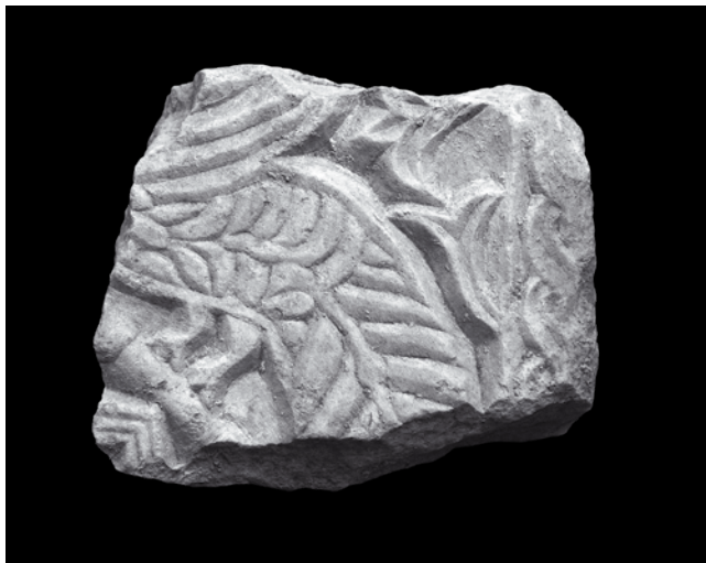
9. Ulomak arkada ciborija, Kotor, Lapidarij Sv. Mihajla Fragment of the ciborium arcade, lapidarium of St Michael's church in Kotor

sinusoidne vitice s krupnim trolisnim cvjetovima. Voluminozno i zaobljeno modelirana stabljika, bez uobičajene troprute podjele, podsjeća na langobardske reljefe 8. stoljeća ukazujući na početnu fazu u razvoju predro-