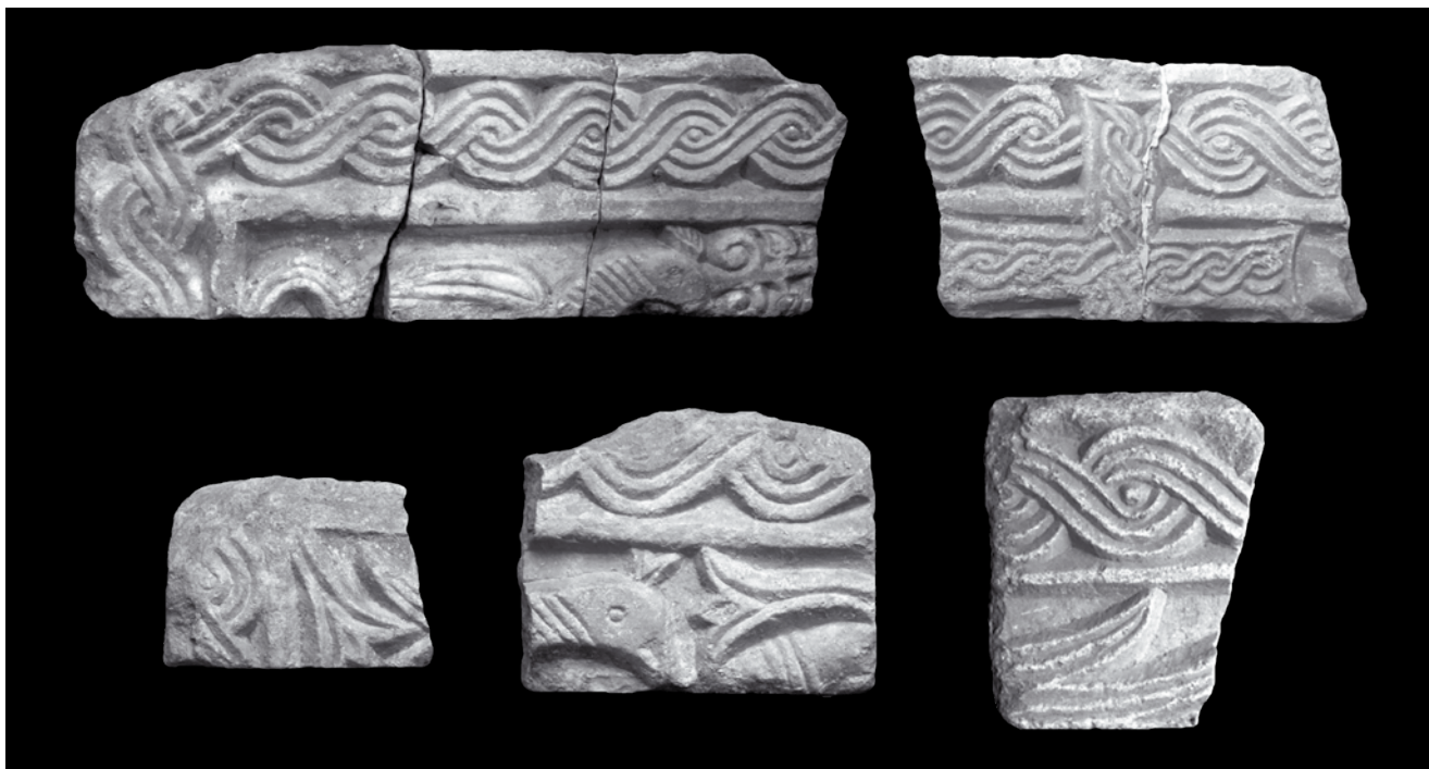
5. Ulomci arkada četverostranog ciborija iz Sv. Marije Collegiate, Kotor, Lapidarij Sv. Mihajla i depo katedrale Sv. Tripuna Fragments of arcades at the four-sided ciborium from St Mary Collegiate in Kotor, lapidarium of St Michael's church and the cathedral depot

da je dotični arhitrav istovremen prethodnim natpisima sa spomenom biskupa Ivana, a time posredno i na realnu mogućnost da se radi o istoj osobi.