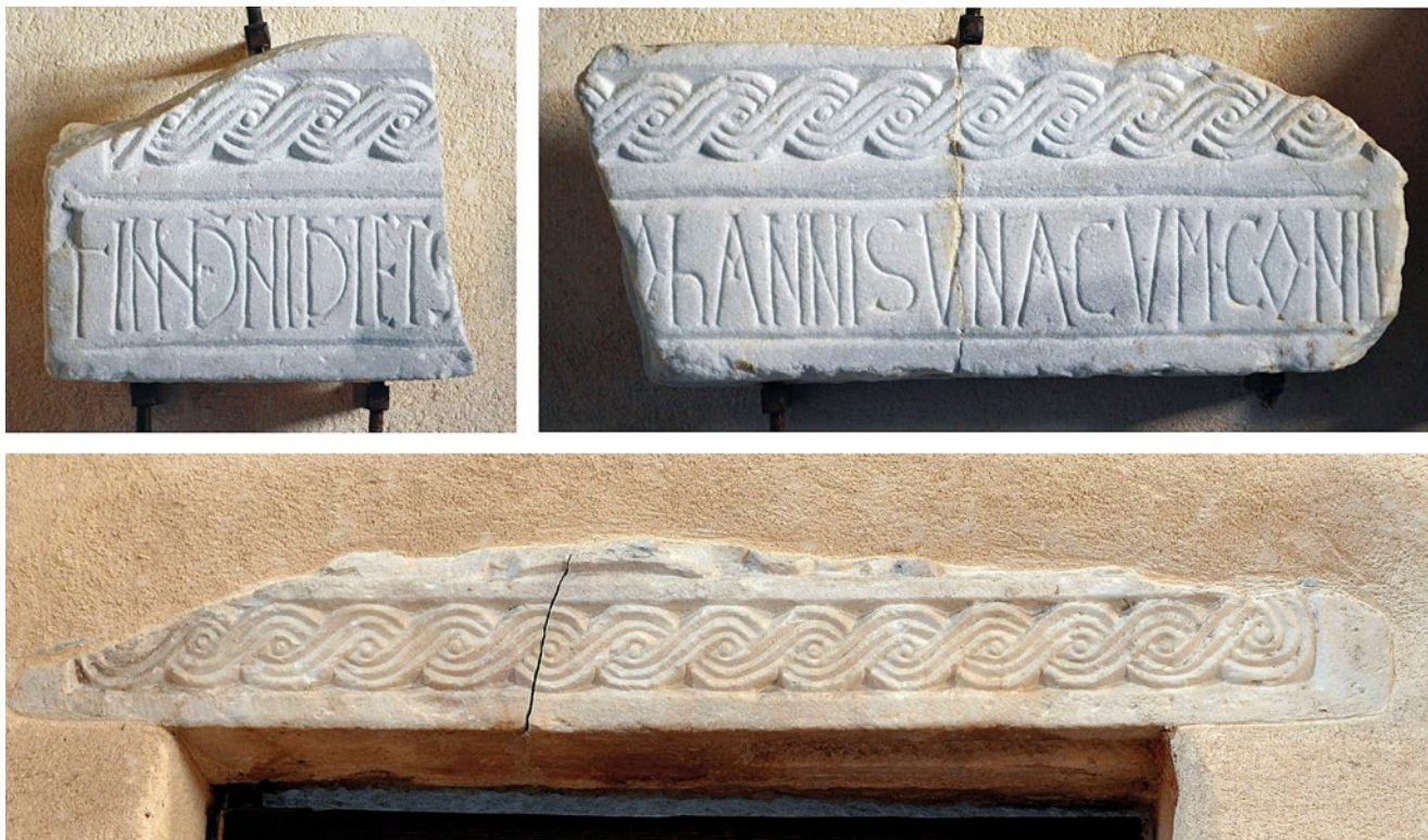
4. Ulomci arhitrava sa spomenom Ivana te spolirani nadvratnik iznad vrata sakristije, Kotor, Sv. Marija Collegiata

sigurnošću utvrditi, valja konstatirati da se ime, ovaj put navedeno u nominativu zajedno sa suprugom – dakle u svojstvu donatora oltarne ograde ili određenih radova na crkvi, ovdje javlja u punom obliku, i to kao Iohannis umjesto Iohannes , što svjedoči o određenom stupnju vulgarnog latiniteta prisutnog u Dalmaciji još od kasne antike. 19 Isti oblik imena javlja se i na sarkofagu Ivana Ravenjanina, pripisanom upravo onom splitskom biskupu koji je sa svojim kotorskim imenjekom 787. boravio u Niceji. 20 Sva navedena zapažanja upućuju na zaključak