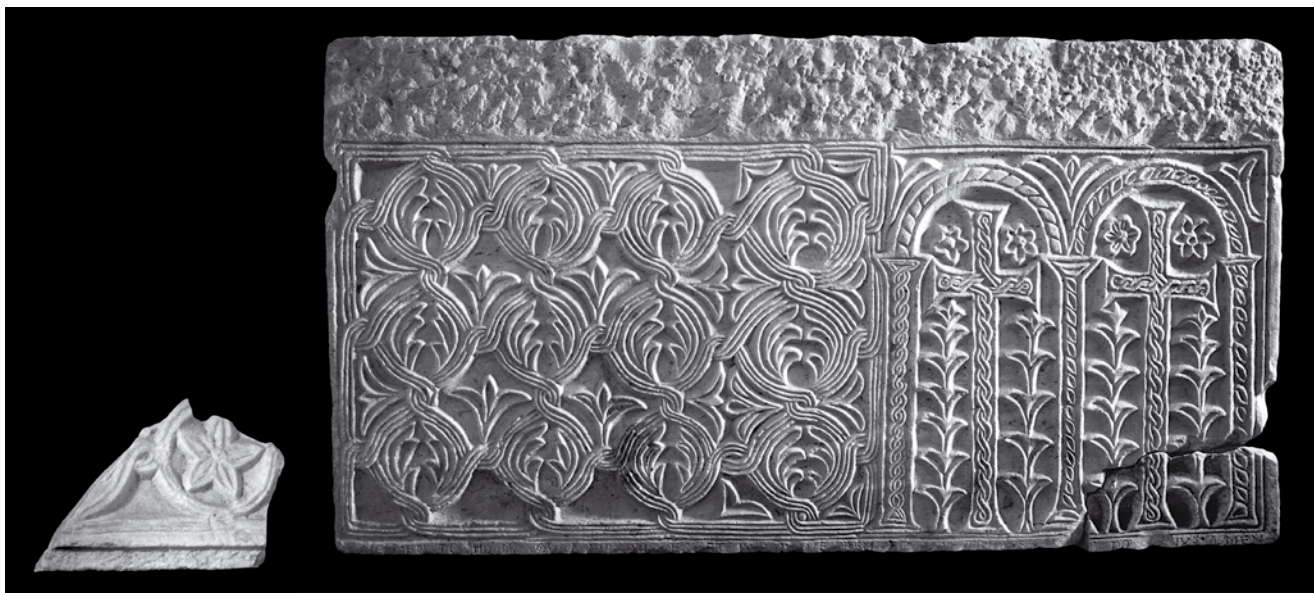
14. Fragment mramornog pluteja, Kotor, Lapidarij Sv. Mihajla; veliki plutej iz memorije Sv. Tripuna (?), Kotor, depo katedrale

Fragment of a marble pluteus, lapidarium of St Michael's church in Kotor; large pluteus from the shrine of St Tryphon (?), cathedral depot, Kotor