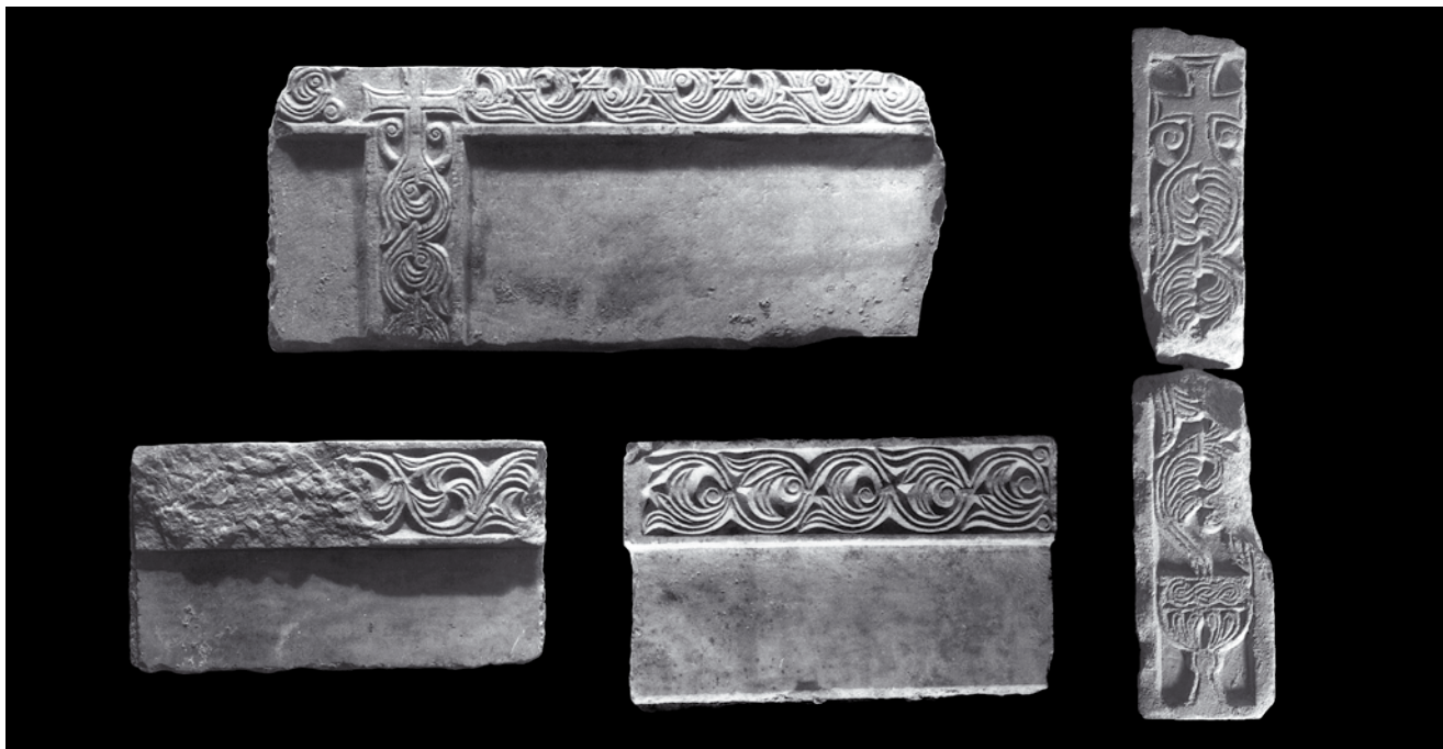
10. Pluteji i pilastar pronađeni u katedrali Sv. Tripuna, Kotor, depo katedrale (foto: S. Cvetić, S. Kordić) Plutei and a pilaster from the cathedral of St Tryphon, cathedral depot, Kotor

Zadržavajući se na materijalu pronađenom u katedrali Sv. Tripuna, takvim su motivima ukrašeni reljefno istaknuti vijenci velikih mramornih pluteja s neuobičajeno praznim središnjim plohamama (sl. 10). 33 Sudeći po njihovoj izrazitoj monumentalnosti i pozamašnim dimenzijama, bez sumnje pripadali su opremi tadašnje katedrale. Na dva primjera nailazimo na isti tip trolista s voluticom – jedanput na dvoprutoj, drugi put na troprutoj stabljici, dok na trećem pluteju nešto manji trolist s dva listnata izdanka formira virovitu rozetu. Srodan im je i pilastar na kojem vitica, ovdje u varijanti s dva niza nasuprotno postavljenih zaobljenih listića u svakom krugu, izrasta iz kaleža te završava križem s dvije volutice, baš kao i na najvećem od pluteja. 34 Spomenuti biljni motiv nije nepoznat na ranoj predromaničkoj skulpturi jadranskog bazena, od Grada pa sve do Kotora, uključujući i drvene grede zadarskog Sv. Donata. 35 Srodnu pak kompoziciju s križem pokazuju i neki od već spomenutih ulomaka iz Sv. Marije, s već opisanim varijantama biljnih vitica. Na jednome od njih javlja se i simboličan prikaz maloga kaleža pod križem (sl. 7).