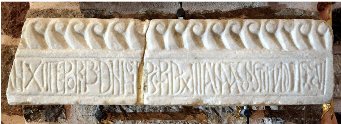
1. Arhitrav sa spomenom biskupa Ivana, Kotor, svetište katedrale Sv. Tripuna Architrave mentioning Bishop Ivan, cathedral of St Tryphon in Kotor

kojoj je već 788. godine uspostavljena franačka vlast, u svim ostalim slučajevima radi se o gradovima koji su, kao i Kotor, bili dijelom bizantske Dalmacije.