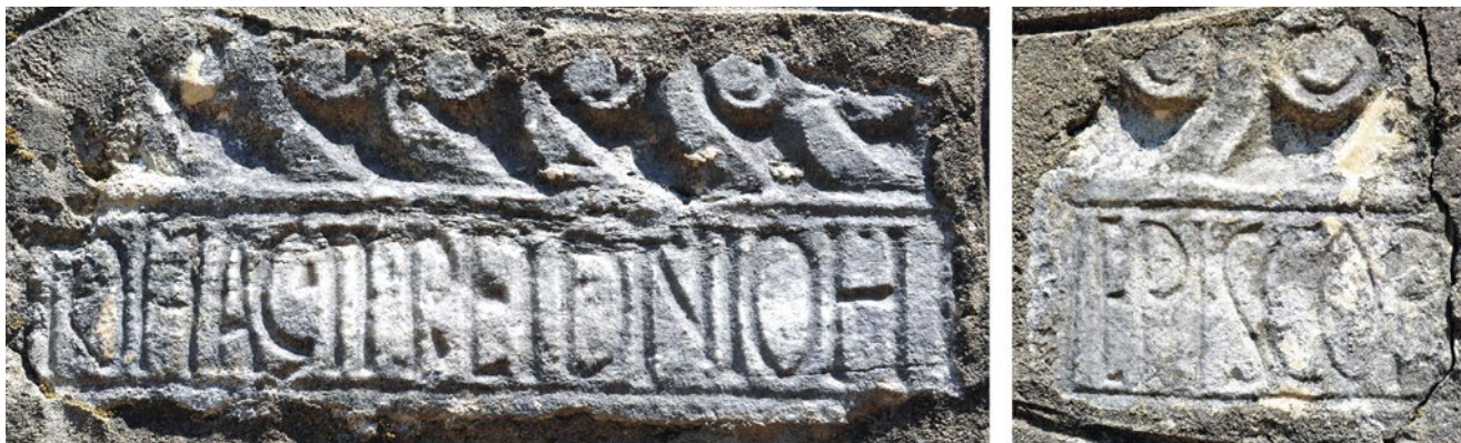
3. Ulomci arhitrava oltarne ograde, Bijela, pročelje crkvice Sv. Petra

Fragments of the architrave, altar railing, façade of St Peter's church in Bijela