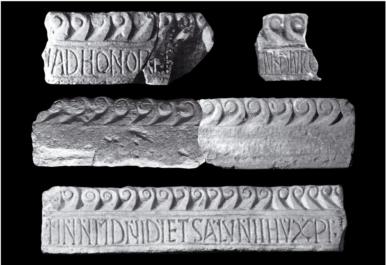
2. Srodni ulomci arhitrava iz katedrale, Kotor, depo katedrale Sv. Tripuna (gore i sredina lijevo, izvor: Z. ČUBROVIĆ /bilj. 13/, 30, sl. 9 i 10; gore i sredina desno, foto: M. Zornija). Dolje: vijenac ciborija s fasade Sv. Mihovila u Kotoru, Lapidarij Sv. Mihajla (foto: S. Kordić)

Analogous architrave fragments from the Kotor cathedral of St Tryphon, cathedral depot. Below: Ciborium cornice from the façade of St Michael's church in Kotor, lapidarium of St Michael's church