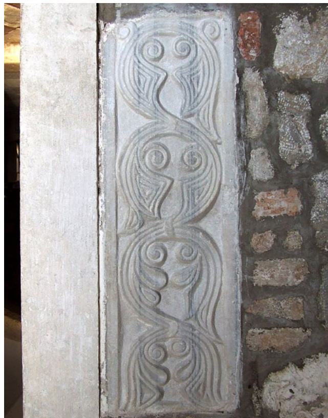
11. Pilastar od prokoneškog mramora, Školj, samostan Gospe od Milosti

Paralele za svaki od navedenih motiva s katedralnih pluteja mogu se pronaći na širem području Boke. Jedan je od lokaliteta i danas isusovački samostan na otočiću Gospe od Milosti u tivatskom arhipelagu, u narodu zvan jednostavno Školj. 36 U njegovim zidovima spolirano je 13 odlično sačuvanih komada predromaničkih liturgijskih instalacija nepoznatog porijekla, od kojih