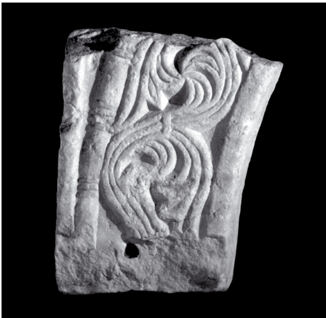
6. Lijeva peta pročelne arkade ciborija, Kotor, sakristija Sv. Marije Collegiate

Left heel of the front arcade of the ciborium, sacristy of St Mary Collegiate in Kotor