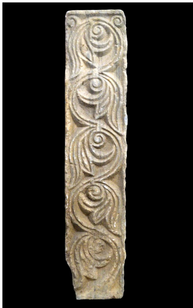
13. Pilastar s lokaliteta Račica kod Tivta, Prevlaka, manastirska zbirka Pilaster from the locality of Račica near Tivat, monastic collection in Prevlaka

Promotrimo sada treći motiv s najvećeg katedralnog pluteja. U ovoj varijanti vitica je tropruta te ima specifično oblikovanu stabljiku: na mjestima gdje iz nje izrasta trolist, proširuje se u obliku lijevka. Nalazimo ju na još jednom pluteju iste oltarne ograde, čija je stražnja strana otkrivena u posljednjim istraživanjima katedrale Sv. Tripuna. 38 S drugačije oblikovanim izdancima ponavlja se i na pilastru s križem i kaležom. Taj karakterističan detalj ljevkastih proširenja na stabljici preuzet će majstori Kotorske klesarske radionice 39 te će on postati jednim od njihovih najučestalijih motiva, potvrđujući neposredni kontinuitet lokalne klesarske