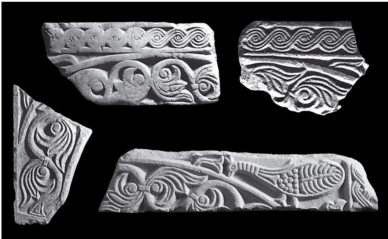
8. Ulomci arkada četverostranog ciborija, Kotor, depo katedrale Sv. Tripuna (izvor: Z. ČUBROVIĆ /bilj. 13/, 27-28, sl. 1, 2 i 4; foto: S. Kordić) Fragments of arcades at the four-sided ciborium, cathedral depot, Kotor

sinusoidne vitice s krupnim trolisnim cvjetovima. Voluminozno i zaobljeno modelirana stabljika, bez uobičajene troprute podjele, podsjeća na langobardske reljefe 8. stoljeća ukazujući na početnu fazu u razvoju predro-