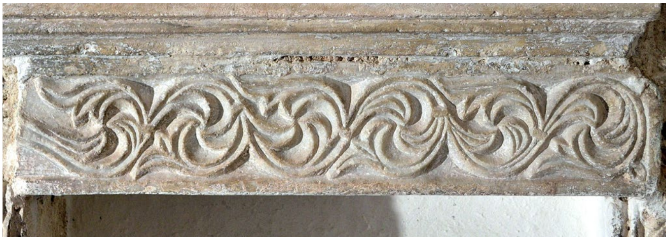
12. Pilastar uzidan u konstrukciju umivaonika, Školj, samostan Gospe od Milosti (foto: M. Zornija) Pilaster built into the basin construction, monastery of Our Lady of Mercy

neki odaju istu klesarsku maniru, kao što je primjerice peta još jedne arkade ciborija. Na jednom pilastru impresivnih dimenzija, u prokoneškom mramoru isklesana je neobična vitica s izdancima izvedenima na dva različita načina, ali kvaliteta i način klesanja su isti (sl. 11). Majstor je ovdje, poigravajući se ishodišnim biljnim motivom, stvorio unikatni, gotovo apstraktni ornament, što svjedoči o njegovoj inventivnosti i visokoj klesarskoj umješnosti. Drugi mramorni pilastar (sl. 12) u potpunosti odgovara svom pandanu u kotorskoj katedrali, baš kao i treći iz zbirke manastira na Prevlaci, pronađen na obližnjem lokalitetu Račica u Tivtu (sl. 13). 37 Obrada motiva i duktus dlijeta u tolikoj su mjeri identični s vijencima pluteja iz katedrale da ukazuju na mogućnost kako ih je klesala ista ruka. Zbog podudarnosti u materijalu, klesarskoj izvedbi i posebice monumentalnosti navedenih ulomaka, može se zaključiti da su svi oni originalno pripadali najstarijoj opremi ranosrednjovjekovne gradske prvostolnice iz vremena biskupa Ivana, a njezinom su razgradnjom, prema ustaljenoj praksi, naknadno dospjeli u druge crkve na području biskupije.