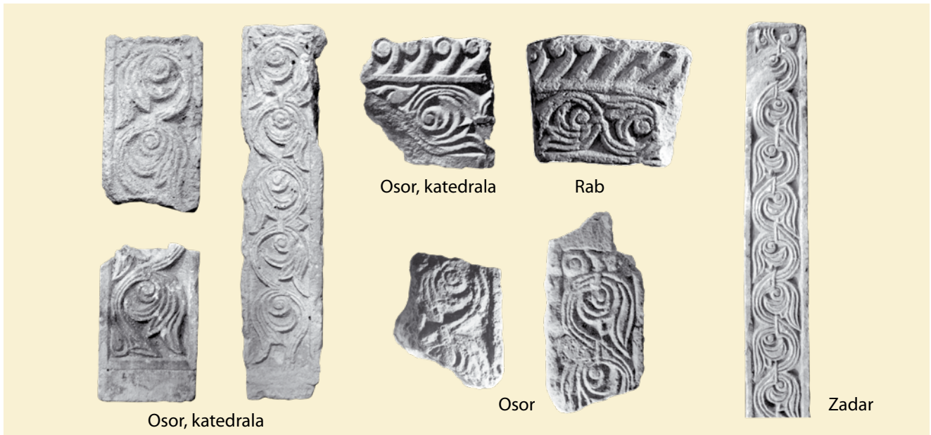
17. Reljefi s motivom sinusoidne trolisne vitice - analogije s bokokotorskim primjerima Reliefs with the motif of sinusoid triple foliage – analogies