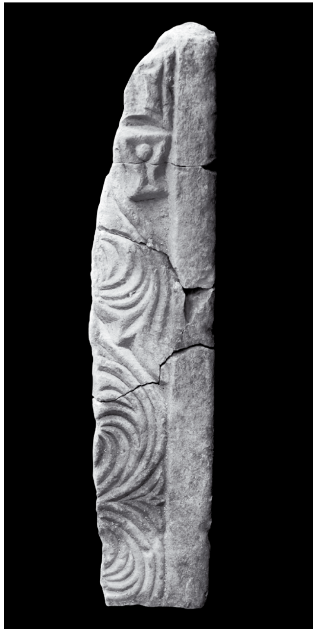
7. Ulomci pilastra s križem iz Sv. Marije Collegiate, Kotor, Lapidarij Sv. Mihajla

Analizom ovog sloja skulpture iz Sv. Marije Collegiate može se donijeti zaključak da je ranokršćanska crkva u sklopu svoje predromaničke obnove, potvrđene i ostacima arhitekture, dobila nove mramorne instalacije sastavljene od ciborija i oltarne ograde visokog tipa s arhitravom. Upravo na temelju jednog njegovog ulomka s natpisom dobili smo čvrsti kronološki okvir za datiranje rečene obnove u doba kada je na čelu kotorske crkve stajao biskup Ivan.