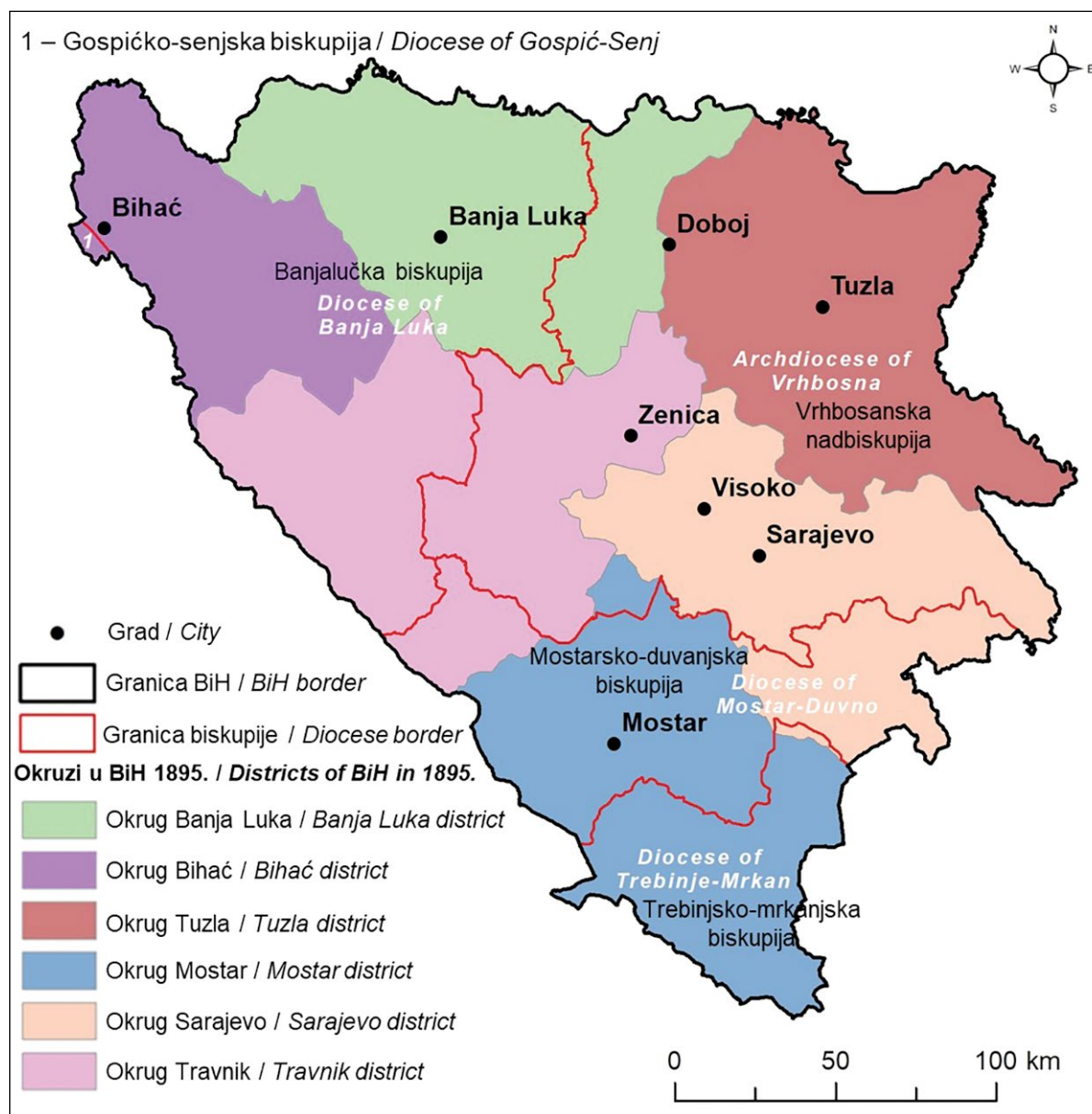
SLIKA 1. Austro-ugarsko administrativno uređenje i granice biskupija u Bosni i Hercegovini 1895.

FIGURE 1 Austro-Hungarian administrative organization and diocesan borders in Bosnia and Herzegovina in 1895