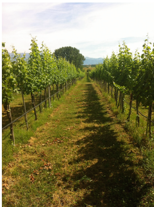
Vinograd i voćnjak na Sveučilišnom poljoprivrednom dobru "Baštica"