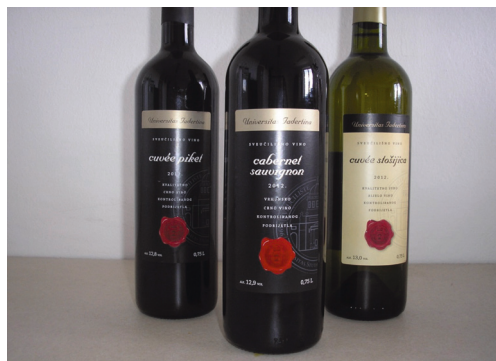
Sveučilišna vina – Universitas Jadertina