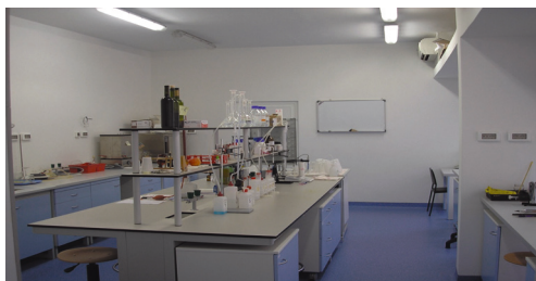
Sveučilišni laboratorij (enološko-pedološki)