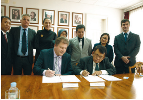
Potpisivanje pisma namjere za suradnju s Tehnološkim sveučilištem u Yogyakarta u Indoneziji