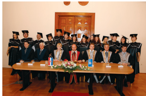
Promocija doktora znanosti