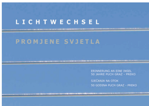
Plakat projekta Promjena svjetla – sjećanje na otok, Puch Graz – Preko – 1963.-2013.