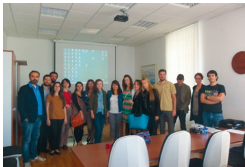
Sudionici ljetne škole Social Science and the Sea