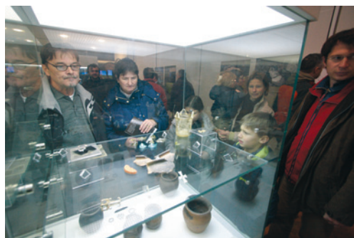
Izložba u povodu pedeset godina Odjela za arheologiju Sveučilišta u Zadru