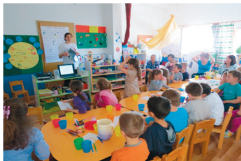
Odjel za pedagogiju na Festivalu znanosti