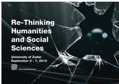
Plakat konferencije Re-Thinking Humanities and Social Sciences

znanstvenih pristupa i metoda. U skladu s takvom orijentacijom i ove godine konferencija je okupila izlagače i sudionike iz najrazličitijih znanstvenih područja od filologije, sociologije, arheologije, povijesti, geografije, antropologije itd., a pozitivna iskustva izlagača stečena tijekom prethodnih konferencijskih izdanja koja se prije svega pozivaju na posebnu atmosferu koja potiče drugačije pristupe postojećim problemima i spoznajama u području društvenih i humanističkih znanosti rezultirala su golemim brojem preporuka za ovogodišnju konferenciju. Ove godine, na temu On Violence , u radu konferencije sudjelovalo je 104 izlagača i više od 300 posjetitelja, a u organizaciji je sudjelovao velik broj studenata društvenih i humanističkih znanosti sa Sveučilišta u Zadru koji su kao volonteri pridonijeli radu konferencije.