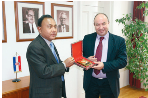
Posjet veleposlanika Republike Indonezije

stavnici Sveučilišta u Yogyakarta za mjesec dana posjetiti naše sveučilište kako bi se obavili preliminarni razgovori o suradnji.