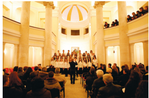
Proslava Dana Sveučilišta u Zadru