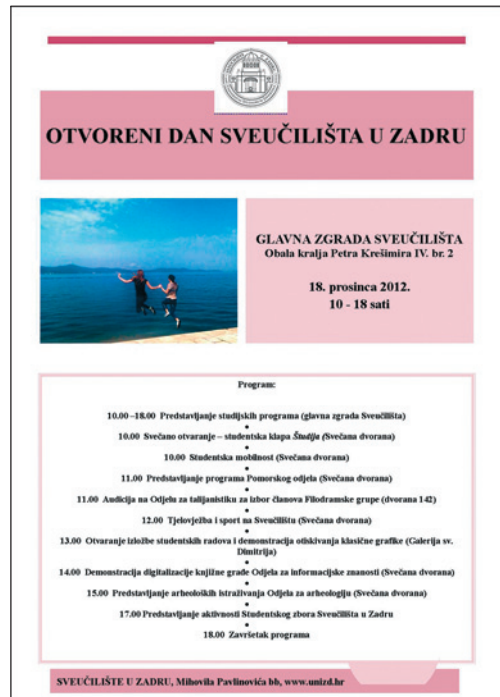
Plakat Otvorenog dana Sveučilišta s programom

Predstavljanje studijskih programa Sveučilišta u Zadru održano je 18. prosinca 2012. u glavnoj zgradi na Obali Kralja Petra Krešimira IV. br. 2. Svečano otvaranje Otvorenog dana glazbom je popratila studentska klapa "Študija". Posebno se svojim novim programom predstavio Pomorski odjel. Odjel za arheologiju predstavio je svoja arheološka istraživanja, Odjel za talijanistiku je održao audiciju za izbor člano-