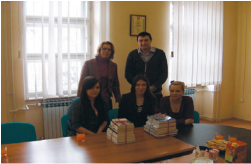
Donacija na Odjelu za nastavničke studije u Gospiću