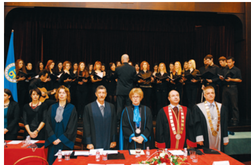
Zajednička promocija Sveučilišta u Zadru i Sveučilišta u Rijeci

U Gospiću je 1. prosinca 2013. održana svečana promocija magistara primarnog obrazovanja. Bio je to jedinstven događaj zajedničke promocije studenata s dva sveučilišta: Sveučilište u Rijeci promoviralo je 42 diplomanda, a Sveučilište u Zadru 22 diplomanda.