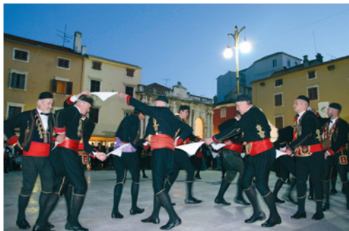
Nastup Glavnog odreda Bokeljske mornarice iz Kotora i Gradske glazbe Zadar

Događaj se temelji na višestoljetnim gospodarskim, političkim, znanstvenim i umjetničkim vezama Zadra i Boke kotorske. Bokeljska mornarica ima istaknutu ulogu u očuvanju pomorske i kulturne tradicije koju su gradili uglavnom bokeljski Hrvati. Program je započeo okupljanjem glavnog odreda Bokeljske mornarice, Gradske glazbe Zadar i uzvanika ispred crkve Gospe od Zdravlja u kojoj je pokopan zadarski nadbiskup Vicko Zmajević rodom iz Perasta u Boki kotorskoj.