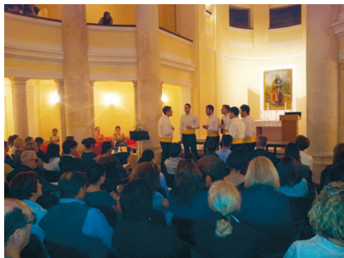
Koncert u povodu završetka ljetnog semestra