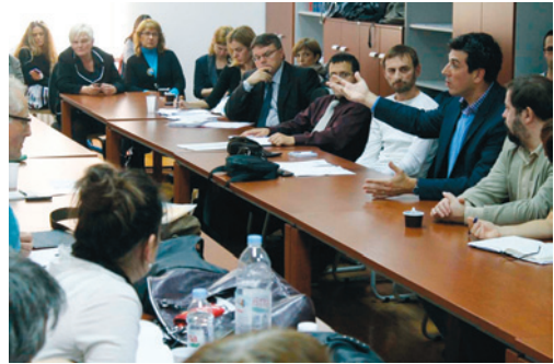
Okrugli stol Budućnost e-nakladništva u Hrvatskoj

Odjel za informacijske znanosti Sveučilišta u Zadru organizirao je 26. studenoga 2012. okrugli stol o elektroničkom nakladništvu u Hrvatskoj. Svrha okruglog stola bila je s jedne strane raspraviti značajne odrednice novoga poslovnog okruženja, učinke primjene novih tehnologija na promjenu strukture nakladničkih tržišta i pojavu novih nakladničkih proizvoda i usluga, a s druge strane upozoriti na moguće utjecaje i izazove pred koje globalizacijski učinci, optere-