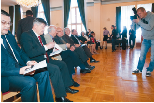
Znanstveno-stručni skup Potencijali društveno-gospodarskog razvitka Zadarske županije