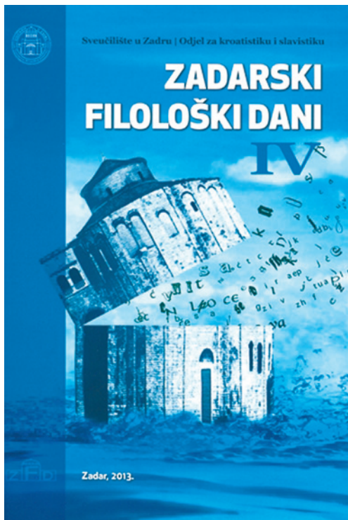
Zbornik Zadarski filološki dani IV