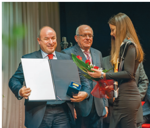
Uručivanje nagrade Grada Zadra

Susret s direktorom ureda za međunarodne odnose Regije Veneto održan je 4. prosinca 2012. u prostorima Zajednice Talijana.