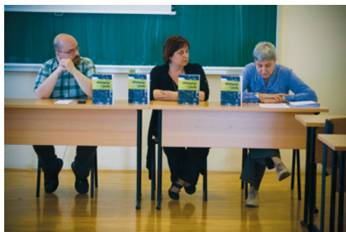
Predstavljanje knjige Distopija i jezik