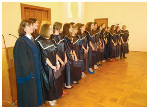
Svečana promocija prvostupnika talijanistike