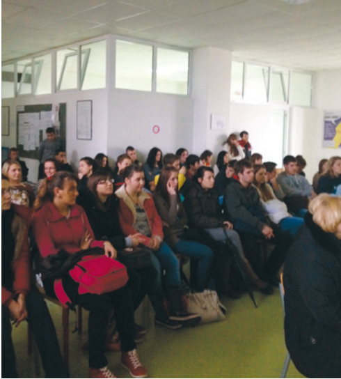
Otvoreni dan u Gospiću