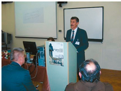
Znanstveni skup Šime Starčević i hrvatska kultura u 19. stoljeću

Prvi dan rad se odvijao u prijedpodnevnoj i poslijepodnevnoj sesiji te je održano petnaest izlaganja. Nakon izlaganja sudionici su posjetili Muzej Like u Gospiću. Drugi dan održano je šest izlaganja nakon čega su sudionici obišli rodnu kuću dr. Ante Starčevića u Velikom Žitniku.