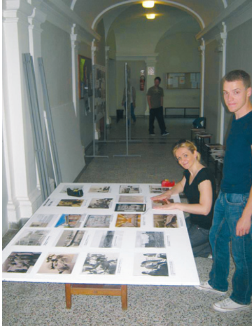
Rad na projektu Bauhaus