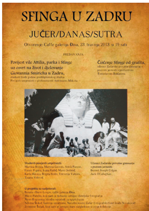
Plakat izložbe Sfinga u Zadru – jučer/danas/sutra