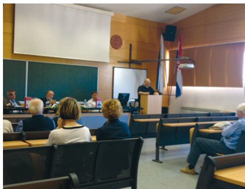
Predstavljanje Zbornika o Ivanu Kukuljeviću Sakcinskom