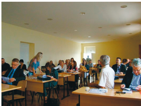
Zadarski filološki dani 5

U sklopu skupa organizirana su i predstavl- janja dvaju zbornika: zbornika Zadarski filološki dani 4 i zbornika Književna ži- votinja .