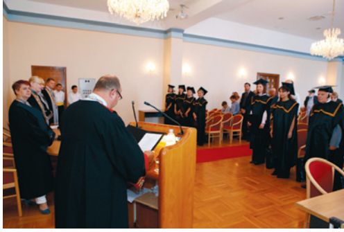
Promocija magistara znanosti