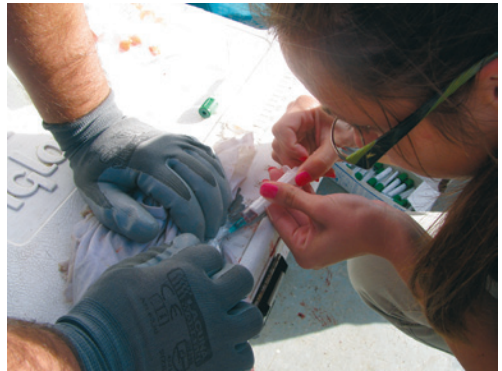
Rad na projektu Utjecaj imunostimulatora PDS 2865 na imunitet orade u akvakulturi

uzgajalištu tvrtke Dalmar d.o.o, na otoku Vrgadi u blizini Pakoštana.