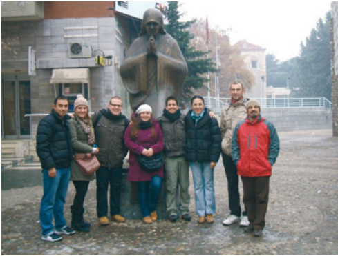
Terenska nastava Odjela za etnologiju i kulturnu antropologiju

Europe. Takva slika interkulturalnosti i interreligioznosti u našoj blizini za studente je bio prikladan način za pripremu nadolazećeg kolegija Interkulturalnost u suvremenoj teoriji. Dolaskom na teren u prosincu Šutka nije bila tako pristupačna kao ljeti kada je sniman film, a i drugi događaji u Makedoniji s kojima su se studenti suočili doveo je do premještanja fokusa na odnose Albanaca i Makedonaca, projekt Skopje 2014., položaj žene u islamu, diskurse balkanizam i orijentalizam te interkulturalno-interreligijsku ikoničnost Majke Tereze. Studenti su posjetili Institut za etnologiju i kulturnu antropologiju i upoznali se s profesorima i studentima. Nakon zakuske održana je serija predavanja prof. dr. sc. Ljupča Risteskog (pročelnika Instituta) o