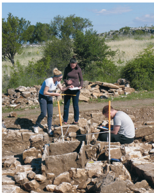
Terenska nastava Odjela za arheologiju u Nadinu