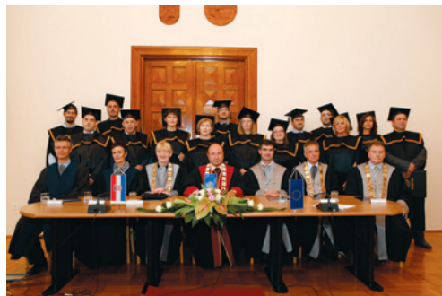
Promocija doktora znanosti

Rezultati provedenog istraživanja za potrebe ovoga rada potvrdili su postavljene hipoteze o nedostatku jasno utvrđenih kriterija informacijskog strukturiranja mrežnih stranica lokalnih samouprava te je autor zauzeo jasan stav kojim ističe nužnost promjene tog trenda, a dobivena se saznanja mogu iskoristiti i za praktična rješenja uočenih problema.