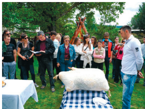
Terenska nastava Odjela za ekologiju, agronomiju i akvakulturu

antropologije razvila je ideju o odlasku na makedonski teren, kulturološki blizu, a ipak umnogome i daleko od studentima poznatih prostora s terenske nastave. Inspiracija za početna razmišljanja bio je film Šampionite od Šutka koji prikazuje život u istoimenom najvećem romskom naselju jugoistočne