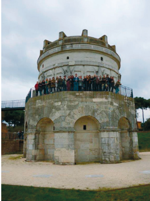
Terenska nastava Odjela za povijest umjetnosti