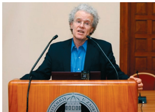
Prof. dr. sc. Erik Olin Wright

Prof. dr. sc. Erik Olin Wright sa Sveučilište Wisconsin-Madison održao je 14. svibnja 2013. na Odjelu za sociologiju predavanje pod naslovom Real Utopias .