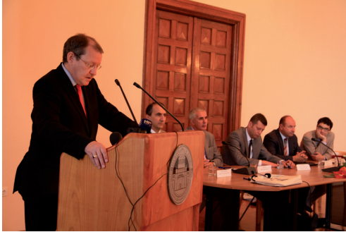
Otvorenje 4. međunarodnog kongresa o podvodnoj arheologiji