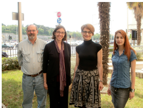
Otvoreni dan Odjela za lingvistiku

Deseto jubilarno proglašenje dobitnika Top stipendije za top studente održano je 6. srpnja 2011. u hotelu Westin u Zagrebu. Na natječaj se prijavilo 427 studenata sa svih hrvatskih sveučilišta, različitih sveu-