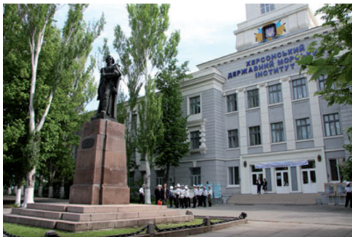
Pomorski institut Kherson