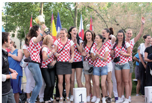
Ženska košarkaška ekipa prima medalje za osvojeno 1. mjesto na Međunarodnom studentskom turniru u Lyonu