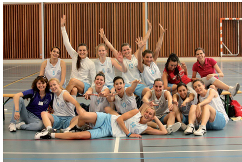
Ženska košarkaška ekipa Sveučilišta u Zadru

- U sklopu obveznog kolegija Kineziološka kultura na Odjelu za knjižničarstvo organizirano je planinsko pješaćenje na Paklenicu.