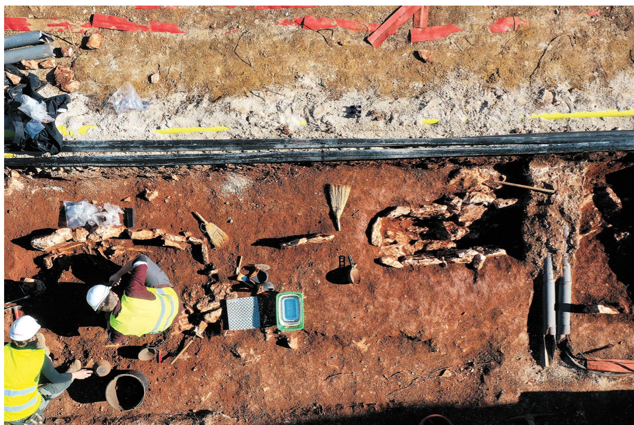
Arheološka istraživanja u sondi 1 Archaeological excavations in trench 1

ture, a to je ujedno i jedini grob s nalazima u kojem je otkrivena brončana dvodijelna dvopetljasta kopča, tzv. ažula. Takve vrste kopči u upotrebi su od prve polovice 14. stoljeća, rabe se i tijekom 20. stoljeća, a varijante istih se i danas upotrebljavaju (Anzulović 2007: 259). U ostalim grobovima nema priloga ni nalaza, a rezultati 14 C analize kostiju pokojnika iz groba 4 uz vjerojatnost od 68,2 % datiraju grob u vrijeme između 1634. i 1794. godine. Položaj grobova 9 i 11 otvara mogućnost da je paralelno uz liniju istraženih grobova bilo još ukopa položenih u pravilne nizove. Svi su grobovi ukopani u sloj masne crvenice s ostacima rimskodobnog arheološkog materijala, većinom fragmentiranim nalazima stakla, keramike, ponajviše građevinske i tesera. Iako je istražena sonda u neposrednoj blizini antičke nekropole, nije bilo tragova rimskodobnih grobova.