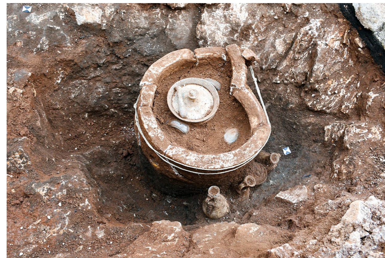
Rimskodobni ukop u kamenoj urni, gr. 15 Roman-era burial in a stone urn, gr. 15

Next to the Monastery of St John, after the structures that were assumed to be part of the funerary stone architecture had been accidentally discovered, the works were stopped and rescue archaeological excavations started in an area of 46 m 2 .