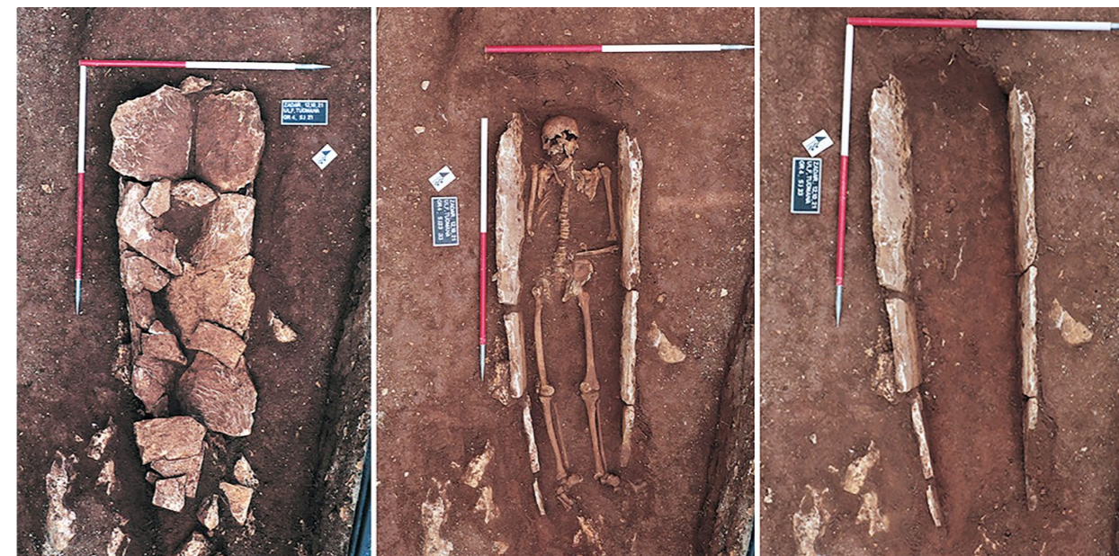
Grob 4 Grave 4

ture, a to je ujedno i jedini grob s nalazima u kojem je otkrivena brončana dvodijelna dvopetljasta kopča, tzv. ažula. Takve vrste kopči u upotrebi su od prve polovice 14. stoljeća, rabe se i tijekom 20. stoljeća, a varijante istih se i danas upotrebljavaju (Anzulović 2007: 259). U ostalim grobovima nema priloga ni nalaza, a rezultati 14 C analize kostiju pokojnika iz groba 4 uz vjerojatnost od 68,2 % datiraju grob u vrijeme između 1634. i 1794. godine. Položaj grobova 9 i 11 otvara mogućnost da je paralelno uz liniju istraženih grobova bilo još ukopa položenih u pravilne nizove. Svi su grobovi ukopani u sloj masne crvenice s ostacima rimskodobnog arheološkog materijala, većinom fragmentiranim nalazima stakla, keramike, ponajviše građevinske i tesera. Iako je istražena sonda u neposrednoj blizini antičke nekropole, nije bilo tragova rimskodobnih grobova.