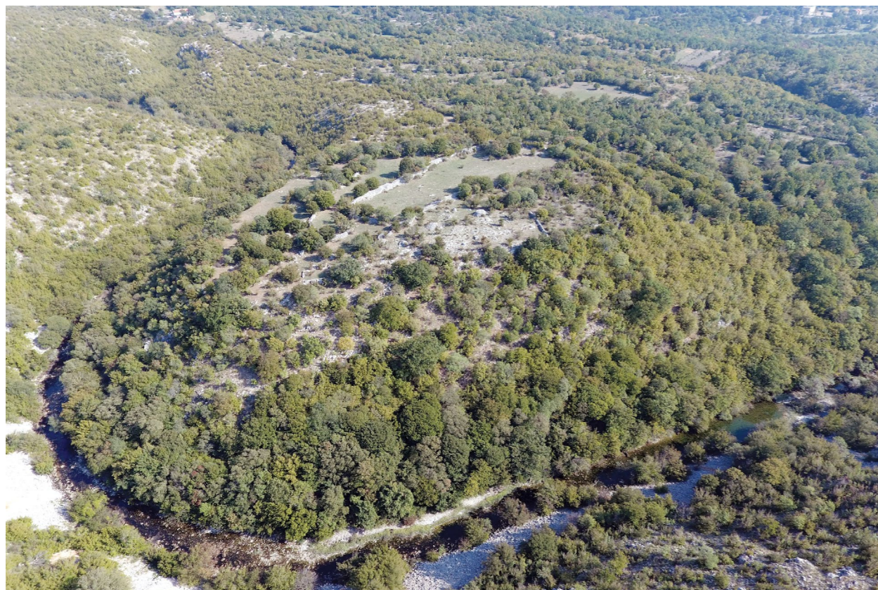
Smokovac na sutoku Orovače i Krupe Smokovac at the confluence of Orovača and Krupa