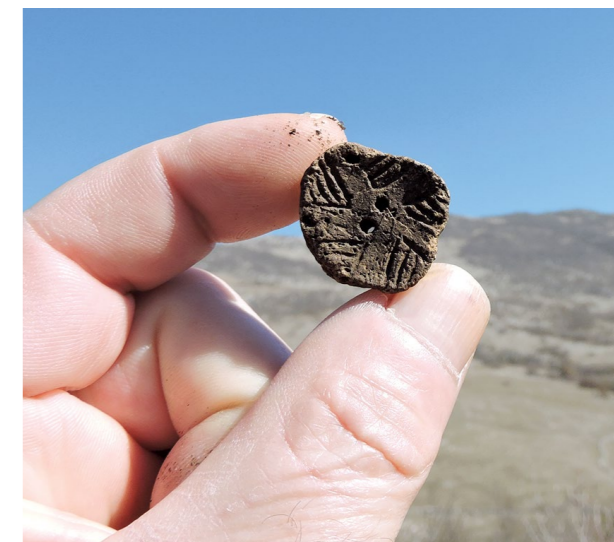
Prapovijesni keramički predmet s gradine kod Dubokog dola Prehistoric ceramic artifact from hillfort near Duboki dol

Rekognosciranjem je obuhvaćen i jedan arheološki lokalitet koji administrativno pripada Gradu Benkovcu. To je karinska Gradina, smještena oko 600 m južno od ušća Karišnice. Lokalitet je obrastao gustom šumom koja je u zapadnom i sjevernom dijelu iskrčena na trasi dalekovoda. Na jugoistoku je strma litica, a na ostalim su stranama masivni bedemi od amorfnog kamena. Unutar zaštićenog prostora dijelom su vidljivi suhozidni ostatci brojnih nastambi pravokutnog tlocrta. Takvi su objekti na još nekim gradinskim naseljima u južnoj Liburniji, primjerice na Lergovoj gradini poviše Slivnice Gornje (Ilkić, Čelhar 2018, 617–620) i Jarebnjaku kod Brguda. S karinske Gradine potječe novac Kartage (Šešelj, Ilkić 2023). Na površini je vidljivo ponešto ulomaka amfora i liburnske keramike, a zamijećen je i dio helenističkog žrvnja.