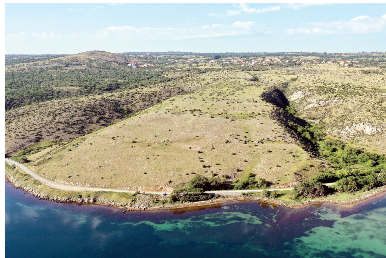
Budim kod Posedarja Budim near Posedarje

Five sites were inspected in the wider area of Novigrad and Obrovac. Archaeological remains were not noticed at the Novigrad location called Gradina, about 1 km in the direction of Pridraga, and not far from the Grgorići hamlet. However, the site bearing the same name not far from Paljuv yielded some finds. Gradina is located between the hamlets of Cvitići and Barabe. It is protected from the north by the Mošunje gorge, and on the other sides is a dry stone wall made of amorphous stones. Some scattered fragments of coarse prehistoric pottery were found on Gradina. The site was partly devastated during the Homeland War, and remains of explosive devices are also visible. The same applies to Velika Gradina, about 5 km