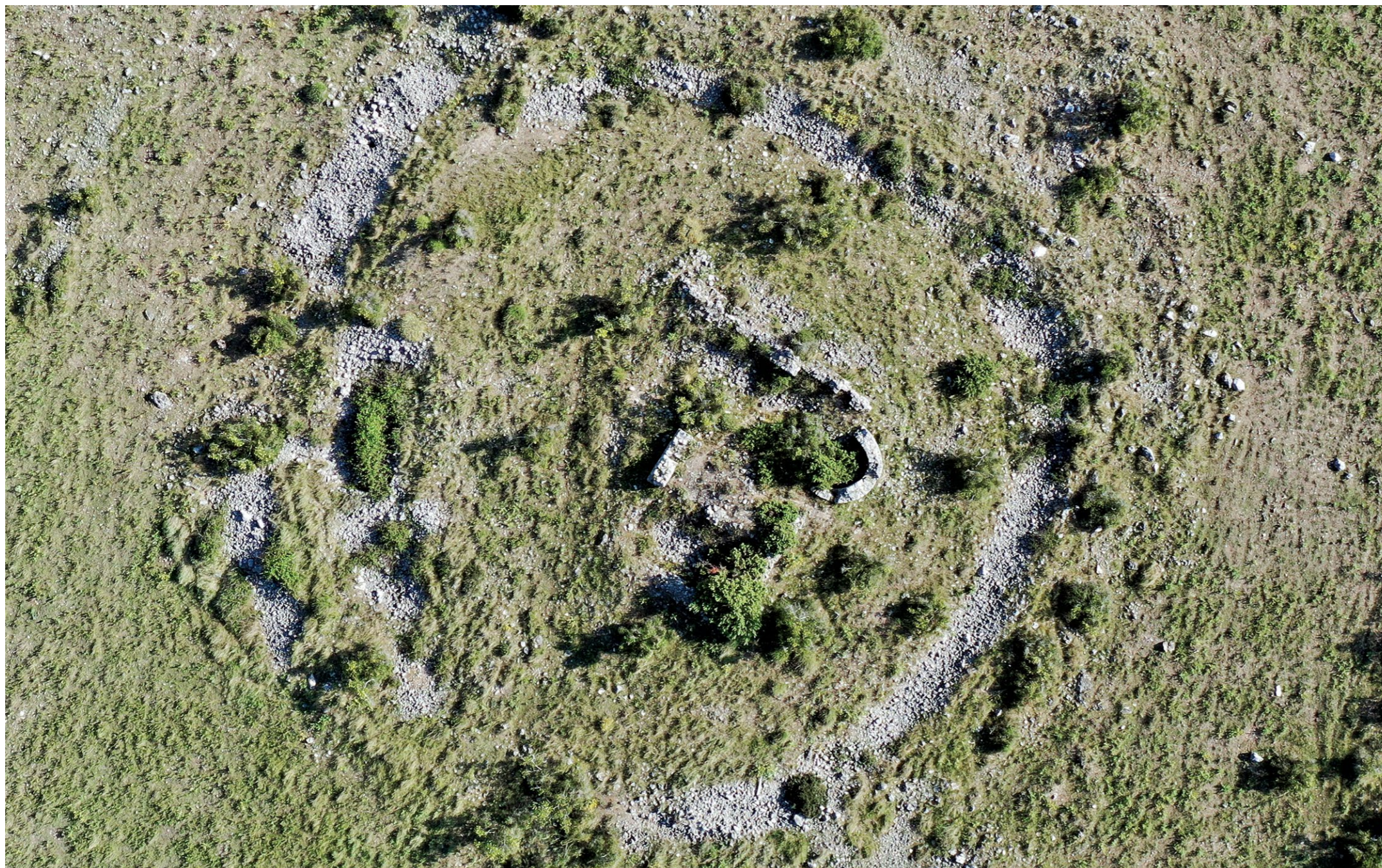
Ostatci sakralne građevine na Budimu Remains of a sacral building in Budim

čini se, od neke stare komunikacije. Sličan se nalazi i na području mjesta Krupe, oko 17 km istočno od Obrovca. Vjerojatno je riječ o podzidu trase rimske ceste koja je prolazila uz gradinu Smokovac. S tog višeslojnog arheološkog lokaliteta na sutoku Orovače i Krupe potječe helenistički novac akarnanijskog grada Oinaidai (Šešelj, Ilkić 2022: 171, 182 kat. br. 4) te ilirskog vladara Baleja (Ilkić, Šešelj 2017: 286, kat. br. 43, T. IV, 5). Osobito su brojni nalazi iz rimskog carskog razdoblja (Abramić, Colnago 1909, col. 37-44). Nađen je i denar ugarsko-hrvatskog kralja Kolomana (Ilkić 2017: 155). Smokovac je na istoku branjen kamenim bedemom, a na ostalim stranama štiti ga strmoglavi kanjon potoka Oro-