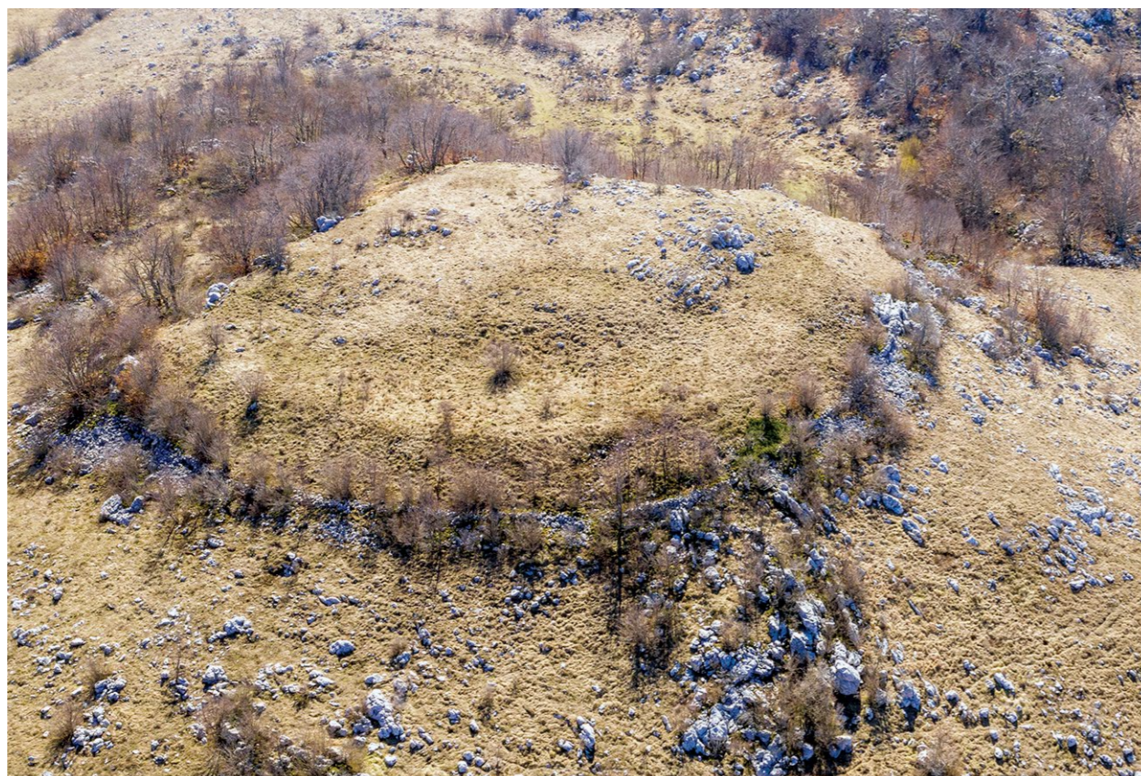
Gradina kod Dubokog dola u vršnoj zoni južnog Velebita Hillfort near Duboki dol in the peak zone of southern Velebit

šena s pet radialno postavljenih trokutastih polja s urezanim crtama. Posve isti neobjavljeni primjerak keramike otkriven je 2016. tijekom arheološkog pregleda prapovijesne gradine na lijevoj obali Zrmanje kod zaseoka Berbera na području Muškovca.