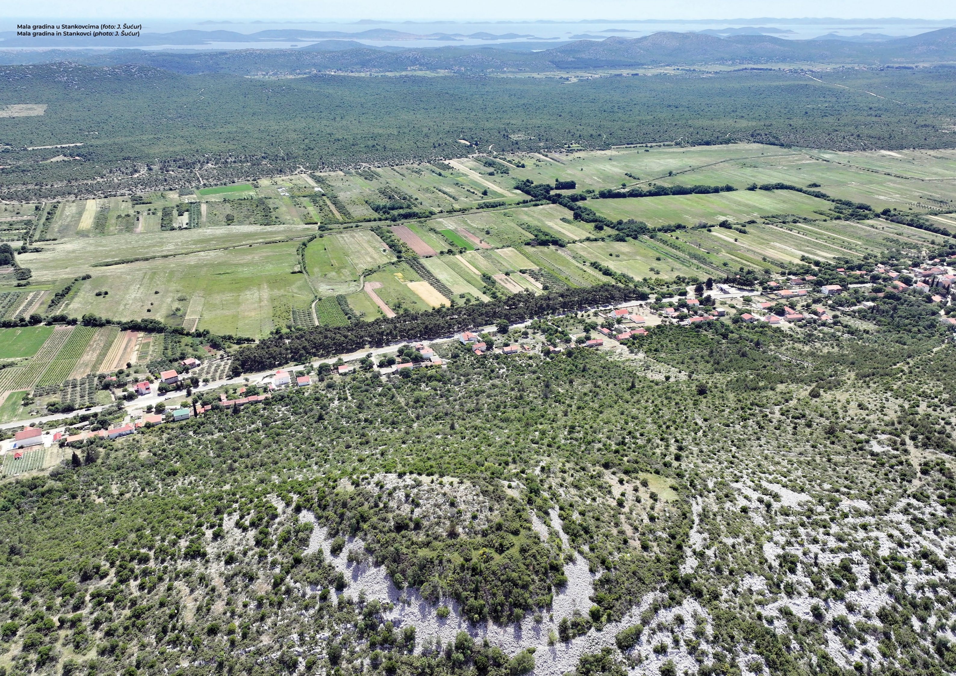
Mala gradina u Stankovcima Mala gradina in Stankovci