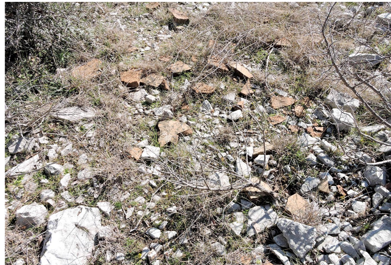
Ulomci pitosa na Čosinoj gradini Fragment of a pithos from Čosina gradina

gradine je devastiran mnogobrojnim ukopanim bunkerima iz razdoblja okupacije tijekom Domo-vinskog rata. Na Trojanu se naziru arhitektonski ostatci liburnskih nastambi pravokutne osnove. Unutar gradine su razasuti dijelovi helenističkih žrvnjeva, ulomci pitosa, amfora te ponešto keramike s crnim premazom (T. I, 6). Otprije su poznati raznovrsni numizmatički nalazi. Prevladava sjevernoafrički novac, osobito Kartage i Numidije (Ilkić, Kožul, Meštrov 2020: 182–190).