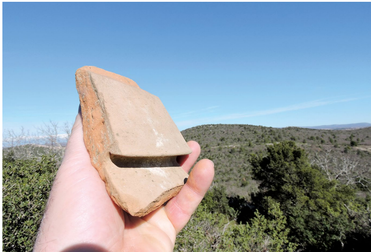
Ulomak pitosa s Čosine gradine Fragment of a pithos from Čosina gradina

je razasuta raznovrsna keramika. Uglavnom je to domaća s primjesama, ali ima i importirane s crnim premazom (T. I, 2). Vidljivi su ostatci žrvnjeva i mnogobrojnih pitosa. Otprije su poznati nalazi grčkog novca iz 4. i približno prve polovice 3. st. prije Krista (Ilkić, Kožul, Meštrov 2020: 184, kat. br. 13–27; Ilkić, Šešelj 2025: cat. no. 7, Pl. I, 7). Sudeći po toj numizmatičkoj građi, na Čosinoj gradini život je prestao prije 221. pr. Krista, jer na njoj nije zastupljen kartaški novac iz razdoblja Drugoga punskog rata, 2 kakav je u golemoj količini pronađen u mnogobrojnim liburnskim i japodskim gradinskim naseljima.