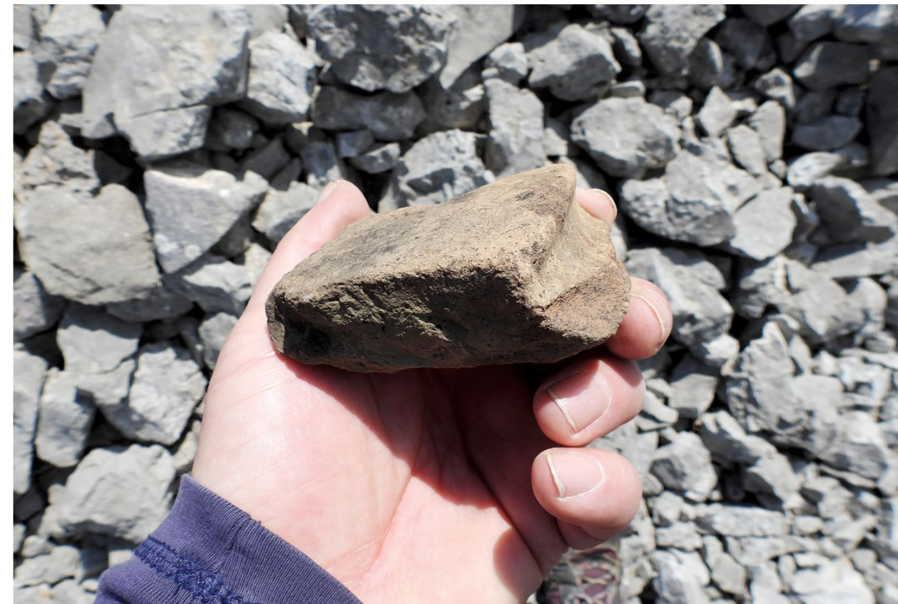
Ulomak pitosa s Trojana (foto: M. Ilkić) Fragment of a pithos from Trojan (photo: M. Ilkić)

prednjoj strani njezina ogradnog zida, i to bočno od ulaza, nedavno su ugrađene tri predromanič- ke kamene spolije. Za njih se doznalo zahvaljuju- ći Draženu Orloviću, koji je rekao da su iskopane blizu vanjske strane južnog zida crkve. 5 Jedan je ulomak od arhitrava oltarne ograde (T. II, 1). Dru- gi pripada glavnom polju pluteja (T. II, 2), a treći možda vijencu pluteja ili arkadi ciborija (T. II, 3). Prema stilskim odlikama pleterne ornamentike, proizvod su benediktinske klesarske radionice iz vremena hrvatskog kneza Branimira. 6 Dakle, da- tiraju približno iz posljednje četvrtine 9. stoljeća. Ali to nije sve. Iz Budaka potječe i ulomak pre- dromaničkog natpisa općega sakralnog sadržaja, za koji je navedeno da je slučajno nađen 1914. uz crkvu sv. Kate (Delonga 1996: 179, kat. 143).