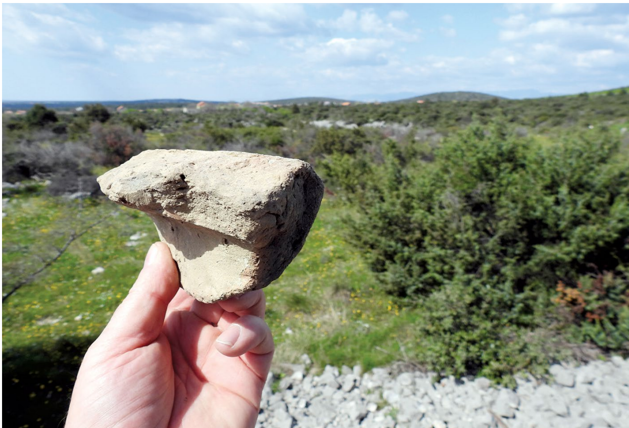
Ulomak pitosa s Trojana Fragment of a pithos from Trojan

2013: no. 3). Vrlo sličan primjerak potječe s Cviji- ne gradine kod Kruševa (Ilkić, Šešelj 2024: 356, cat. no. 31, Fig. 31). Osim što svjedoči o kontakti- ma zajednica s obiju obala Jadrana, primjerak sa stankovačkog područja upućuje i na ranu pojavu poluga s motivom suhe grane u Liburniji. Naime, na Maloj gradini nisu uočeni ostatci amfora, kao ni ostalih karakterističnih nalaza iz posljednja tri stoljeća prije Krista, što upućuje na to da tada na njoj više nije bilo života.