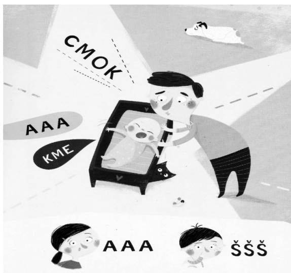
SLIKA 4. Primjer ilustracije iz slikovnice Pino uči govoriti

U interaktivnoj knjižici Pino igre gestama i glasovima , autorice Marte Galewski, također logopedice, razvoj govora potiče se kroz jednostavne glasovne igre, poput ponavljanja samoglasnika, onomatopeja i logatoma, koje su praćene igrom ručicama – autorica upućuje roditelja-čitatelja da uzme bebine ručice u svoje te da zajedno dodiruju tekst i igraju se (slika 4). Autorica doslovno koristi izraz igrajte se i potaknite bebu na oponašanje. Zanimljivo je istaknuti da je Galewska autorica više takvih knjiga te da je taj tip knjiga, ostvario jako dobru recepciju i kod djece „čitatelja“ urednoga razvoja. Hrvatska izdanja njenih slikovnica je uredila i prilala-