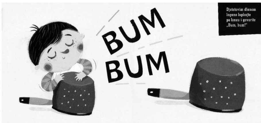
SLIKA 3. Primjer ilustracije iz slikovnice Pino igre gestama i glasovima

U interaktivnoj knjižici Pino igre gestama i glasovima , autorice Marte Galewski, također logopedice, razvoj govora potiče se kroz jednostavne glasovne igre, poput ponavljanja samoglasnika, onomatopeja i logatoma, koje su praćene igrom ručicama – autorica upućuje roditelja-čitatelja da uzme bebine ručice u svoje te da zajedno dodiruju tekst i igraju se (slika 4). Autorica doslovno koristi izraz igrajte se i potaknite bebu na oponašanje. Zanimljivo je istaknuti da je Galewska autorica više takvih knjiga te da je taj tip knjiga, ostvario jako dobru recepciju i kod djece „čitatelja“ urednoga razvoja. Hrvatska izdanja njenih slikovnica je uredila i prilala-