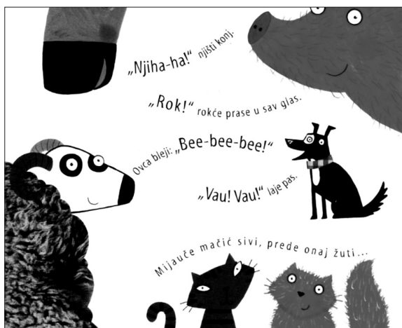
SLIKA 2. Ilustracija iz slikovnice Što je bubamara čula?

Uzvici su u navedenim primjerima u službi objekta. Djeca takvim onomatopejskim uzvicima i imenuju životinje prije nego što se počnu služiti riječima pas, mačka, pijetao, konj... Potpuno im je razumljivo na koga se odnose navedene onomatopeje, a ono što daje dodatnu vrijednost tekstu mogućnost je da nakon nekoliko čitanja sudjeluju i sami u „čitanju“ na način da oponašaju zvuk glasanja životinje, onomatopejski uzvik. Julia Donaldson, popularna i višestruko nagrađivana engleska dječja spisateljica, autorica je među ostalim slikovnice Što je bubamara čula . Piše u rimama, a u navedenome je djelu i glavni idejni obrat zamjena glasanja domaćih životinja da bi se tako nadmudrilo provalnike. Zanimljiv je i grafostilemski raspored onomatopeja koje pomalo stripovski izlaze iz usta životi-