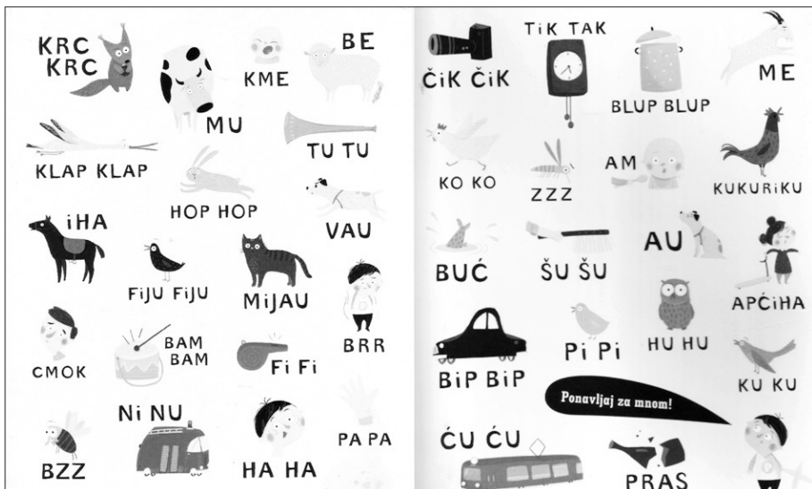
SLIKA 5. Uzvici iz slikovnice Pino uči govoriti

Na zadnjim se dvjema stranicama te slikovnice nalaze svi korišteni uzvici te se tako pruža mogućnost za osmišljavanje raznih igara, npr. roditelji traže od djeteta da nešto pronađe, a onda dijete zadaje roditeljima što da oni traže (slika 6). Djetetu je omogućeno aktivno sudjelovanje u „čitanju“ na takav način, uzvici su tu polifunkcionalni kao i u prethodno navedenim primjerima u dječjem govoru i poeziji.