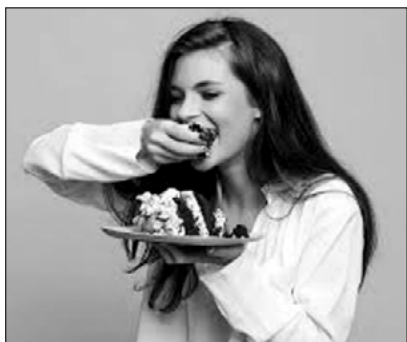
SLIKA 1. Fotografija za stvaranje rečenice u motivacijskom dijelu sata

Učenici će opisati fotografiju rečenicom Djevojka jede tortu rukama . Učitelj razgovara s učenicima o mogućem poretku riječi u ovoj rečenici, a učenici uočavaju da je u hrvatskom jeziku slobodniji poredak riječi i da, ako zamijenimo mjesta pojedinim rečeničnim dijelovima, obavijest je svejedno razumljiva. Učitelj pitanjima navodi učenike na razmišljanja o pravilnom poretku riječi u rečenici npr. Zašto je riječ djevojka na prvom mjestu? Koju službu ima ta riječ u rečenici? Koju službu imaju ostale riječi? Učitelj naglašava da pravilan poredak riječi u rečenici usvajamo pomoću gramatičkoga