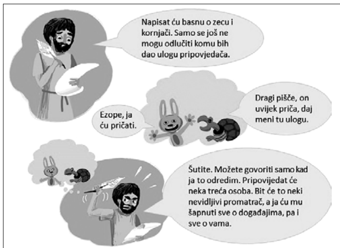
SLIKA 3. Lingvometodički predložak za prvi zadatak podcrtavanja predikata

Učitelj odabire jednu od izrečenih rečenica i zapisuje je. Poziva učenike da odrede predikatne kategorije zapisanom predikatu, npr. moguće je zapisati rečenicu Dječak je skočio . Predikatne kategorije su: 3. osoba, broj je jednina, vid je svršeni, vrijeme je perfekt, a način indikativ. Učenici uočavaju da su predikatne kategorije gramatička svojstva predikata kojima predikat upravlja ostalim članovima rečenice. Potom učitelj najavljuje čitanje stripa o Ezopu koji prikazuje na slikokazu.