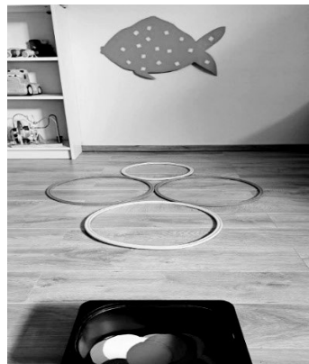
SLIKA 7. Ukrasi ribicu

Poticajna aktivnost Ukrasi ribicu može se postaviti u istraživački centar. Uz verbalni poticaj odgojitelja djeca mogu lijepiti izrađene ljuskice na ribu. Obruči postavljeni na tlu mogu ih poticati na sunožne ili jednoonožne poskoke. Osim toga, mlađa djeca mogu samo hodati iz obruča u obruč. Kroz ovu aktivnost djeca spoznaju građu ribe, razvijaju svoju maštu i kreativnost ukrašavajući je, te provedbom različitih motoričkih zadataka razvijaju svoje sposobnosti.