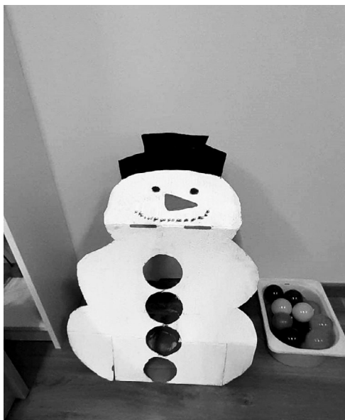
SLIKA 1. Snjegović i loptice

U centru za istraživanje može se postaviti snjegović od papira, koji djecu primarno može potaknuti na ubacivanje loptica. Snjegović se može modificirati tako da otvori za ubacivanje budu različitih veličina, a djeci se u kutiju mogu postaviti predmeti različitih oblika i veličina. Djeca pri ubacaju predmeta mogu spoznati odnos veličine predmeta te veličine i oblika otvora, a osim toga razvijaju finu i grubu motoriku. S djecom srednje i starije dobne skupine mogu se ubacivati loptice s različitih udaljenosti, razvijajući pritom koordinaciju oko-ruka, te preciznost.