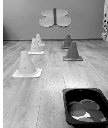
SLIKA 5. Šareni leptir

Poticajna aktivnost Šareni leptir može biti smještena u centru za građenje. Uz verbalni poticaj odgojitelja djeca mogu lijepiti izrađene ukrase na krila leptira. Kako bi se implementirao pokret, ispred aplikacije postavljene na zidu mogu se postaviti čunjevi koji djecu potiču na zaobilazanje. Odgojitelj može demonstrirati različite načine obilaženja čunjeva koje djeca mogu oponašati (puzeći, hodajući na prstima, bočnim hodanjem i sl.). Umjesto čunjeva mogu se postaviti i drugi motorički zadatci, primjerice strunjača preko koje se djeca kotrljaju, linija po kojoj hodaju i sl. Cilj poticajne aktivnosti jest da se poveže jedan način kretanja s izradom leptira. Djeca kroz opisanu aktivnost razvijaju grubu motoriku (koordinaciju, preciznost, ravnotežu), ali razvijaju i kreativnost, strpljivost, pažnju.