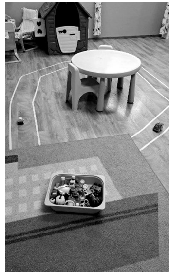
SLIKA 6. Prometna pravila

U sklopu obrade teme prometa i sudjelovanja u prometu može se postaviti poticajna aktivnost Prometna pravila . Na tlu sobe se krep trakom naprave linije u različitim smjerovima koje predstavljaju cestu, a djeci se objasni smjer vožnje te naputak da voze samo jedan auto odjednom pazeći da se ne sudare s drugima. Pri guranju autića po tlu, djeca provode puzanje kao motorički zadatak. Također se može postaviti prepreka (tunel) kroz koju će se morati provući, a postupno se na cesti postavljaju prometni znakovi koje djeca pri kretanju trebaju poštovati. Kroz ovu poticajnu aktivnost, razvijajući finu i grubu motoriku djeca uče o prometu i o prometnim pravilima.