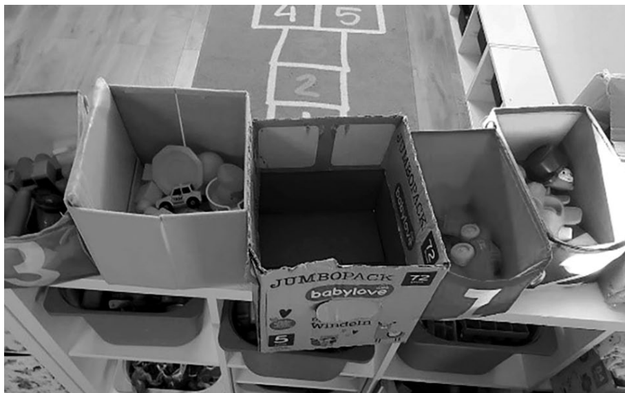
SLIKA 2. Šarene kutije

tirao pokret, predmeti različitih boja mogu se postaviti po cijeloj sobi, a djeca nakon pronalaska određenog predmeta postavljaju ga u kutiju iste boje. Također se aktivnost može modificirati na način da se na tlu postave markacije različitih boja, te se djeca nakon što su pronašla predmet odgovarajuće boje samo po markacijama iste boje mogu kretati do odgovarajuće kutije. Na početku aktivnost može biti bazirana na interakciji odgojitelj-dijete/djeca, a s vremenom se može nastaviti samo među djecom.