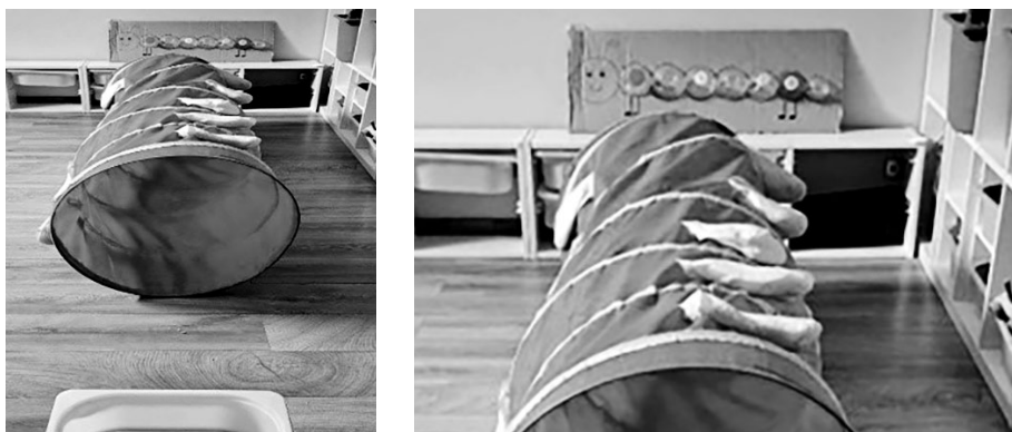
SLIKA 4. Gusjenica

Poticajna aktivnost Gusjenica može biti smještena u centru za građenje. Uključuje postavljanje tunela i aplikacije gusjenice izrađene od kartona i plastičnih boca. Djecu već sami tunel potiče na provlačenje i puzanje, a postavljanjem plastičnih čepova djecu se potiče da nakon provlačenja kroz tunel pronađu čep odgovarajuće boje i postave ga na zadano mjesto. Na taj način razvijaju finu motoriku, a provlačenjem kroz tunel razvijaju koordinaciju i preciznost.