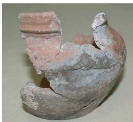
Sl. 23. Keramički kasnosrednjovjekovni vrč