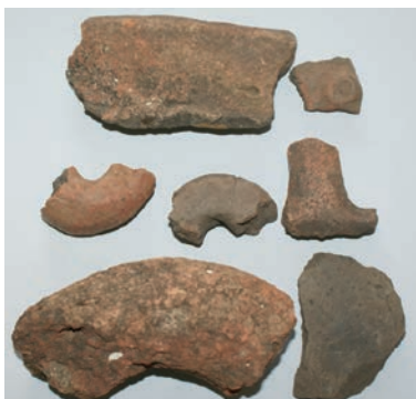
Sl. 7. Keramički nalazi s Kalinića oblaja