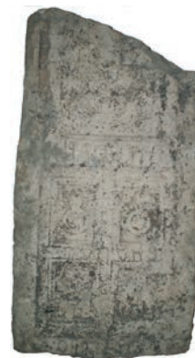
Sl. 14., sl. 15. Lovinačka urna i njen crtež