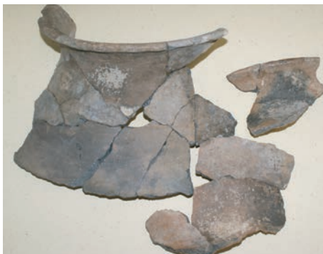
Sl. 10. Izbor keramičkih nalaza iz Brkića pećine

blago razgrnutim prema van (sl. 10.), od pročišćene gline s dodanim sitnim i srednje krupnim kalcitnim primjesama. Površina je glačana, na nekim mjestima s ostatkom tanke skrame. Tipološki pripada velikim posudama – loncima za čuvanje hrane. Slične primjerke nalazimo u Jankuša pećini kod Ličkog Novog (Osterman 2008: 42, T.VI/3,4), Bezdanjači (Drechsler-Bižić 1979: 64-65, 67-68, T.XXVIII/2, T. XXX/1, T.XXXVII/4) i dr.