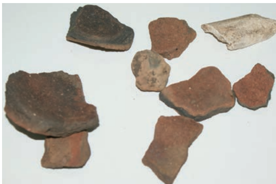
Sl. 9. Keramički nalazi s Tomičića gradine

Kalinića oblaj u Raduču naseljen je već u kasno brončano doba, sudeći po ulomcima keramičkih posuda uglavnom grube fature (sl. 7). 10 U podnožju zapadno, nalazi se