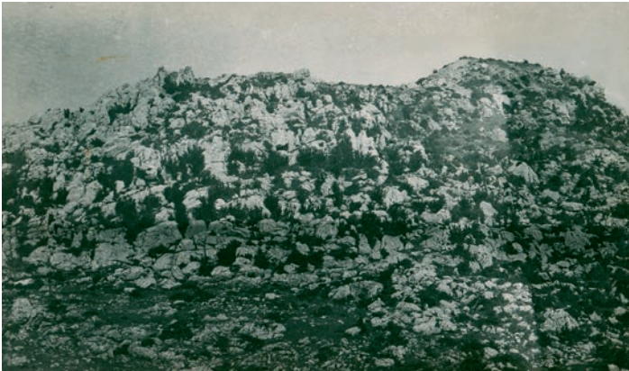
Sl. 19. Raduč grad ili Gajića gradina koju je snimio Većeslav Heneberg, 1923.

Često se kod autora navode i različita nazivlja ovih gradova, pa se u njihovu nabrajanju, multipliciraju brojevi, a ne postoji niti tipološka diferencijacija. Stoga pronalazimo u zajedničkom popisu i srednjovjekovne gradove i turske kule i prapovijesne gradine. Zasigurno potvrđeni u prostoru, kao i povijesnim izvorima i kartografskim prikazima, su stari grad Lovinac, podignut na Gradini ili Serdarskoj gradini u Sv. Roku. Sagrađen je na krševitom i strmom brijegu, obraslom u niže raslinje i hrastovu šumu. Do njega je, smještenog na zaravnjenom platou, vodio vijugav put s jugozapadne strane. U osnovi je imao pravokutni oblik, duže strane 33 m, a uže 19 m. Mjestimice je zid metar debljine očuvan u visini od 1 do 3 m. S unutarnje strane gradskih zidina vide se ostaci dviju kružnih obrambenih kula.