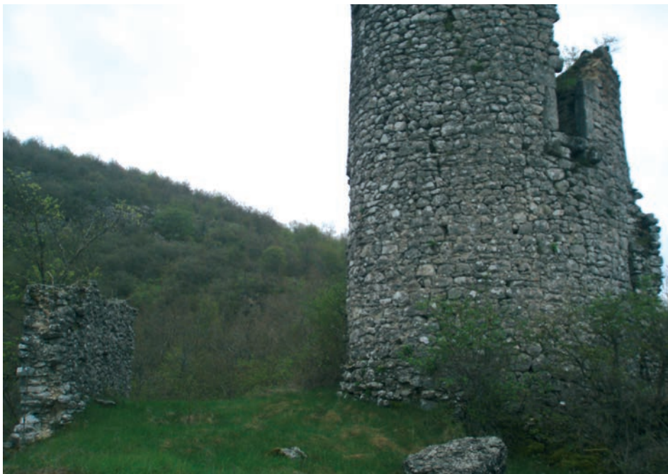
Sl. 24. Pogled na današnje stanje Štulića kule

tlocrta u zaselku Čalići, zabilježene kod Sabljara 1830. I ove su kule bile dio većeg obrambenog sustava koji je podignut na nižim pobrdima Sredogorja i može ga se pratiti u pravilnoj liniji sve do Perušića. 31