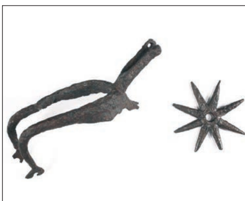
Sl. 22. Konjanička ostruga

Život lovinačkog prostora u osmanlijskom razdoblju, u arheološkom smislu je neistražen. Graditeljske aktivnosti vezane su uz nekoliko tipova utvrđenja, odnosno u samostojeće građevine (turske kule) ili one složenijeg tlocrta te one srednjovjekovne koje su proširene pod Turcima (Horvat 2013: 418). Sve su ove građevine vrlo jednostavnog tlocrta, a danas je prepoznatljiva u prostoru jedino Štulića kula u Gornjoj Ploči (sl. 24.) s donekle očuvanom visinom zida, pa i arhitektonskim detaljima poput prozora. Središnja građevina je kružna kula naslonjena na plašt ogradnog zida s unutarnje strane četvrtastog dvorišta. Uz nju su još evidentirane Batinića kula (možda na Međedači) i Čalića (Šalića ili Čabića kula) četvrtastog