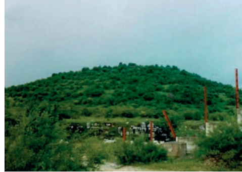
Sl. 3. Cvituša prije devastacije izgradnjom odašiljača

Položaj Cvituše (sl. 3.) u središtu ovog dijela Ličkog polja, geografskog tipa samostalnog i dominantnog uzvišenja, u potpunosti kontrolira prostor. Plato na vrhu je zaravnjen i ogoljene je površine s vrlo plitkim očuvanim humusnim slojem, što se mijenja prema zapadnom i južnom rubu te padinama koje su korištene kao naseobinske terase. Položaj nekropole nije ubiciran, a prema geomorfologiji terena, pretpostavljen je na sjevernoj strani, padinama i zemljanim gredama u polju. Vjerojatno iz ove nekropole potječe rukobran od spiralno savijena 41-og navoja brončane žice, koji svojim analogijama datira u početak starijeg željeznog doba, (9. st. pr. Kr.), što je „našast u starom grobu na desnoj mrtvačkoj ruci u Lovincu“, dok se kontinuitet u mlađe željezno doba može pretpostaviti prema nalazu brončane pincete „našasta kod sv. Mihovilja u Liki“. (Ljubić 1876: 10, 24, T.II/12)