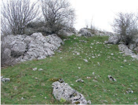
Sl. 2. Naseobinska terasa na Piplici