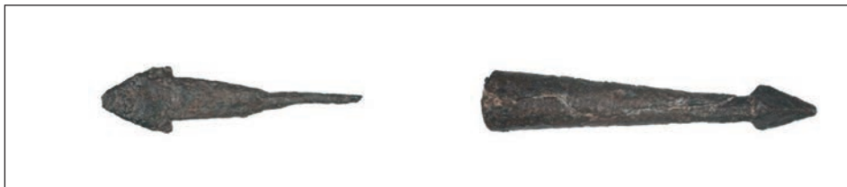
Sl. 20., sl. 21. Vrhovi strelica

namijenjen za lijevu nogu. Ulomci kasnosrednjovjekovne keramike čest su površinski nalaz na lovinačkom području, a veće količine pronalazimo u pećinama kao uobičajenim zbjeglištima u trenucima opasnosti. Iz Medvjede pećine, u kojoj se nalazi i obrambeni suhozid, potječe više ulomaka (sl. 23.), pronađenih nedaleko samog ponora, na desnoj obali. 30