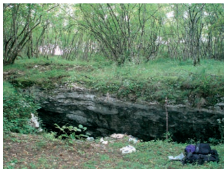
Sl. 11., sl. 12. Unutrašnjost i ulaz u Goveđu pećinu