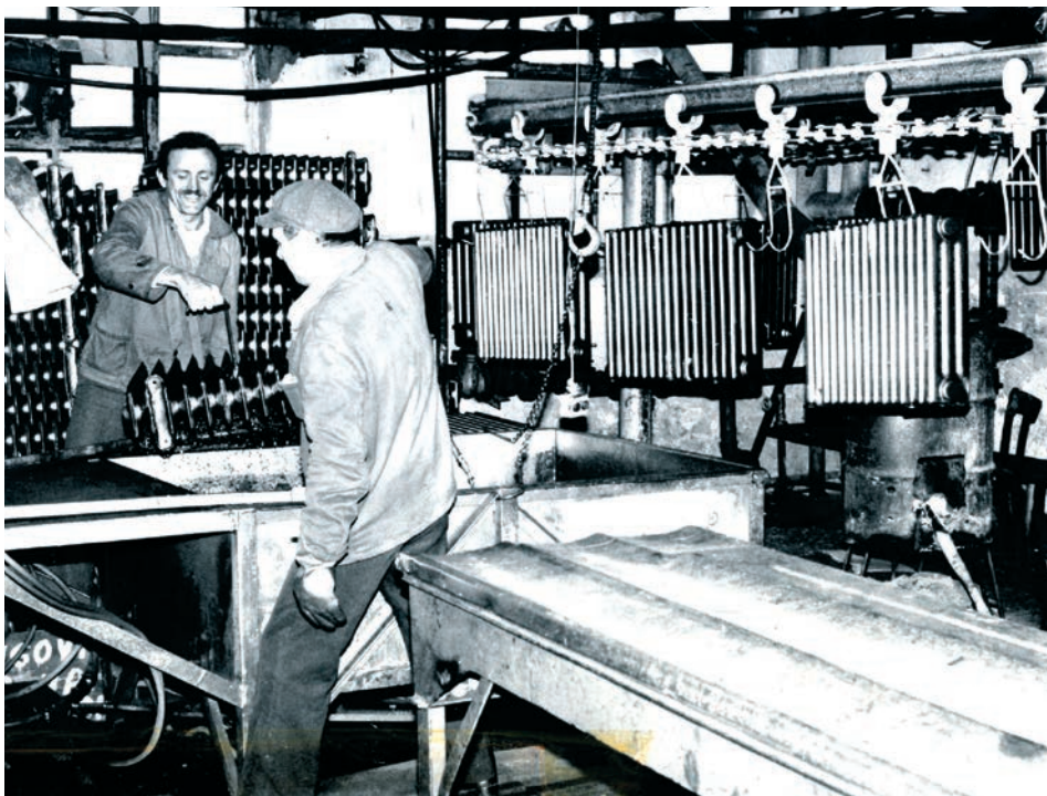
Sl. 3. HR-DAGS-112.4.3.30. Metalna industrija „Marko Orešković“ d.d. Lički Osik; Fotografije, Radnici OOUR Tvornice grijaćih tijela, Linija čeličnih radiatora, 12. 04. 1984., 13×18 cm

sletova, natjecanja, izleta, raznih svečanosti. Informiraju o društveno-političkim prilikama i obilježjima vremena u kojem su nastale npr. obilježavanje praznika, primanja u pionirske i omladinske organizacije i sl. Na matičnim arcima učenika srednjih škola fondova HR-DAGS-148. Centar odgoja i usmjerenog obrazovanja Nikola Tesla Gospić, HR-DAGS-248. Centar usmjerenog obrazovanja Otočac, HR-DAGS-272. Centar usmjerenog obrazovanja „Rade Končar“ Titova Korenica nalaze se portretne fotografije učenika, a isto tako sporadično se fotografije mogu naći i u fondovima uprave na pojedinim osobnicima ili dosjeima zaposlenika.