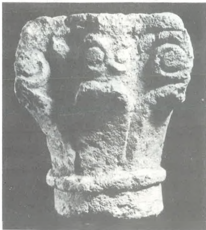
1 i 2, Radovin, Sv. Petar — Mj. 1:5