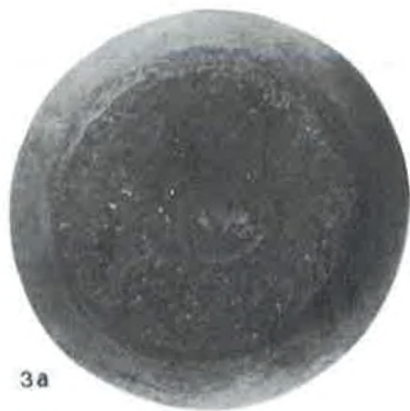
1, Ivoševci; antički Burnum, 2 — Mratovo Sv. Martin Mj. 1:1, 3 — nepoznato nalazište, šira okolica Nina — Mj. 1:2