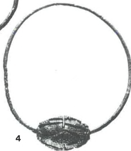
1—4, Smoković, položaj »Glavica« — Mj. 1:1