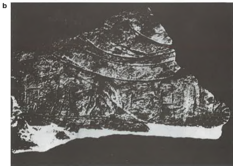
T. VII. Ulomak daunske stele (prednja i stražnja strana).