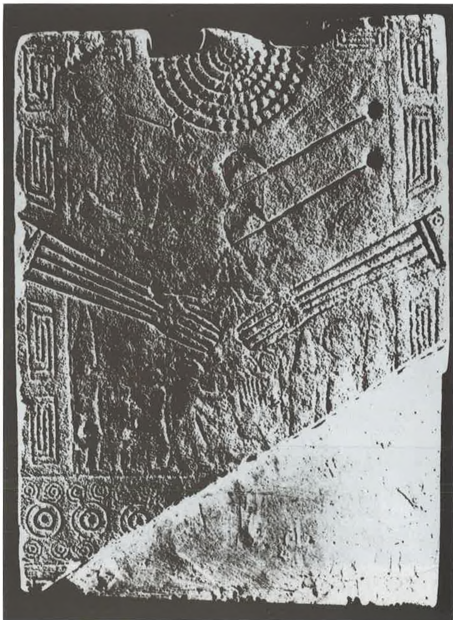
T. I. Daunska stela (prednja strana). Pl. I. The Daunian stele (front side).