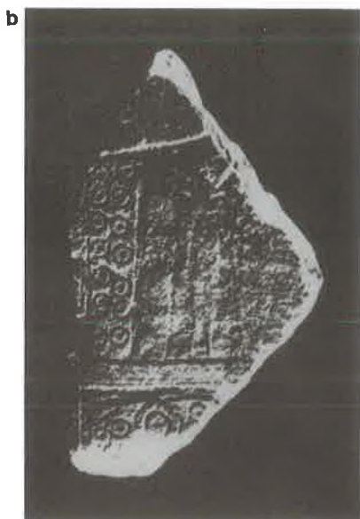
T. VIII. Ulomak daunske stele (prednja i stražnja strana).

Pl. VIII. Fragment of the Daunian stele (front and rear side).