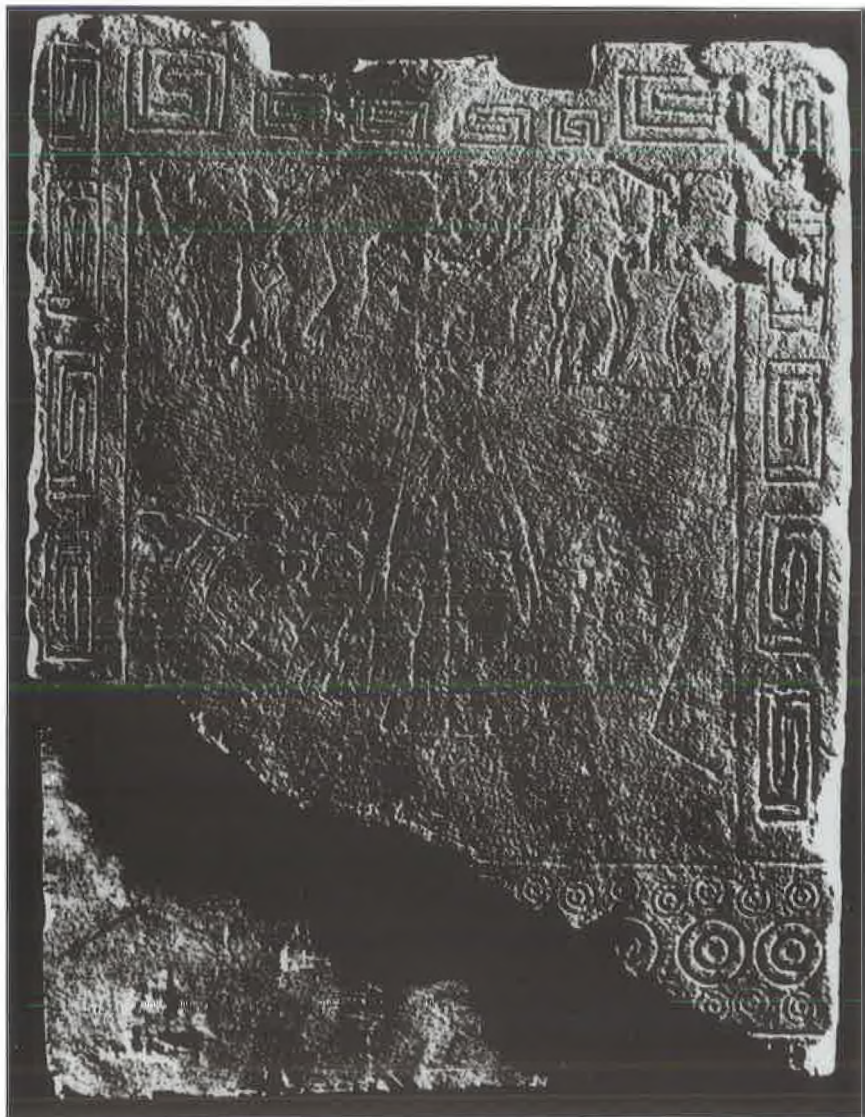
T. II. Daunska stela (stražnja strana).