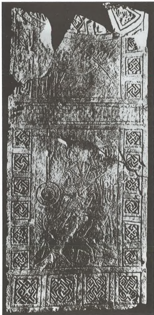
T. V. Daunska stela (stražnja strana).