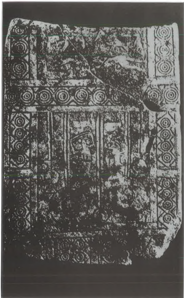
T. IV. Daunska stela (stražnja strana).

Pl. IV. The Daunian stele (revera side).