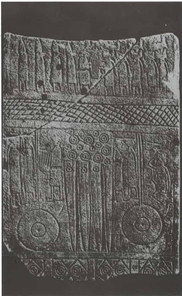
T. III. Daunska stela (prednja strana). Pl. III. The Daunian stele (front side).