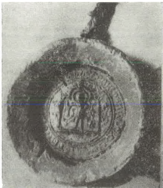
Pečat kninskog kaptola s likom Sv. Bartolomeja