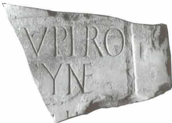
T. IV. 1. Stela Lelije Saturnine; 2. Ulomak nadgrobnog natpisa Eufrozine.