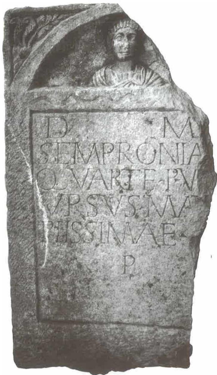
T. II. Stela Sempronije Kvarte. T. II. Stele of Sempronia Quarta.