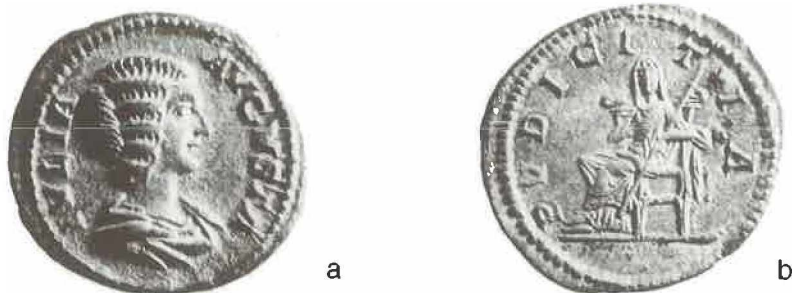
Sl. 2. Srebrni denar Julije Domne.

Spomenuta frizura tipa Gabii lijepo se vidi na novcu ove carice, kovanom između 193. i oko 210. godine nove ere. Varijacije postoje jedino u veličini čvoraste punde na zatiljku. Donosimo prikaz rimskog denara, doduše nađenog na području Sotina kod Vukovara 56 na kome se lijepo vidi ovaj tip frizure Julije Domne. Kovnica je rimska (196.-211.). 57