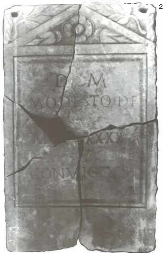
T. III. 1. Stela ropkinje Pretorine; 2. Stela Modesta.

T. III. 1. Stela of Pretorina the slave woman.; 2. Stela of Modestus.